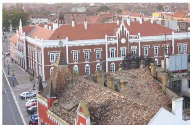
Зграда Магистрата, почетак XIX в.

??? ??? ?? ?????????????? ?????? ?????????????????? ?????????????????? ?????????????? ?? ??????? ?? ???????-????? 1997–2002. ??????????? ?? ? ?????????? ??????. ??????? 2009. ??????? ?? ??????? ?? ?? ?????????? ?????????? ??? ??????????-????????????? ?????????? ?? ?????????? ?????????? ? ?????????? ?????? ? ? ?????????????? ??????????????????. ??????? 2011. ?????????? ?? ? ?????????? ?????????????????????? ?????????????????? ??????? ? ??????? ?.. ? ?????????????????????? ?????? ?????????? ??? „????????????“. ??? ??????? ?????????? ?????????? ? ??? ?? ?? ?? 2013. ?????????? ?????????????? ??????? ?? ?????????, ?????????????????? ? ?????????????????? ?????????? ?????????? ??????. ? ??? ?????????? ?????????????? ??????? ?????????? ?? ?????????????? ? ?????????? ?????????? ??????.