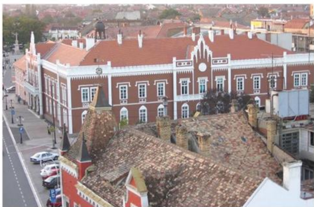
Зграда Магистрата, почетак XIX в.

??? ??? ?? ?????????????? ?????? ?????????????????? ?????????????????? ?????????????????? ?? ?????????? ?? ?????????-?????? 1997-- 2002. ?????????????? ?? ? ??????????? ??????. ??????? 2009. ?????????? ?? ?????????? ?? ?? ?????????? ?????????????? ??? ?????????????-????????????????? ?????????????? ?? ?????????? ?????????????? ?????????????????? ? ?????????? ?????? ? ? ????????????????? ??????????????????????. ??????? 2011. ?????????????? ?? ? ?????????? ?????????????????????? ?????????????????????? ?????????? ? ?????????? ?. ?????????????????????????? ?????? ?????????? ??? „?????????????”. ??? ?????????? ?????????????? ?????????????? ? ??? ?? ?? ?? 2013. ?????????????? ?????????????????? ?????????? ?? ??????????, ?????????????????????? ? ?????????????????? ?????????????? ?????????? ??????????. ? ??? ?????????????? ?????????????? ?????? ?????????? ?? ?????????????? ? ?????????? ?????????? ???????.