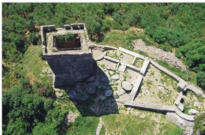
Вршачка кула, XV в.

?????? ?? ?????????? ?. ?? ?????????????? ?????????? ?????????????????????? ??????????, ?????????? ?????????? ?????? ?? ????? ?????????? ??????? ?????????? ??? ?????????? ??????? ??? ??????. ?????????? ?????????????? ?????????? ? ?????????????? 1552. ?????????????? ?? ?????? ? ??????? ?????????????????? ??????. ??????? ?????????? ?????????? (1716) ? ?????????? ?. ?????????? '?????? ?????????? ?????????????? 1718. ?????????????????? ' ?? ?????????? ? ?????????? ??? ?????????.