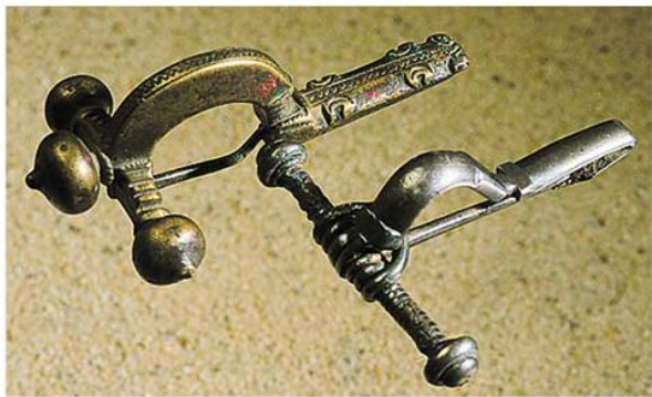
Римска фибула (Градски музеј Вршац)

????????? ?? ?? ?????????????? ?????????? ??? 2 ?? 2 , ??? ??