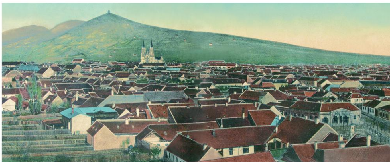
Вршац почетком XX в.

?? ?????? ?????? ?????? ?? ?????????? ?????? ?????????? ?????? ?????????? ?????????????? ?????????????? ?????????????, ?????????? ?? ?????????? ?????, ?????????????? ?????????????, ?????????????????? ?????????? ? ??. ?? 1910. ????? ?????????????? ?????????? ?? ?? 26.941.