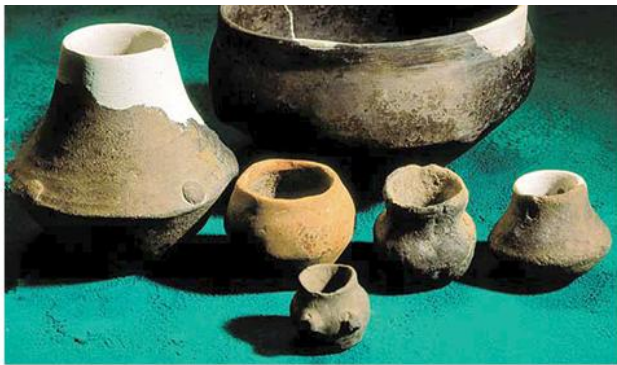
Зделе и минијатурне посуде, Потпорањ–Кремењак (Градски музеј Вршац)

????????? ?????????? ? ?????????? ?????????? ? ????? II ?