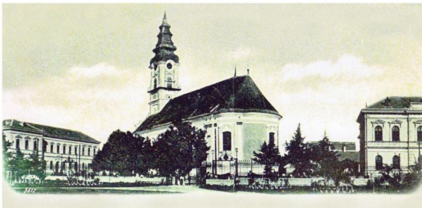
Саборни храм, 1785.

? ?????????????? ?????????? ??? ?? ?????????? ?????? ? ??????? ?????????? ??????????. ? ?????? ?????? ?? ??????? 29.411 ??????????????, ? ?? ?????????????? ?????? ??. ??? 38.716. ?????? ??? ?? ??????????? ?????????????? ??????????