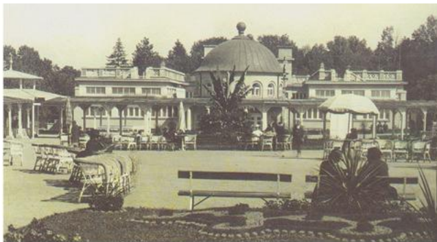
Старо термоминерално купатило, 1936.

???? ?? ????? ??????????? ??????, ??? ????? ??