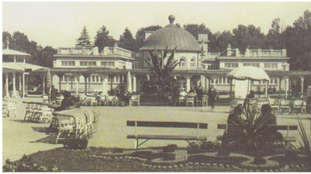
Старо термоминерално купатило, 1936.

???? ?? ????? ??????????? ??????, ??? ????? ??