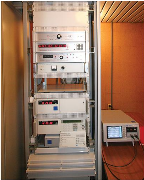
Атомски сатови који се користе за национални еталон времена (ДМДМ)

XX ? . ?????? ???? ? ? ??????? ? ? ????? ????????????? ? ?