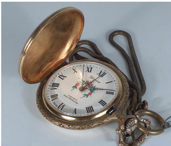
Цепни сат, Швајцарска, почетак XX в. (МНТ)

???????? XX ?. ?????? ????????? ?????????, ?????? „????????? ?????“, ???? ? ? ????????? ?????????, ????????? ? ? ???? ?????????????????????? ?????????????-???????? ?????????, ???? ???? ?????? ?????????? ? ?????? ????????? ??????????????. ??? ?????????????????????????? ?????? ????????? ? ? ???? ?????????????? ??: "X ? ? ?????????, ?????? ? ? ?????? ????????????? ????????????? ? ? ???? ???? ?. ?????? ???? ????????? ?????????????.