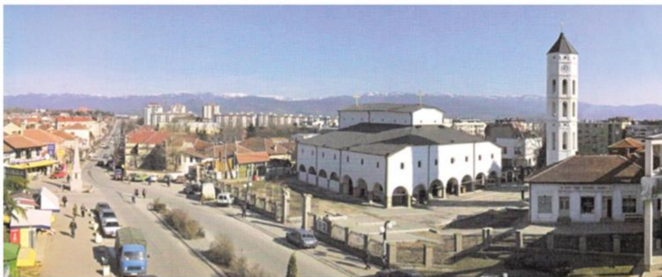
Врање, панорама са црквом Св. Тројице