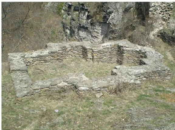
Остаци темеља цркве унутар утврђења Марково Кале

????? ?? ?????????????????? ?????????? ?????????????????? ?????????? ?? ?????? ?????? ?????????? ?????????????? ? ??????, ????????????? 1820. ?????? ??? ? ?????????? ?????????????????? ? ?????????????????? ?????????????? ??????????. ?????????? ?? ?????????? ?????????? ?????? ?? ?????? ?????????? ?? ??????. ?????????? ?? ?????? ?????? ?????????? ?????????????? ?? ?????????????? ??????o? ?????? 1822, ? ??? ?? ?????? ?????????????????? ? 1869, ????? ?? ?? ?????????? ?????? ??????.