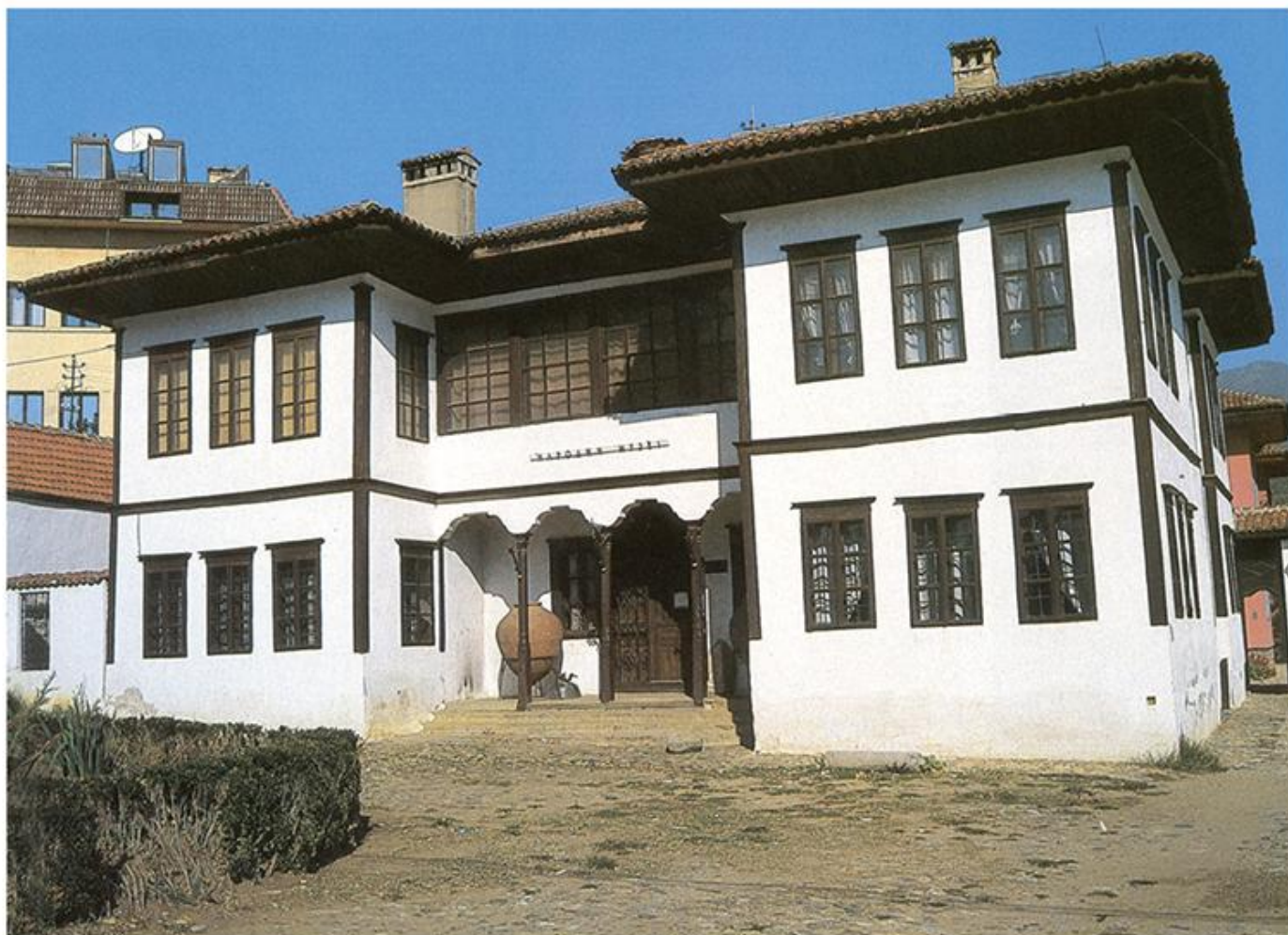
Пашин конак, данас Народни музеј, 1765.

?????? ?????? ? ?????? ??????? ??????? ?? ?? ??? ??????? ??????? ????? ?? ??? 1765. ??????? ?????-??? ??????. ?????? ??????, ????? ?? ??????? ?? ??????, ?????? ?? ??? ??????? ?? ?????????? ????? ? ?????? ??????, ??? ?? ?????, ????? ?? ??????? ?? ?????, ??? ?????? ?????????, ?? ?????????? ??????? ?????. ??? ?????? ?????? ?????????? ?????????????, ?? ?????????? ??????? ?? ?????? ?????????? ??????. ??? ????? ?????? ??????? ?????????????? ?????????? ? ??????, ??? ?????? ?? ??????? ??????? ?????? ?????? ? ?????? ?????????? ?????????? ?? ?????? ??? ? ?????????, ? ?????? ?? ?????????? ??? ?? ??????????. ?????? ?????? ?????? ??????, ?????? ?????????? ?? ?????? ?????????????? ?????????? ??? ?????????? ??????. ?? 1881. ?? 1932. ? ??????? ?????????? ?????????? ?? ?????????, ? ?????? ? ??????. ? ?????????? ?? 1962. ??? ??????? ?????????????? ??????????? ?????, ??? ?? ??????? ??????? ?????????? ? ?????????, ? 1977. ? ??? ? ?????????? ??????. ?? 1964. ?? ?? ?????? ??????? ?????, ??????? ??? ?????????? ??????? 1960.