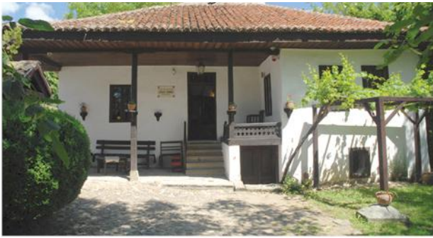
Кућа, данас Музеј Боре Станковића, 1855.

???????? ?????????? ??????????-????????????? ?????? ? ?.