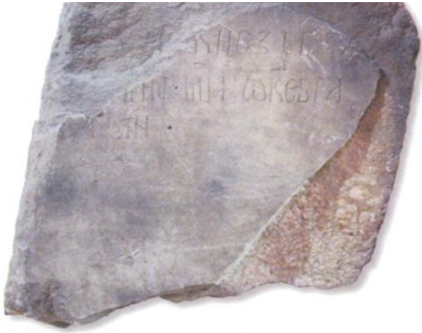
Надгробна плоча кнеза Балдовина, црква Св. Николе, XIV в. (НМБГ)

????? ?? . ?????? ? ? . ?????????? ?? ?? ?????