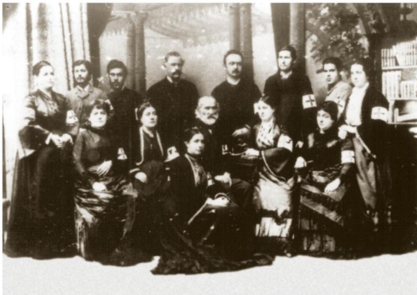
Др Јосиф Панчић са лекарима, медицинарима и добровољним болничаркама у резервној војној болници у Београду, 1885.

??? ?????? ?????? ? ?????????? ?? ?????????? ??????????. ?? ??????? ??????? ??????, ?????????? ?? ??????? ??????????, ??? ?? ??? ??????? ???????.