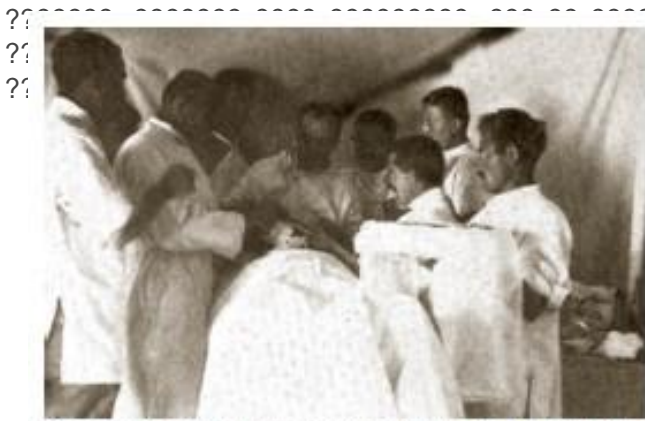
Операција у Првој пољској хируршкој болници у Драгоманцима

?? ???? ???? , ? ?????? ?? ??? ?????? ?????, ? ??? ? ???? ????????????? ??????, ?? ?? ?? ?? ?????? ?? ?? ???? ?? ??????????, ???? ?? ????? ?????????.