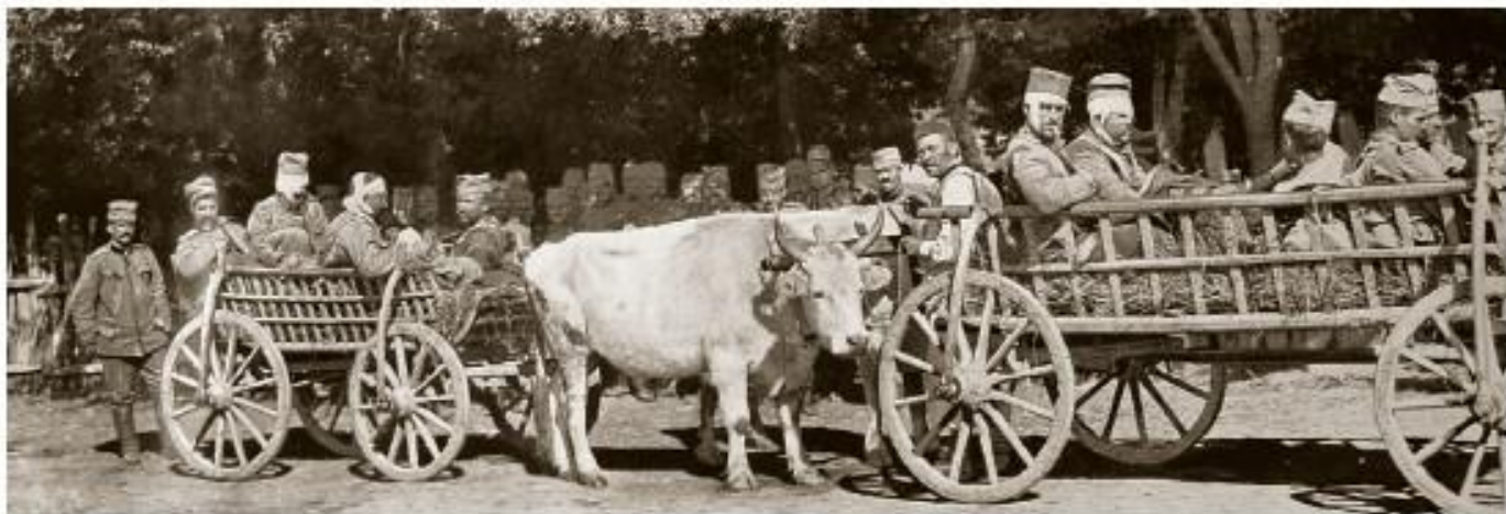
Санитетска колона, транспорт теже рањених у болнице у унутрашњости

??????, ?????? ?? ????? ?????????, ? ????? ? ?????. ??????? ?? ??????? ?? ?????? ???????????, ??????? ??????????? ??????? ? ?????? ?? ??????? ?? ?????????, ?????? ?? ?????? ???????, ?? ?????? ??? ?????????? ???????, ?? ?????? ????, ??? ?????? ?????????? ??????? ?????? (????????? ?????? ? 12 ????????????? ???????) ? ?? ??????? ?????? ??????. ?????? ?????????? ??????? ??????? 1915, ?????? ?????????? ?? ?????? ? ?????????? ?? ??????????? ??????????, ?? ?????? ? ?????????? ??????????????. ? ?????? ?????????? ??????? ?????????????? ? ?????????????????? ??????, ?????????? ?? ?????? ?????? ?????????, ? ? ??????, ? ? ??????????. ?????????????? ?????????????? ?????????, ? ????????? 1916-1918. ?????? ?????????? ? ?????????? ?? ?????????? ? ??? ? ? ?????? ? ?????????? ??????? ??????? (?????? 41.153, ?????? 3.005). ??? ????????? (?????) ?????? ?? 50.000 ????????? ?????????.