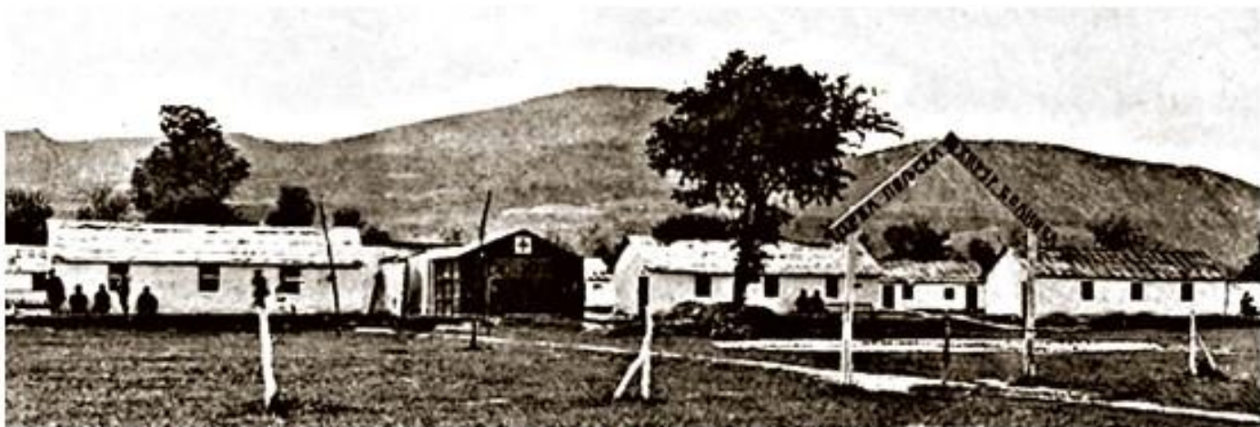
Прва хируршка пољска болница Врховне команде у Драгоманцима, 1918.

?? ??? ??????? ?????????? ?????????????? ?? ? ?????? ??????? ??????? -- ??????? ??????. ?????????? ?????????????? ??????? ??????: ?????????? ?????????, ?????????? ?????? ?????????????? ? ??? ?????????? ???????, ??? 1914. ?? ??????????? ?? ?????????? ?????????????????? ?????? ?? ??????????. ??? ?????????? ?????????? ?????????? ?? ??????? ?? 500.000 ?????????? ??????? ?? ?????????? ?????????????? ??????? ? ??????. ???, ?????? ??? ?????????????? ?????????? ?????????????????? ???????, ? ??????? ?? ?????? ??? 45.000 ?????????? ?????????????????, ? ?????? ?????? ??? 3.000 ?????????? ? ?????????? ?? ?????????? ??????. 2. 2. ?? ? ??? ?????? ?? ?????????? ?????? ??????????? ?? ?????? ??????????