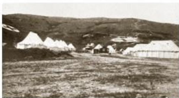
Болница кнегиње Нарискин на Солунском фронту

?? ????????? ??????, ?????? ????????? ??????????? ??