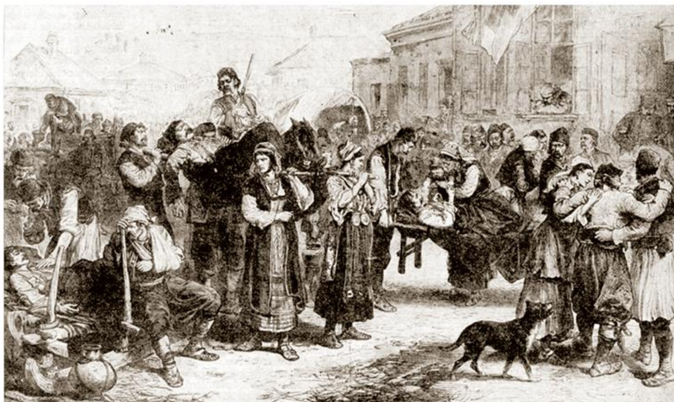
Прихват српских рањеника у Ивањици за време Првог српско-турског рата, цртеж

?????? ?? ??????? ?? ??: ??? ? ????????, ??? ? ??????? ? ????????. ??? ?????? ?????? ??????? ????? ??????? ?? ?????? ? ?? ????????, ??? ?????? ??????? ? ????????, ??????? ?????? ??????? ????? ? ?????????????? ??????. ?????? ?? ?????? ????????, ??? ??????? ?????????? ?????????????? ?????????, ?????? ??? ???? ?? ?????? ??????? ?????????????? ? ?????????????????? ?????? ?????????.