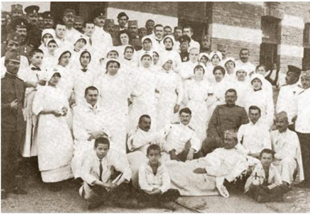
Болница Кола српских сестара у Београду, 1912.

1912, ????? ?????? ?? ??????? ???????, ? ? ??????? ?????????? ??????? ?? ???????????.