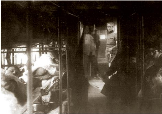
' ?????????????? ? ?????? ??????????. ? ????????????? ???????????.

? ?????????? ??????????. ??????? ??????? ?????????? ????????? ?? ?????????????? ? ? ????? ?? ?????????????? 296 ??????? (? 370). ????????? ??????? ?? ???? ????????????? ???? ????????? ? ??????? ?? ??????? ??????????, ???? ?? ?? ??????????? ?? ?????? ???????, ?????????? ??????????? ?.. ?., ? ???? ????????????? ? ?????????????? ???? ???? ?????? ???????, ??????????: „? ? ??????? ??????? ?.. ?., ??? ?????? ???? ?????? ?????????????? ??????? ?????????? ? ?????????? ?????????????? ?????????“. ????????? ??????? ?????????????? ???? ???? ?? ?????????????? ??????, ? ??????????