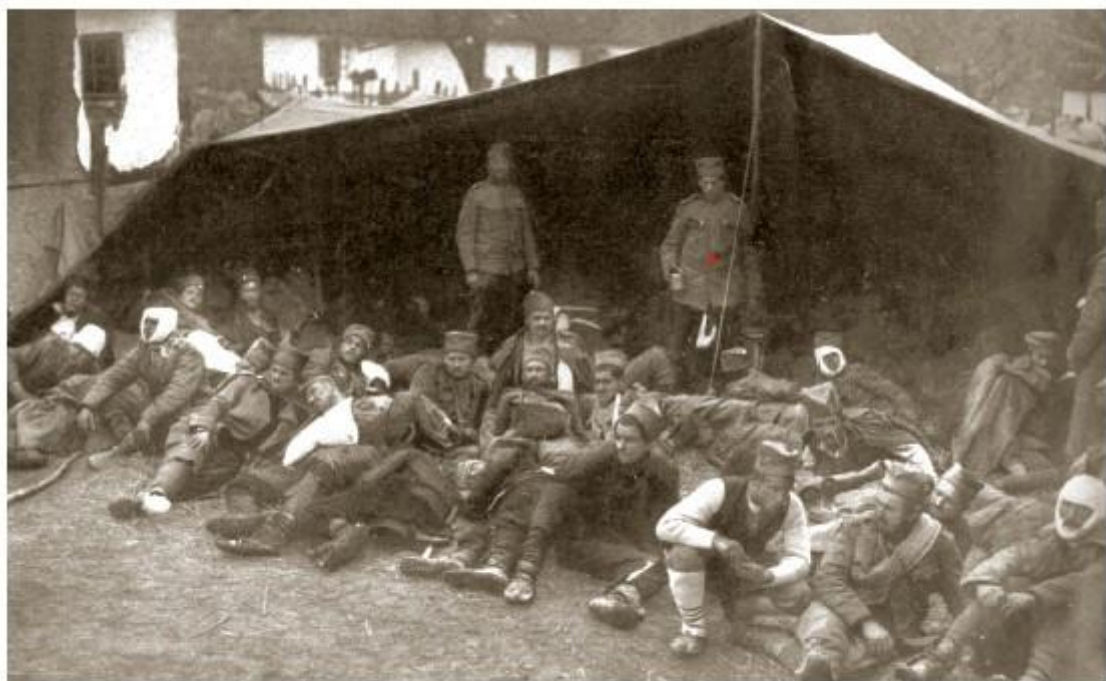
Дивизијско завојиште у Првом светском рату 1914–1915, рањеници Гвозденог пука после борбе код Црне Баре у Мачви

? I ?????????? ??????. ?????? ?? ????? ?????????? ??????????? ?????? ?????????????? ??????. ??? ? ??? 1914. ?????????????? ?? ?????? 400.000 ??????????. ?????????????? ?? 10–30% ?????? ?? I ??????, II ?????? ?? ?????? ????? ??????, ? III ?????? ??? ?????????. ?????????? ??????? ?? ?????? ??????????? 150.000 ?????????? ?????????????? ??????, ?? ?????????? ??? ?????????? ?????? ? ?????? ?????????? ?????? ?? ??????????????????. ?????? ????? ???????????, ?????????????? ? ?????????????? ??????????, ??? ??? ?? ?????? ?????????????????? ? ??????: ? ??????, ??????????????? ?????????????? ?????????? ? ?? ?????? ?? ?????? ? ??? ?????????? ??? ?????????? ??????????