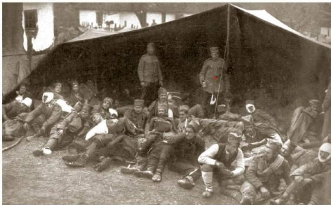
Дивизијско завојиште у Првом светском рату 1914–1915, рањеници Гвозденог пука после борбе код Црне Баре у Мачви

? I ?????????? ??????. ??????? ?? ?????? ?????????? ?????????????? ??????? ?????????????? ?????????? ??? ? ?????? 1914. ?????????????? ?? ?????? 400.000 ??????????. ?????????????????? ?? 10--30% ??????? ?? I ??????, II ?????? ?? ?????? ????? ???????, ? III ?????? ?????? ??????????. ?????????? ?????????? ?? ?????? ?????????????? 150.000 ?????????? ?????????????? ???????, ??? ?????????? ?????? ?????????? ?????? ? ?????? ?????????? ??????? ?? ??????????????????????. ??????? ?????? ?????????????, ?????????????????? ? ?????????????????? ??????????, ?????? ??? ?? ??????? ?????????????????? ? ??????: ? ???????, ?????????????????? ?????????????? ?????????? ? ?? ?????? ?? ??????? ?????????????? ?? ?????????????? ??????????????