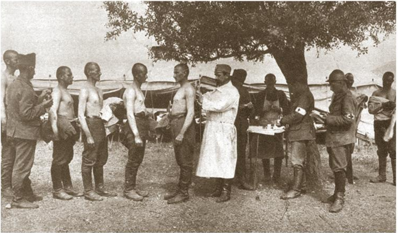
Вакцинација српских војника против тифуса и колере на Солунском фронту

?????? I ? II ????????? ??????. ? ?????????, ? ?????? ? ?????????, ?????? ?? ????????? ?????????? ??? ?? ????????????? ??????: ? ??. ??. ????????? ?? (????? ??? ?????????) ????? ?? 30% ??????, ? ?????? ?? ?? ??????????. ????? ????????? ?????????? ??? ????????? ?? ????? ?????????? ?????? ?????????? ?????? ?? ?????????? ?????????????? ? ????????? ??????? ??????? ??????????????. ??? ? ????????? ?????? ?? ?????????? ???????, ?????? ??? ?????? ?? ?????????, ? ?????? 1924, ????????? ??????????????, ? ??? ??????? ??????????. ????? ?? ????? ?? 50 ????????? ??????? ??????? (?????? ?????????????????? ??????????). ????? ????????? ?? ?????????? ?????????????? ?? ?????????? ? ??????????????, ? ????????? ?????????????? ?????????? ? ?????????? ??????? ?? ????????? ?????????? ?????????? ?????? ? ?? ??????? ??????. ????? ??????????????? ?????? ?? 1936. ????? ?? ????????? 620 ??????, ? ?????? ?? ?? 265 (55 ?????????), ?? 1940. ????? ?? 321 ?? 686 ??????????.