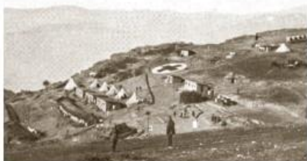
Француска болница на Солунском фронту