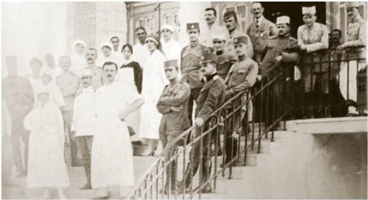
Особље испред Српске болнице престолонаследника Александра у Солуну

????? ??????? ??????? ?? ??? ??????????, ?? ??????? ?? ??, ??????? ?? 45.861 ?????, ????? ?? ?? ??? ? ??????? 68.458 ?????, ????? ? ????????? ? ????? 138.600, ? 306.603 ?? ??????? ??? ???????, ????????? ? ??????? ?? ??????????. ??????? ????? ??????? ?? ??????? ?? ?? ????????? ?? 559.522 ???. ?? ??????????? 711.343 ??????? ?? 16. VII 1916, ?? ?? ?? ??????? 151.821 ??????. ?? ??????? ?? ?? ????????? ?? 461.150 ??????? ? ??????. ?? 15. VI 1918. ??????? ?? ?? ??????? ?? 21.633 ??????? ? ???????, ? ?? ??????????????? 5. V 1920. ??????? ?? ?? 500, ? ????? ?? 3.500 ??????? ? ??????. ????? ??????? ??????????? ??????????? ??????, ????? ?? ??? ????? ??????????????: ?? ????? ??? ????? ????????? ??????????? ?? 1/3 ????????????? ? 2/3 ????? ????????????????? ?????????????? ??????????? ?? ?? ??????????? ?? ??????????? ? ????????? ???????????, ??? ?? ? ?????, ????? ????? ?????????, ??????? ?? ?? ??????? ?? ?? ????????? ????????? ???.