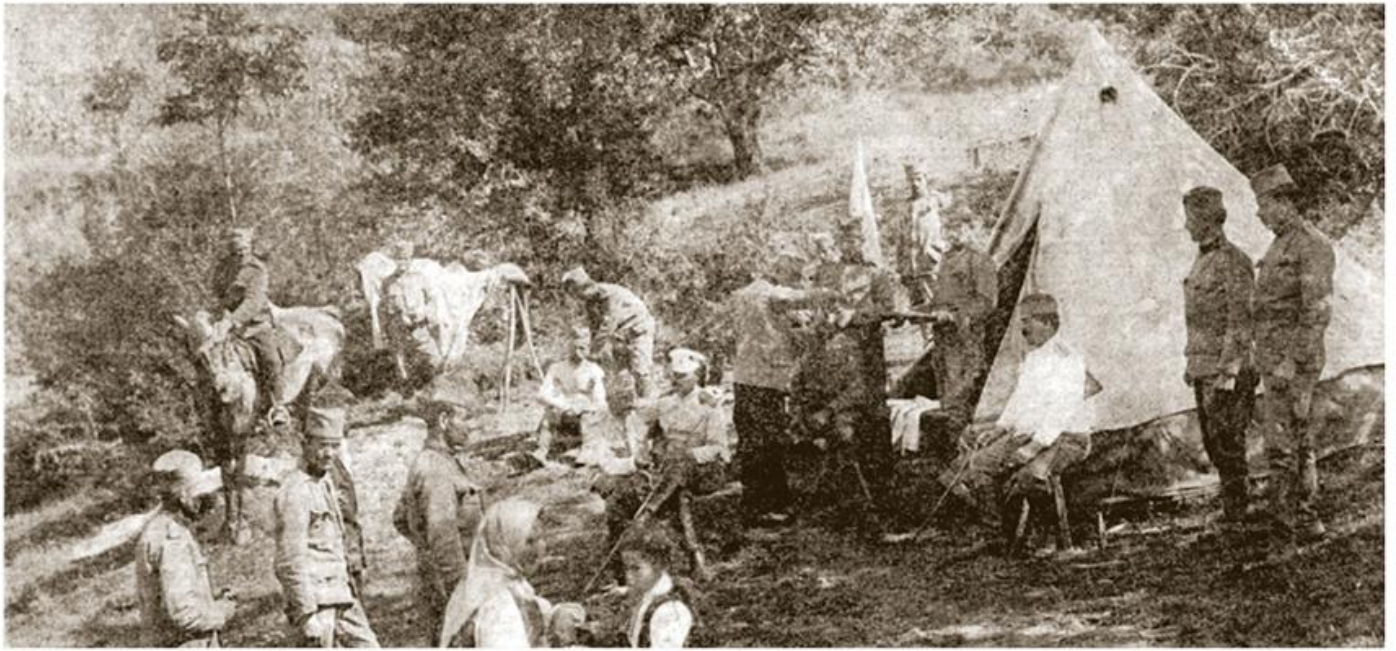
Амбуланта и пуковско превијалиште српске војске на положају, Раковачка коса код Пирота, јул 1912.

???????? ????? ?????? ? ??????????) ? ?? ??? ??????? (????? ????????? ?????? ??????? ? ?????).