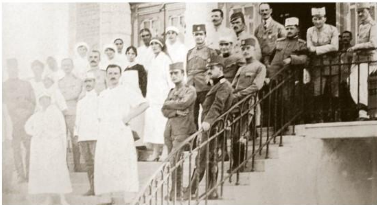
Особље испред Српске болнице престолонаследника Александра у Солуну

????? ????????? ????????? ?? ????? ?????????????, ?? ????????? ?? ???, ????????? ?? 45.861 ??????, ?????? ?? ?? ???? ? ????????? 68.458 ?????????, ??????? ? ????????????? ? ??????? 138.600, ? 306.603 ?? ????????? ????? ??????????, ??????????? ? ????????? ?? ? ??????????????. ??????? ?????? ??????? ?? ????????? ?? ??? ??????????? ?? 559.522 ??????. ?? ????????????? 711.343 ????????? ?? 16. VII 1916, ?? ??? ?? ??????? 151.821 ??????. ?? ?????????? ?? ??? ??????????? ?? 461.150 ????????? ? ??????????. ?? 15. VI 1918. ??????????? ?? ??? ?????? ?? 21.633 ?????????? ? ?????????, ? ?? ??????????????????? 5. V 1920. ??????????? ?? ??? 500, ? ?????? ?? 3.500 ????????? ? ?????????. ?????? ??????? ????????????? ????????????? ???????, ?????? ?? ????? ?????? ??????????????: ?? ?????? ????? ?????? ?????????? ??????????? ?? 1/3 ??????????????? ? 2/3 ?????? ????????????????????? ??????????????. ?????????????? ?? ??? ????????????? ?? ????????????? ?? ? ??????????? ?????????? ??????, ????? ?? ? ??????, ?????? ????? ???????????, ??????? ?????? ??????? ?????? ?? ??????????? ?????????? ???.