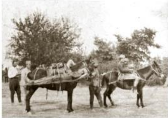
Транспорт рањеника коњима

?????. ?? ??????? ?? ?????? ?????? ?? ?????? ?????????? ??? ?????????? ?????? ??????. ?????? ?????? ?? ?????, ?????, ?????, ?????, ?????? ? ?????????? ??????, ?????? ?? ?????? ?????????? ??????????? ? ? ??? ?? ?????????? 2.500 ??????, ?? ? ???? ???? ?? ?????????? ??????. ??????? ?? ?? ?????, ???????, ??????, ?????, ?????????, ?? ?????????????? ??????. ????????? ?? ?????? ?? ?????????, ?? ?????? ?? ?? ? ? ? ? ??????????? ?? ?? ?????. ??? ?????????? ?? ?????????? ?????????? ??????. ??????????? ?? ?? ?????? ?? ?????? ?????????? 2.000--3.000 ??????, ? ?????? ?? ?????????? ? ?????????? ???. ? ??????????, ?? ??????????? ?????????? ?????????? ?? ??????????, ?? ?????? ?? ?????????? ?????????? ? ????????? ? ????,