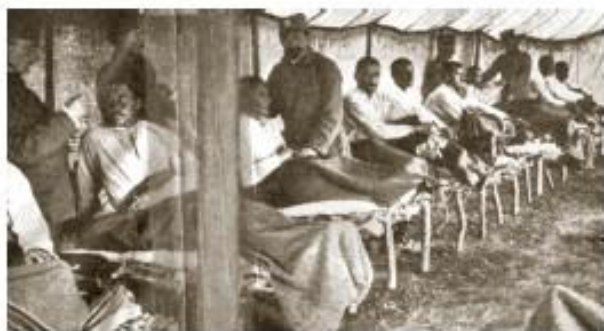
Збринути рањеници чекају евакуацију