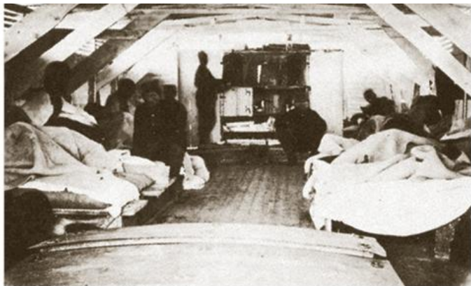
Унутрашњост болесничке бараке на броду-шлепу, 1876.

? ?????? ??????-???????? ???? (1877--1878)