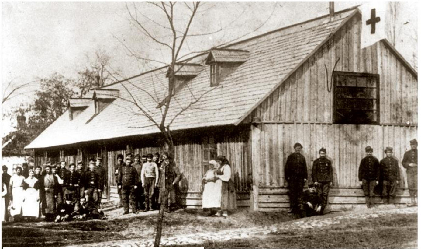
е болнице у Београду, 1876.