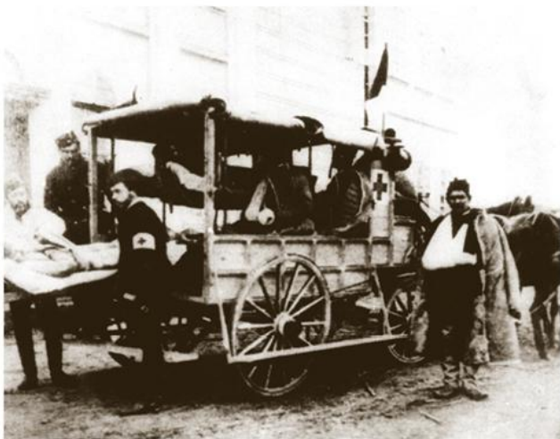
Превоз рањеника с фронта, 1876.

?? ??????? ????? ??????? ?? ??????? 60 ??????? (19