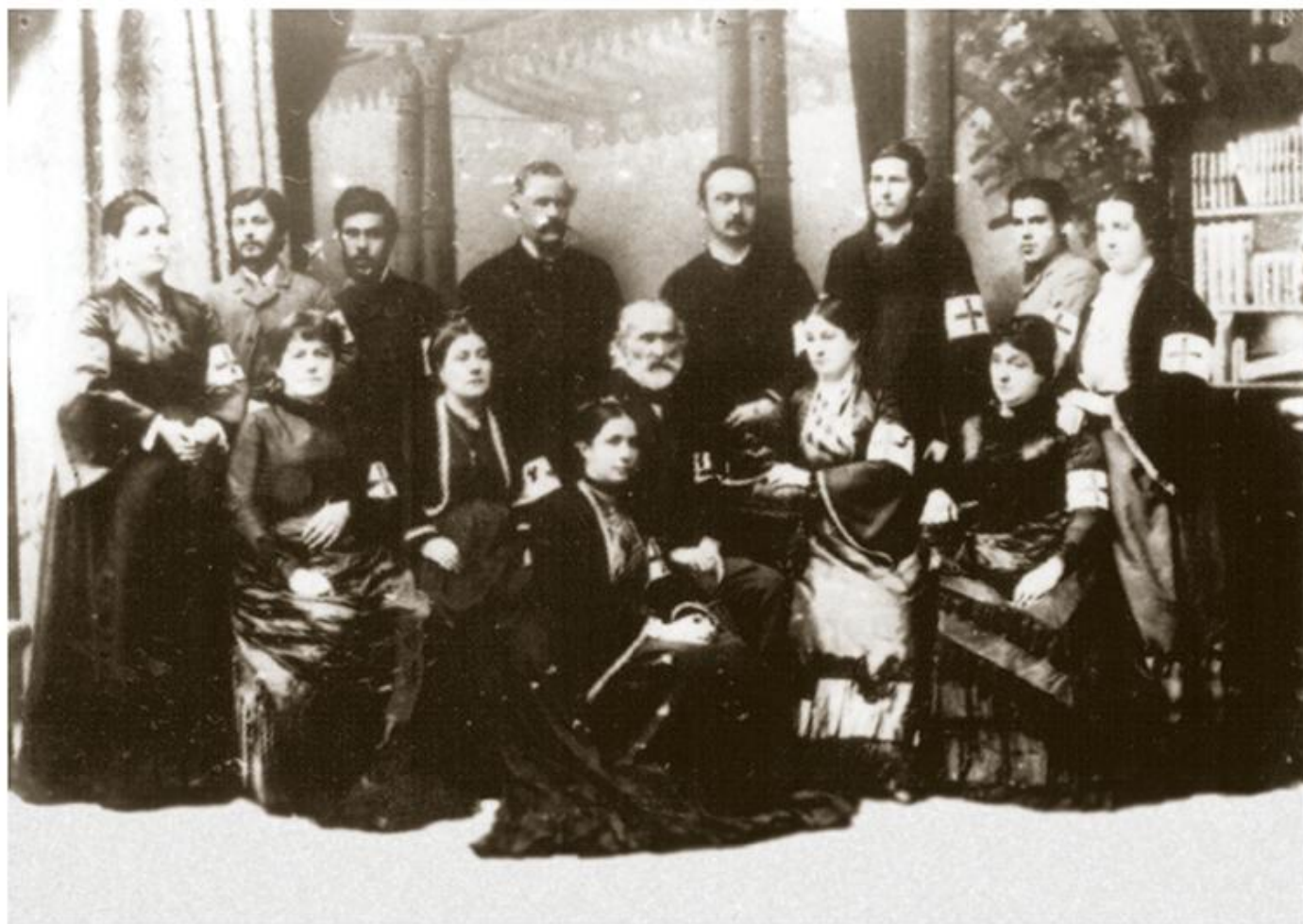
Др Јосиф Панчић са лекарима, медицинарима и добровољним болничаркама у резервној војној болници у Београду, 1885.

??? ?????? ?????? ? ?????????? ?? ?????????? ??????????. ?? ??????? ??????? ??????, ?????????? ?? ??????? ??????????, ??? ?? ??? ??????? ???????.