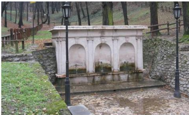
Каптажа, Хајдучка чесма у Топчидеру са ограђеном ужом заштитном зоном

?????????? ?????????? ????, ?????? ?????????????