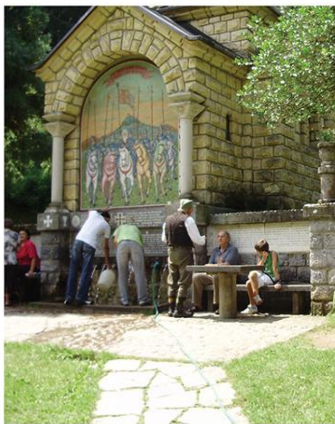
Чесма у Тршићу