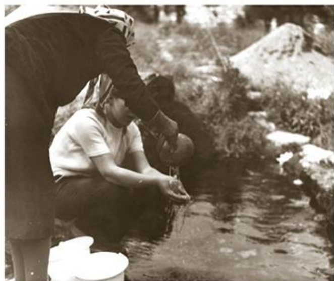
Посмртни обичаји, Злот код Бора (ЕМБ)