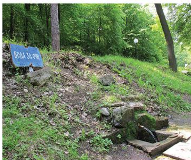
Култ воде, Источна Србија