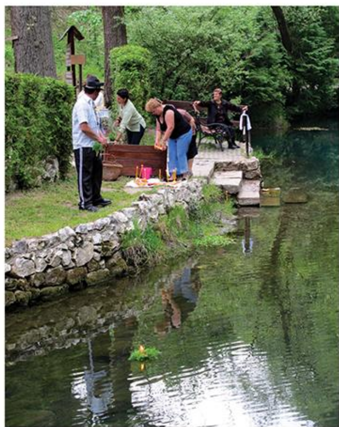
Изливање воде на задушнице, Источна Србија