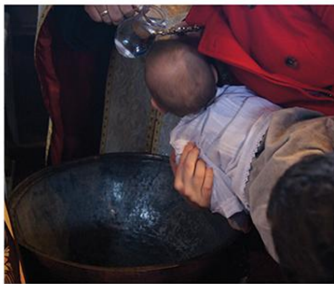
Крштење, Земун