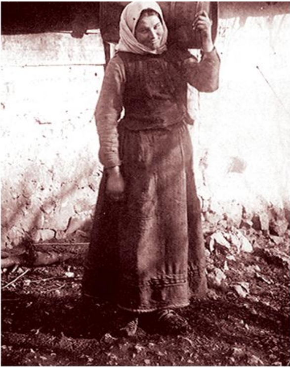
Жена носи воду (ЕМБ)

???? ?? ? . ?????? ??????? ???????, ???? ???????????????