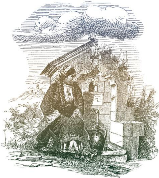
Ф. Каниц, Жена сийа воду, цртеж

? ?????? ???? ????????? ?????????? ??. ?? ?????????????? ??????????. ?????????????????? ?? ?????????? ?? ?? ? ?????? ?? ?????????????? ??? ?????? ??. ?????????? ? ?????????????? ? ?????. ?????????????????? ??????? ?????????? ?? ?????? ?? ?????????????? ??? ?????????? ?????????????????? ?????????? ? ???? ?? ?? ?????? ??????. ? ?????????? ?????????????? ?????????? ?????????????????????? ?? ?????????? ?? ??. ? ??????????????. ?? ?????? ?? ?? ??. ?????????? ?????????? ?? ?????????? ?? ?????? (?????, ????), ?? ??????? ?? ?????????? ??. ? ???? ?? ?????????????? ??????? ?????? ?? ?????????? ? ??????????; ?????? ??? ?? ?????????? ? ?????????? ?????????????? ???????, ? ???????????, ?????? ?? ?????????? ??. ???????, ? ??? ??? ??????? ??????. ? ?????????????????? ??????? ? ?????????? ?????? ??????? ?????????? ?? „?????????“ ??? „?????“ ??. ?? ??? ?????????????? ? ??????????, ??????? ??????? ?? ?????????? ??????. ? ?????????? „?????????“ ??. ??????? ? ??????? ??????. ??????? ?????? ??. ?????????? ? ??????? ?? ??????? ?????????? ?????????? ?????? ? ?????????????? ? ?????? ?? ?????????? ??????????, ?????????? ?? ?????? ?? ??????. ?. ?? ??????? ?? ??????? ? ?????????? ?? ??????. ? ' ? ?????? ?????? ?? ?????????? ??????, ??? ?????? ??????? ???