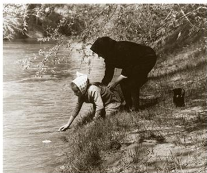
Посмртни обичаји, Дупљаја код Беле Цркве (ЕМБ)