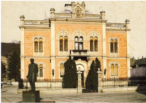
Владичански двор Епархије бачке, Нови Сад