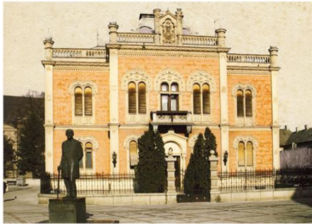
Владичански двор Епархије бачке, Нови Сад