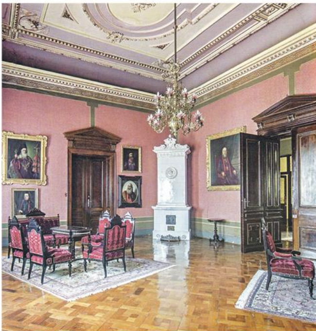
Пријемни салон Владичанског двора Епархије бачке

?????? ?? ? ??????????? ?????? ??????? ? ?????????????? ?????? ?????????? ???????, ?? ????? ???? ?????? ? ??????????. ?????????? ?? ?? ?????? ?????? ?????????????? ?????? ? ?????? ?????, ????? ?? ?????????? ??? ????????????????????? ????????? ????????????? ????????????? 1741, ? ?????????????? ?????????? ??? ????????????? ??????????