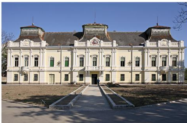
Владичански двор Епархије банатске, Вршац

????????? ??????, ??????? ??????? ????? ?????? ???????. ?????? ?????, ?? ????? ????????????? ?????? ?? ??????????? ??????? ????? ?? ??????????? ? ?????? ??????? ??????, ??????????? ?? 1984. ?????????? ??????? ?!