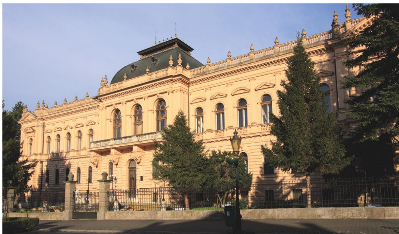
Владичански двор Епархије сремске, Сремски Карловци

?????????????. ?????? ?????????? ?. ?. ? ?????????????? ?? ?????? ?????????? ?? ?. ?????? ?? ?????????????? 1984. ? ?????? ?????????????????? ?? ??? 200 ? 2 ?????????? ?? ?????????????? ?????????? ?????????????? ? ??????. ?????? ? ?????????? ??????, ?????? ?????? ?????? ?????????????? ?????? ?????????????? ?????????????? ?????????? ? ?????????? ?????????? ?? ??????. ? ?????? ?????? ?????????? ?????????????? ??????????????, ? ?????? ?????????? ??????, ?????? ?????? ?. ?. ?? ??? 900 ? 2 , ?????? ?? ?????????? ?? ?????? ?????????? ??? 2007, ?????????????? ?? 2012. ?????? ?? ?????????????? ?. ?. ?????? ?? ? ?????????? ?? ?????????????? ??????, ?????????????? ?????? ?????????????? ??????????. ?????????? ? ?????????-????????????????? ??????, ?????? ?.