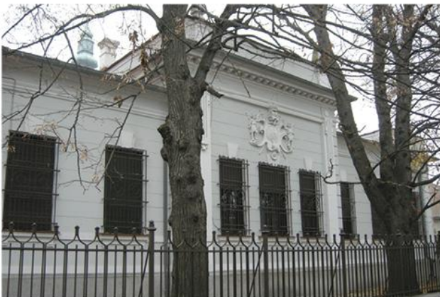
Владичански двор Епархије будимске, Сентандреја