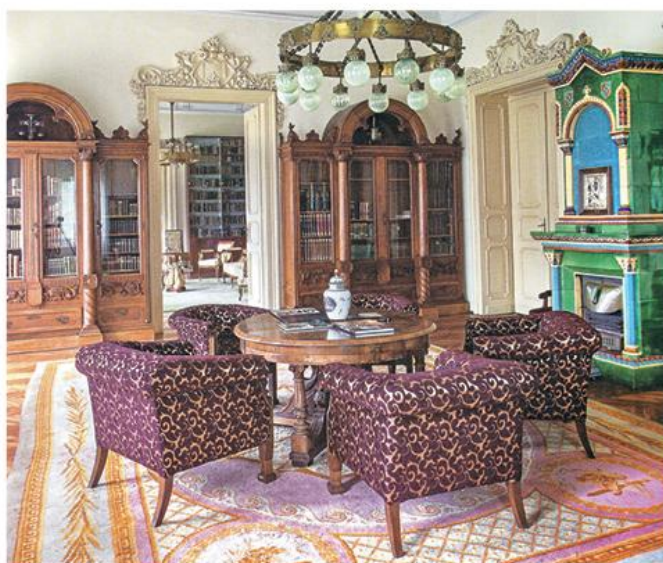
Библиотека Владичанског двора Епархије банатске

????????-????????????????? ?????????? ??????????? ?? ?????????? ?????? ??????????????? 1750, ?????? ??????????? ?????????? ?????????? ?????????? ?? ????????????????. ?????? ?????????? ??????? ?????? ?????????? ?? 1757, ? ??????????? ?? ?????????? 1763. ?? ?????????????????????? ??? ?????????????? ?????????????? ?????? ?? ?????????? ??????? ?? ?????????? ?????????????????? ??????? ? ?????????? ??????????????. ?????????? ?????????????? ??? ????????? ??????????? ?? ?????????????? ? ??????? ??????????????, ??????????? ?? ?????????? ??? ?????????? ?????????? ?? ?????? ??????????? ?????????????? ? ?????????? ?????????? ???. ??????????? ?????????? ? ??????????. ??????????? ?????????????? ??? ? ? ?????????????? ??????????? ?????????? ?????? ? ??????????? ??? ? ?????????????? ?????????????, ??? ?????. ?????????? ?? ?????????? ?????????? ?????????????? 1904. ??? ?? ?????????? ?????????? ??? ? ?????????????????? ????. ??????? ??????? ??????? ?? ?????????????? ? ?????????????????? ?????????????????? ??????????, ?????????? ? ????? ??????. ?????? ?????????????? ??????????? ?????????????? ?? ?? ???? ??????????? ?????????????? ?? ??????? ?????????? ???? ? ?????????? ??? ? ?????????????? ?????????? ??????? ?? ???????.