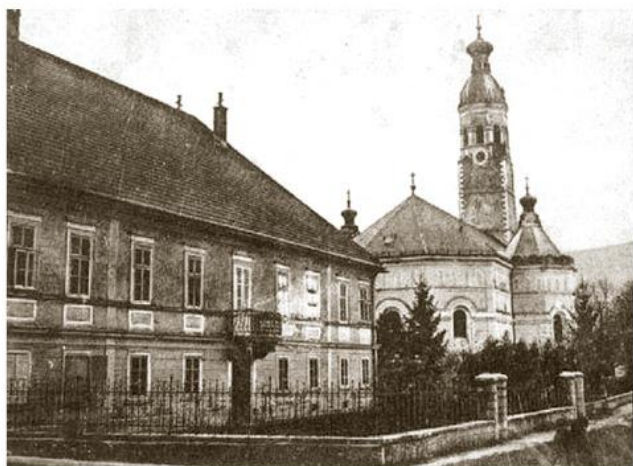
Владичански двор Епархије горњокарловачке, Плашко

????????? ?????????? ? ?????? ?? ????? 112 ?????????? ?????? ?????????? XV--XVII ?. ? ????? 1991/92. ? . ? . ?? ????????? ? ?????? ?????????? . ??? ?????????? ? ?????? ?????????? ?? ? ??????, ??? ?? ?? 2005. ??????? ? ??????? ??? ?????????? ?????????????-???????????? . ? ?????????????? ?? ?????????? ??????? ?? ??????? ? . ? .