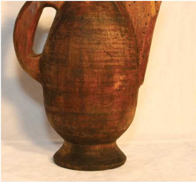
Посуда за вино (ЕМ СМ)

? ?????????? ?????????? ? ? ?????? ????????????? ??????