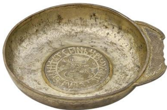
Чаша за вино, XIV в.

???? ?? ?????? ? ??????????? ?? ????????? ?.. ?? ??????? ??????? (?? 6,1-4; ??? 13; ?? 1,5). ?.. ?? ?????????? ??????????????? ?? ? ? ?????? (??? 10,9) ? ??????????? ?? ?? ?????? ?????? (?? 6,3). ????? ?? ????????? (?????????????) ??? ??????? ??? ?? ? ? ?????????? ??????????? ?? ????????? ?.., ???. ????????? (??? 35). ??????? ??????? ? ????????? ?.. ? ????????? ????????? ? ?????????? ??????? ?? ????? (?? 10,34; 1. ??? 5,23). ? ????????? ??????? ?.. ?? ??????? ??????? ??????. ??????????? ?? ?????? ?????? ??? ? ? ? ??????? ?? ???.. ?? ?????? ????????? ????? ?.., ???.