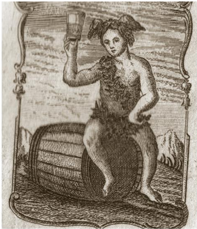
Пијанство, Иџика јеройолиџика, 1712 (Универзитетска библиотека Бг)

? ?????????? ?????????? ? ????????? ? ??????