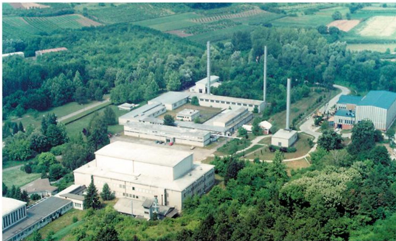
Зграде реактора, хот лабораторије и акцелераторске инсталације Тесла, 1999.

?????? ??????????. ?????????? ?????????? ?????????? ? ?????????????? ?????????? ?????????? ?????????, ?????????? ?????????? ?????????? ?????????, ???? ? ? ?????????? ? ?????????? ?????????? ??????????, ????? ? ? ?????????? ??????????: ?????????????? ???? ,? ? 10 ?????????????? ?????????????; ?????????, ? ? ????? ? ?????????? ?????????????? (? . ???, ? . ?????????); ?????????? ??????????; ?????????? ? ?????????????? ?????????? ??????; ?????????? ??????????; ?????????????? ??????????; ?????? ? ??????????????; ???- ??????; ?????? ? ?????? ???; ??????????????; ?o????????? ??????; ????? ? ?????????????????? ?????????; ?????????? ??????????; ?????????; ?????????????, ?????????? ? ?????????? ??????; ?????????, ? ? ?????????????? ?????? ????? ? ?????? ?????????????? ?????????????, ????? ? ?????????? ?????? ? ??? ? ?????? ? ? ?????????? ?????? (140 ??????), ?????????? ?????????? (73) ? ??????????????-????????? ?????? (64).