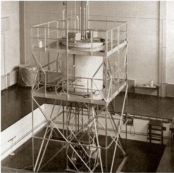
Експериментални домаћи реактор РБ