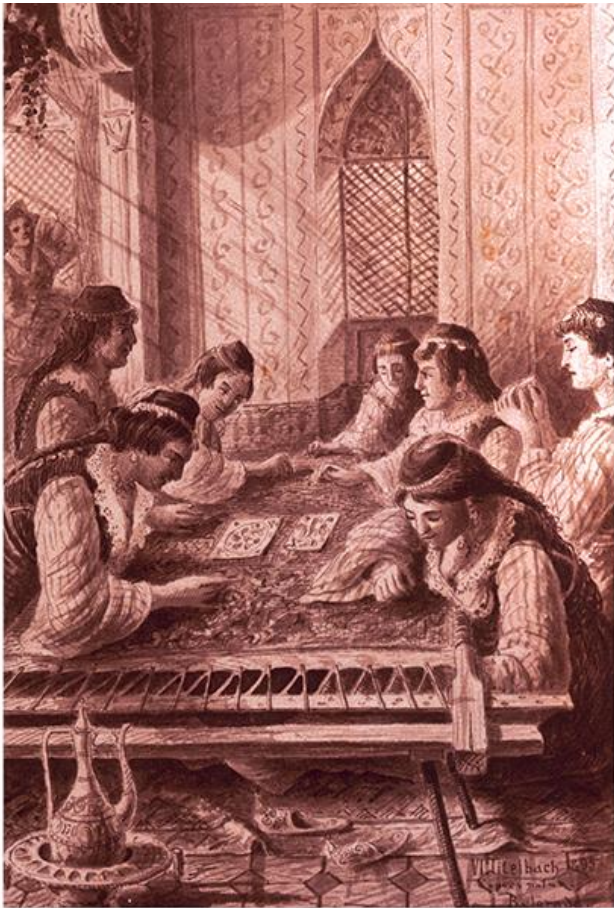
Везилџе, Ниш, 1878.

???, ??????? ??????????? ????????. ?? ?????????