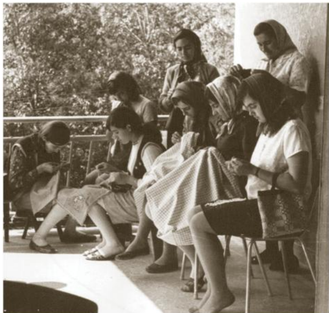
Домаћа радиност, Гамзиград, Зајечар