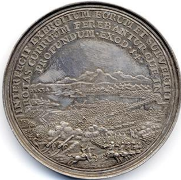
Георг Хауш, Битка код Сенте, 1697 (НМБГ)

? ????? ??? ?? ??????? ?????? ??????? ? ????,