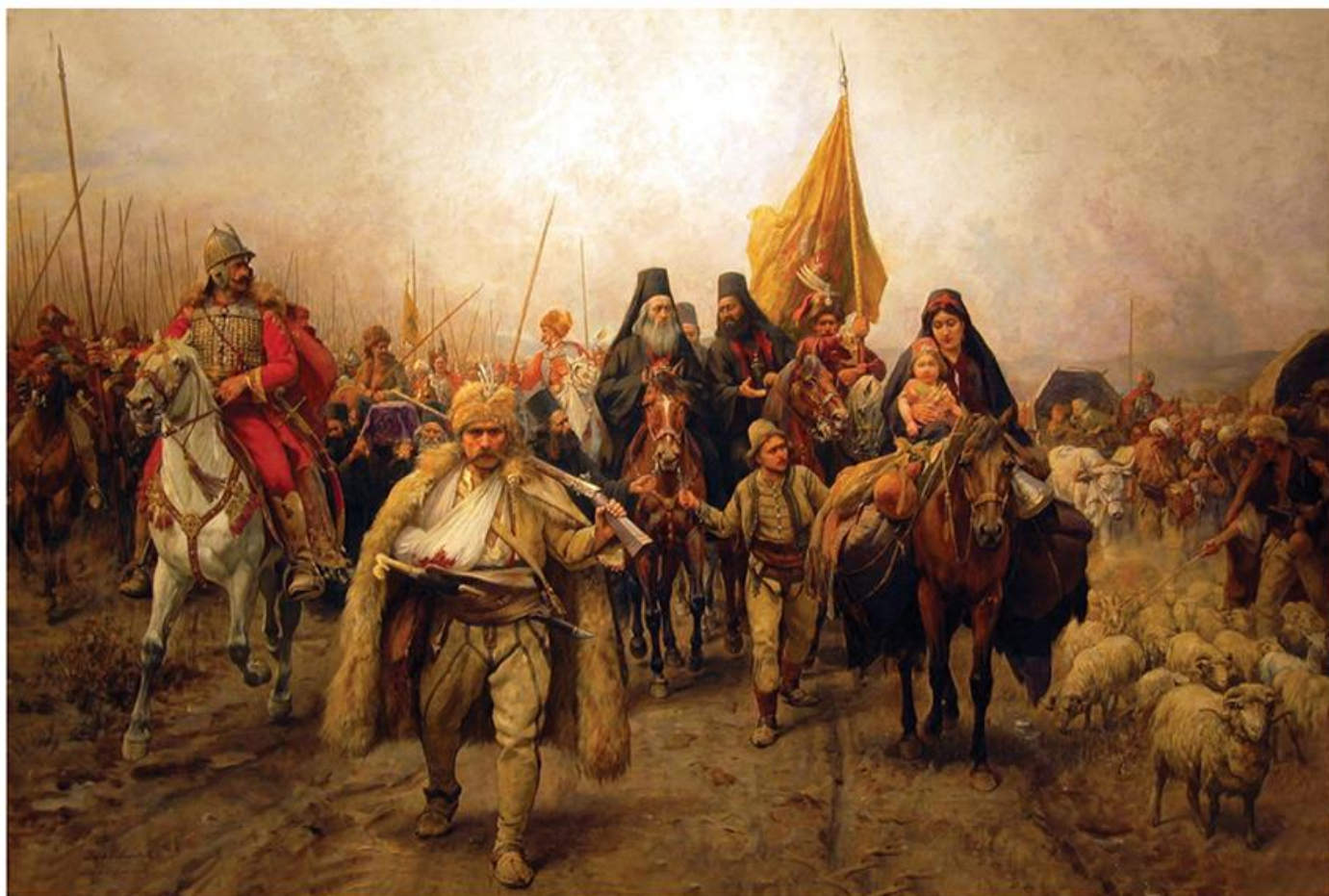
Паја Јовановић, Сеоба Срба, прва варијанта композиције из 1895–1896 (НМ Панчево)