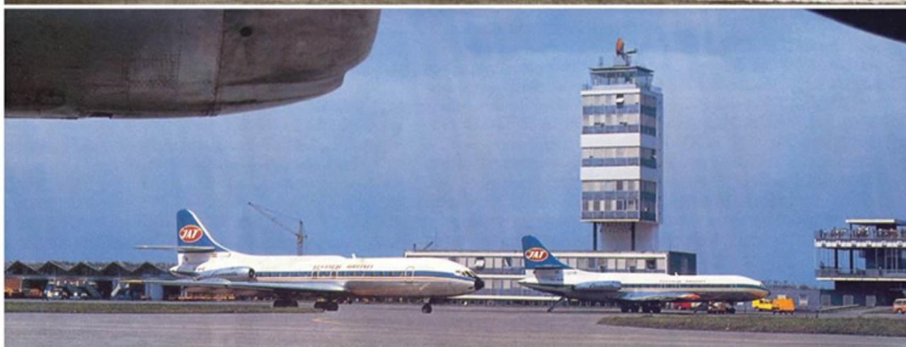
Аеродром „Београд“: (горе) 1937. у Земуну и крајем 60-их у Сурчину (МВ)

??? ????? ????????? ??????? II ?????????? ??? ? ????????????? ??????? ????????????????????? ????????????????? ??????? ? ?????????? ?????????????? ??????? ??, ?????????????? ?? ?????????? ?????????? ? ?????????????, ?????????? ??????? ?????????? ?????????? ? ??????. ?? ?? ?????????????? ? ?????? ?????, ? ?????????? 1946. ?????????????? ??? ?? ?????? ?????????? ?? ?????????? ?????????? ??. ??. ?? ??????? 19 ??????? ??? ?? ?????????? ??????????? ?? ??-2 ? ?-47 ????? ?? ??????? ?? ??? ????????????? ???????, ?? ?????? ?????? ? ???????.