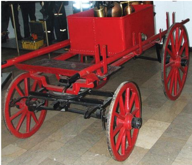
Ватрогасна кола, око 1900 (МНТ)