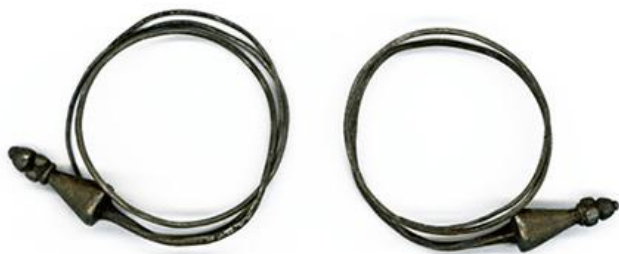
Наушнице, Лухор, крај V в. п.н.е.

?? ? ??? ???? ???????? ?? ?????? ?? ???????.