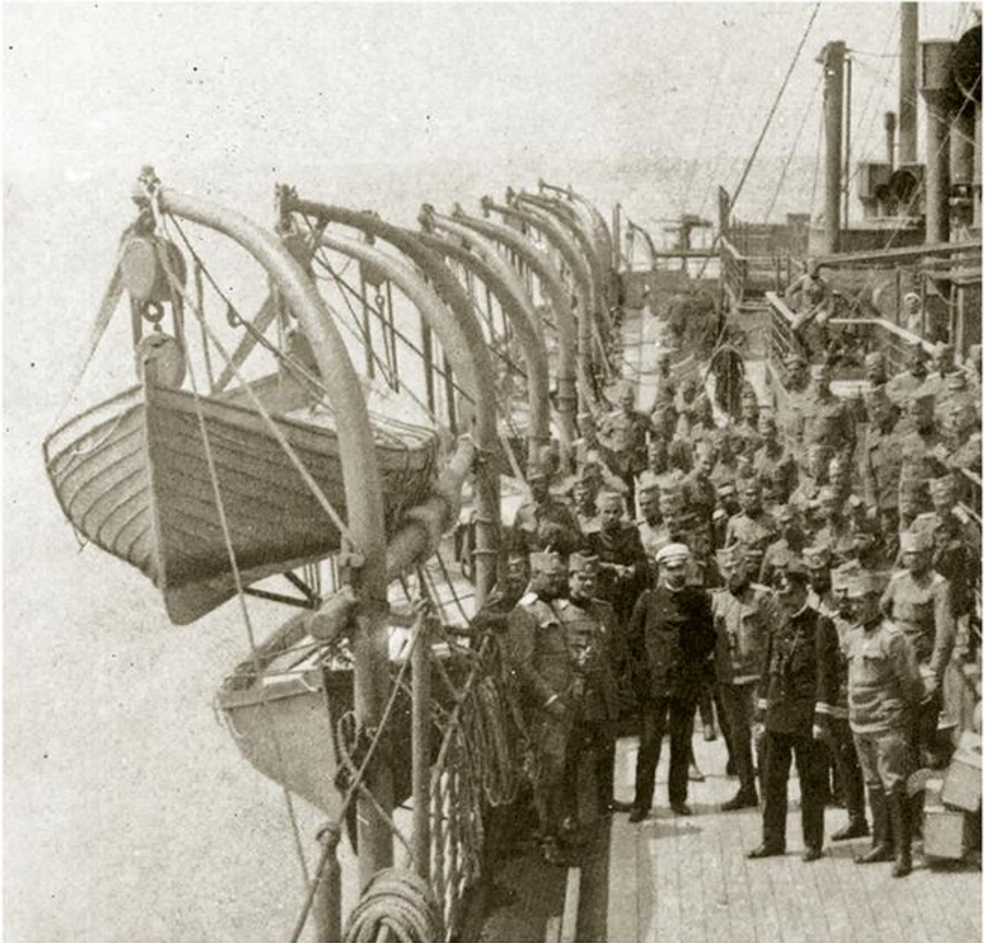
Укрцавање Дунавске дивизије за Солун, 1916 (ВМБГ)

??? ?? ?? ??????? 1916. ?? ????????? 1918. ??? ?????? ?????????????? ??????? ? ??????????????. ?? ????? ??????? ?????? ?? ??????? ??????, ????????? ????????? ??????????? ? ?????? ?????? ?????????? ??????????????. ??? 115.000 ???????? ???????, ?????? ??????????? ?? ?????, ?? ????? ?? ????? ?????????? ????????????? ?????? ? ????????????? ??????, ?????????????? ???????, ??????? ?????????????? ?????? ??????, ? ??????? 1916. ??????????? ?? ?? ?????????? ?????. ?????? ??????????, ?????????? ??????, ??????? ??????? ?? ??????? ?????? ?????????????????? ???????????????, ?????? ?????????, ????????? ??????, ??? ??????????????. ??????? ????????? ?????? ??? ?? ????????? ?? ?? ?? ??????? ?????? ????????? ?????????? ??????????? ???????.