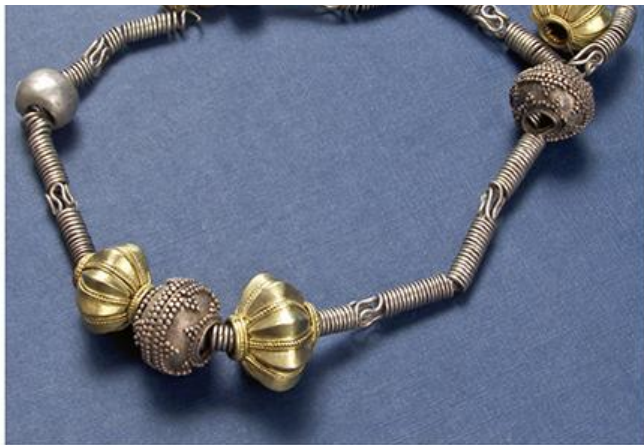
Огрлица, Крушевица код Рашке, V в. п.н.е.

????????? ????????, ?????????? ??? ? ??????????????,