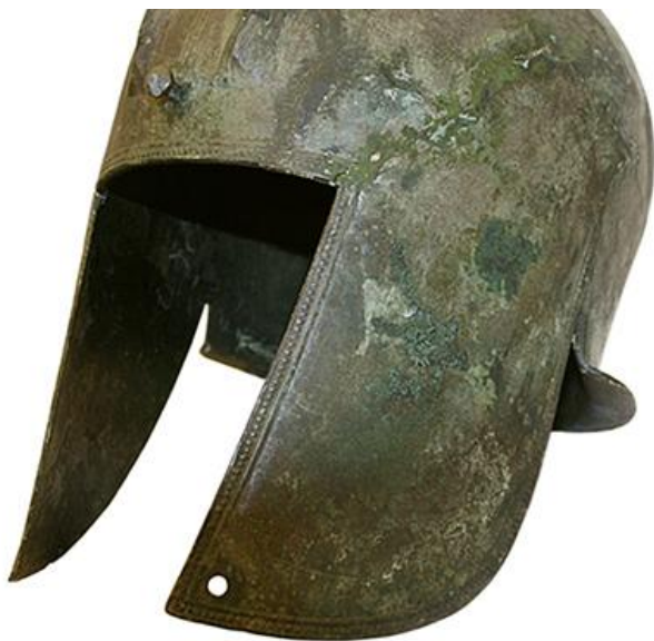
Илирски шлем, Ражана код Косјерића, почетак V в. п.н.е.