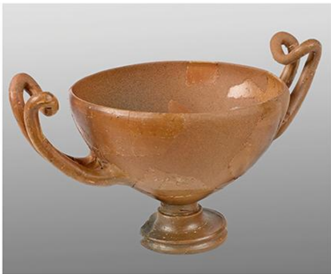
Кантарос, Кршевица код Врања, IV в. п.н.е.

????????? ?? ?? ?????? ??????? ?????????? ???????, ??? ?????? ??? ???? ?????? ??????, ??? ? ? ??????? ?????????? ??? ? ? ??????? ?????????: ??????? ?? ?????????? ?? ?????? ??? ? ?????????? ??? ??????? ??????? ? ?????? ??????? ? ?????????? ?? ?????????? ??????. ??? ? ?????????? ?????????? ?? ?????? -- ?????????? ? ??????? ? ? ? ? ? ? ?????????????? ??????? ??????????????, ??? ?? ????? ??. ? ?????? ?????????? ?????????, ??? ? ?????????? ?????, '????????????? ? ??????? ???????, ??? ? ?????????????