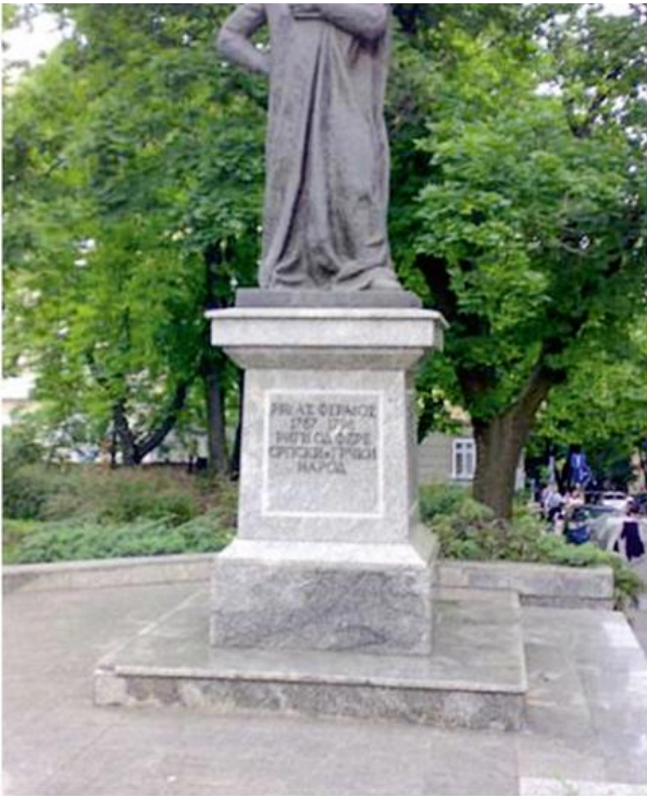
Споменик Риги од Фере у Београду

????? XVIII ?.. ?????? ?????? ? ??????? ????????????? ?