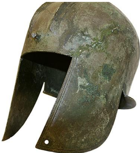
Илирски шлем, Ражана код Косјерића, почетак V в. п.н.е.