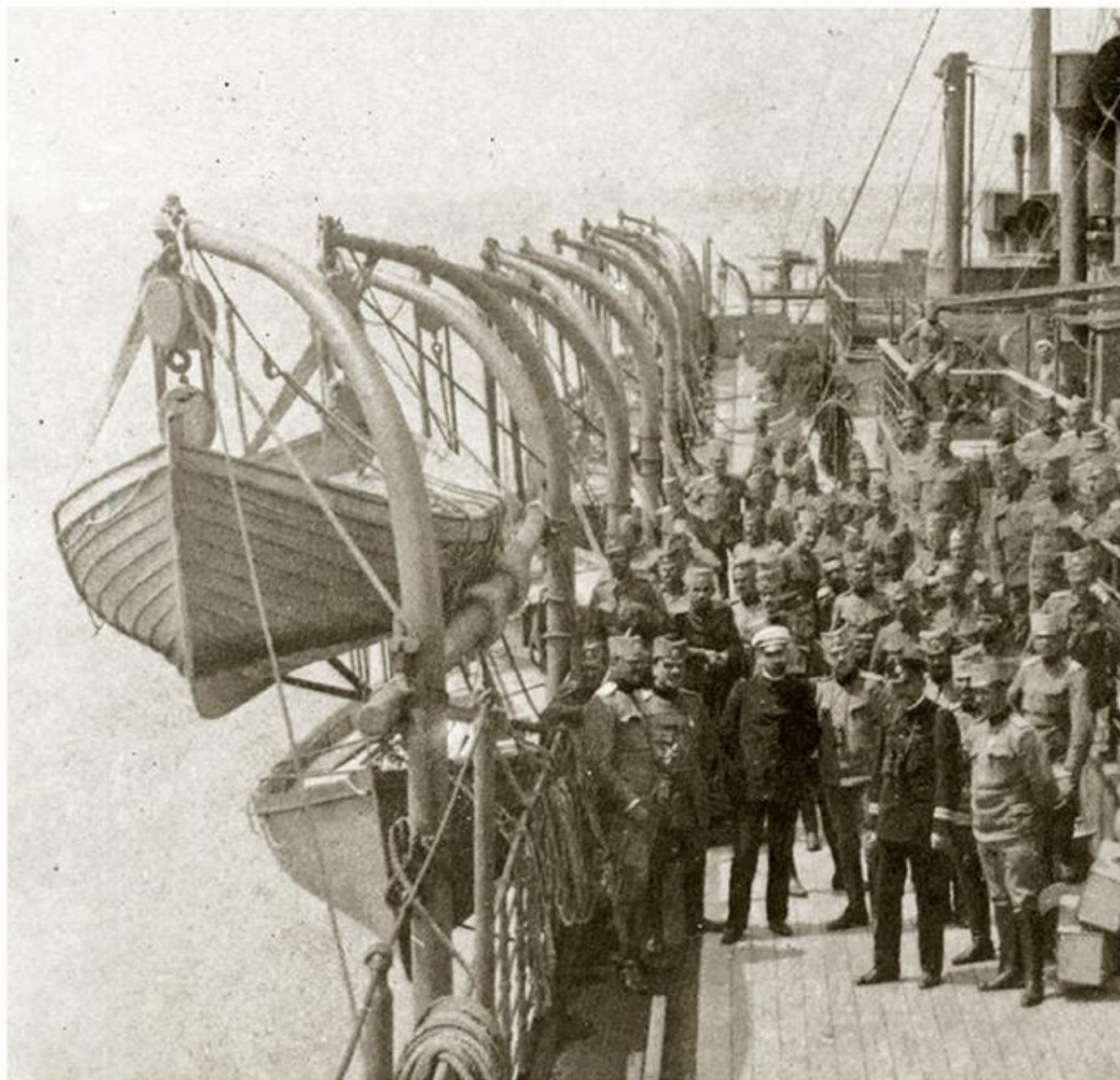
Укрцавање Дунавске дивизије за Солун, 1916

??? ?? ?? ??????? 1916. ?? ??????? 1918. ??? ?????? ??????????? ??????? ? ????????????. ?? ?????? ??????? ??????? ?? ??????? ??????, ??????? ??????? ??????????? ? ?????? ??? ?????????? ????????????. ??? 115.000 ??????? ???????, ?????? ?????????? ?? ?????, ?? ????? ?? ?????? ?????????? ?????????? ?????? ? ??????????? ???????, ?????????????? ???????, ??????? ?????????????? ?????? ??????, ? ??????? 1916. ?????????? ?? ?? ?????????? ??????. ?????? ??????????, ?????????? ??????, ??????? ??????? ?? ??????? ??? ?????????????????? ??????????????, ?????? ?????????, ?????????? ??????, ??? ??????????????. ??????? ?????????? ?????? ??? ?? ?????????? ?? ?? ?? ??????? ??????? ??????? ?????????? ??????????? ???????.