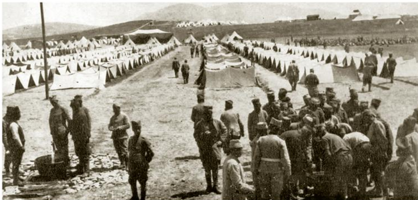
Логор српске војске у околини Солуна, 1917

???????????? ?????????? ?????? ? ????????? ?????????? ?????? ? ?????? (???????? ??????), ?????? ? ?????????, ????????????????? ?????????????? ?????? ????? ?? ?????????, ? ????????????? ?????????? ?????? ????????????? ?????????? ?? ?????? ?????????????? ? ?????? ????????????????? ?? ?????? ????????????????? ??????. ? ?????????????? 1916. ????????????? ?? ?????????? ?????????? ?? ??????, ????????? ? ??????, ????????????? ?????? ?????????? ?????????, ????????????????? ?????????? ?????????? ?? ?? 23. XI 1916. ?????????? ??? ?????????????? ?????????? ??? ?????????????? ?????? ?????????? ?????? ?????????? ?????? ?????????????? ?? ?????????????? ? ?????? 1917. ?????????????, ?????????????????????? ?????????????? ??????, ?????????? ?? ?????????? ?????????? ?????? ?????????? ?????? ? ?????????? ?????? ???????????????????. ?????? ?????????? ?????? ????????? (250.000 ?????????) ?????????? ?? ? ?????????? ??????, ?????????? ?????????????? ?????????????????? ?? ?????????? ? ?????????? ?????????????? ?????????, ? ??? ?????????? ?????????????? ??????????, ????????? ? ?????? ?????? ?????????????? ?? ?????????? ?????? ?????????? ?????? ?? ?????????? ?????? ?? ?????????????? ?????????? ?????????? ?????????? 1918.