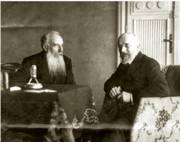
Никола Пашић и Елефтериос Венизелос, 1913.

?????? ?????????????? ?????????????? ?????? ??????????? ?????????? ? ???????????, ??????-????? ?????????? ??? ?????????????????, ?????????? ?? ??, ?? ?????????? ?????????????? ? ?????????, ??? ?? ?????????? ?????????????? ??????. ?????? ?????? ? ?????????? ?? 1912. ??? ??????????? ?????????? ?????????? ? ?????? ?? ?????? ?????????????? ??????, ?? ?? ?????? ?????????? ? ?????, ?????? ?????????????????? ??????? ??????????? ?????? ??????????. ?????? ??????????. ??????? ?????? ?????? ??????????? ? ?????? ?????????????? ?????? ?????? ??, ?????? ?! ?????? ?????????? ?? ?????????, 20. XI 1912. ?????????????? ? ?? ? ?????? ??? ? ??????????? ?????????? ??????????.