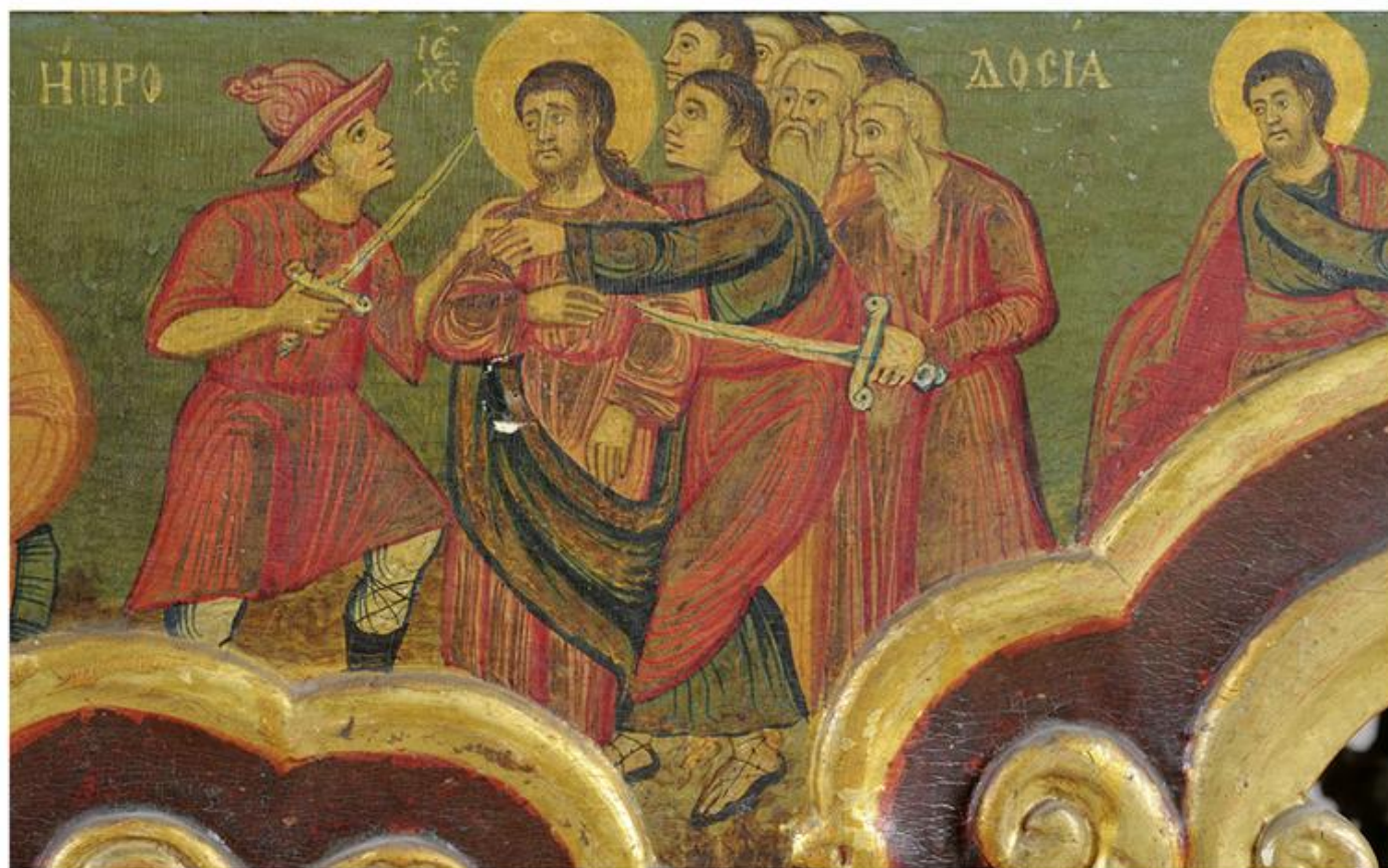
Теодор Симеонов Грунтовић, Хвајање Христѡа , око 1770, Српска црквеноуметничка збирка, Сентандреја

?????-?????? ?????????????? ?????? ?? ?????????? ?? ?????? XVI ? XVII ?, ? ?????? ?????????????? ?????? ?????????????????? (1557--1690). ? ?????????????????? ?? ?????????????? ?????????????????? ?????? ?? ?????? ?????????????? ??? ?????????? ?????? ?????????? ?????????????, ?????????????????? ?????????? ?? ?????? ?????????????? ?????????? ? ?????????????? ?????????? ? ?????????? ??????????????, ?????? ?? ?????????????? (1545), ?????? ?????? (1604--1606), ?????????? (1607--1608), ?????????? (1622) ? ?????????? (1646), ?? ?????? ?????????? (1608, 1654). ?? ?????????? ?????????? ?????????? ?????? ?? ?????????? ?????????? ?? ?????????? ?????????????????? ? ?????????? ?????????? ?????????? ?????????? ? ?????????, ?????????????? ? ??????????????. ?????????? ?????? ?? XV ? XVI ?. ?????????? ?? ?? ?????????????? ?????????? ?????? ?????????????? ? ??????????, ?????????? ? ?????????????????? ?????????? (1538) ?????????? ?????????? ? ?????????? (1566) ?????????? ?? ?????????? ??????. ?????????????? ?????????????? ?????? ?????????????? ?? ?????????????????? ?????????? ?????????? ?????????????????? ??????, ?????????? ?????????????????? ?????????? ? ?????????? ?????????????? ?????????? ?????????? ?????????? ?????????? ?????????? ?????? ? ?????????????? ?????????.