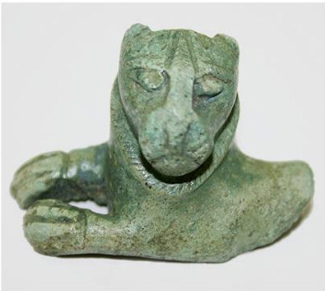
Део дршке хидрије, Пилатовићи код Пожеге, VI в. п.н.е.

?????????????????? ?????? ?? ?????? ?????????? ? ?????????? ??