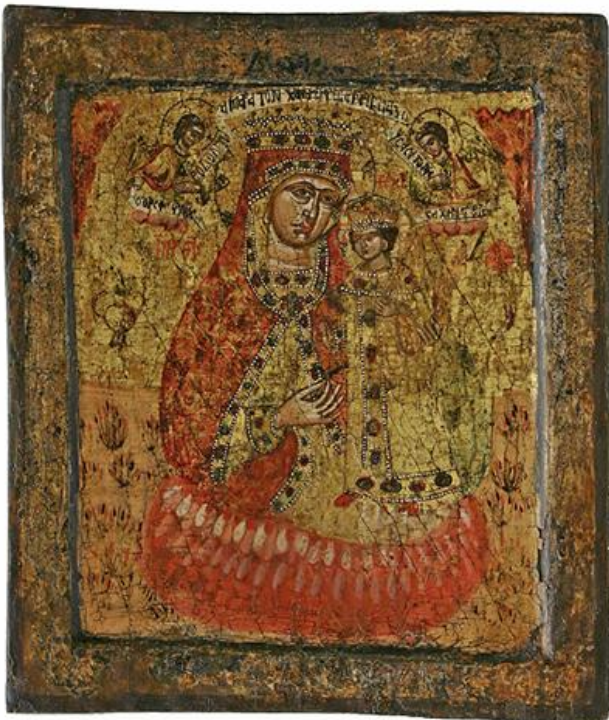
Непознати грчки мајстор, Бојородица Ружа која не вене, икона, XVIII в. (НМБГ)

????? ?????????????????? ?????????? ??, ??????, ???????