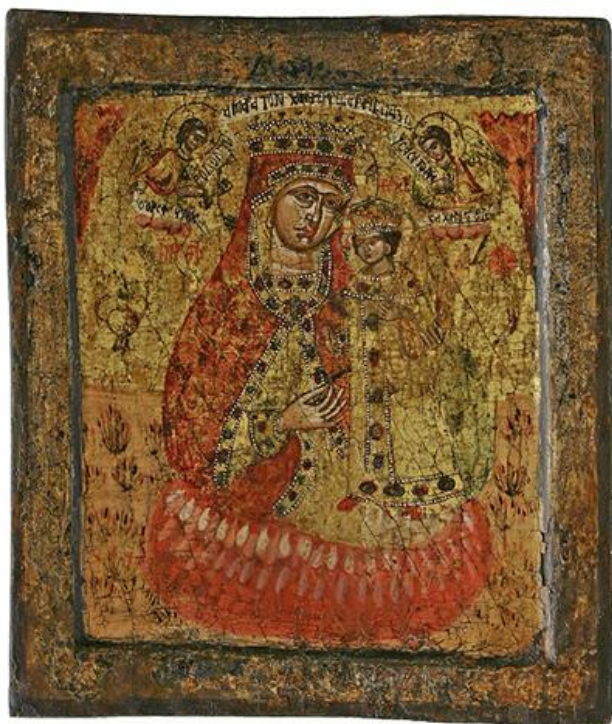
Непознати грчки мајстор, Бојородица Ружа која не вене, икона, XVIII в. (НМБГ)

????? ?????????????????? ?????????? ??. ??????, ???????