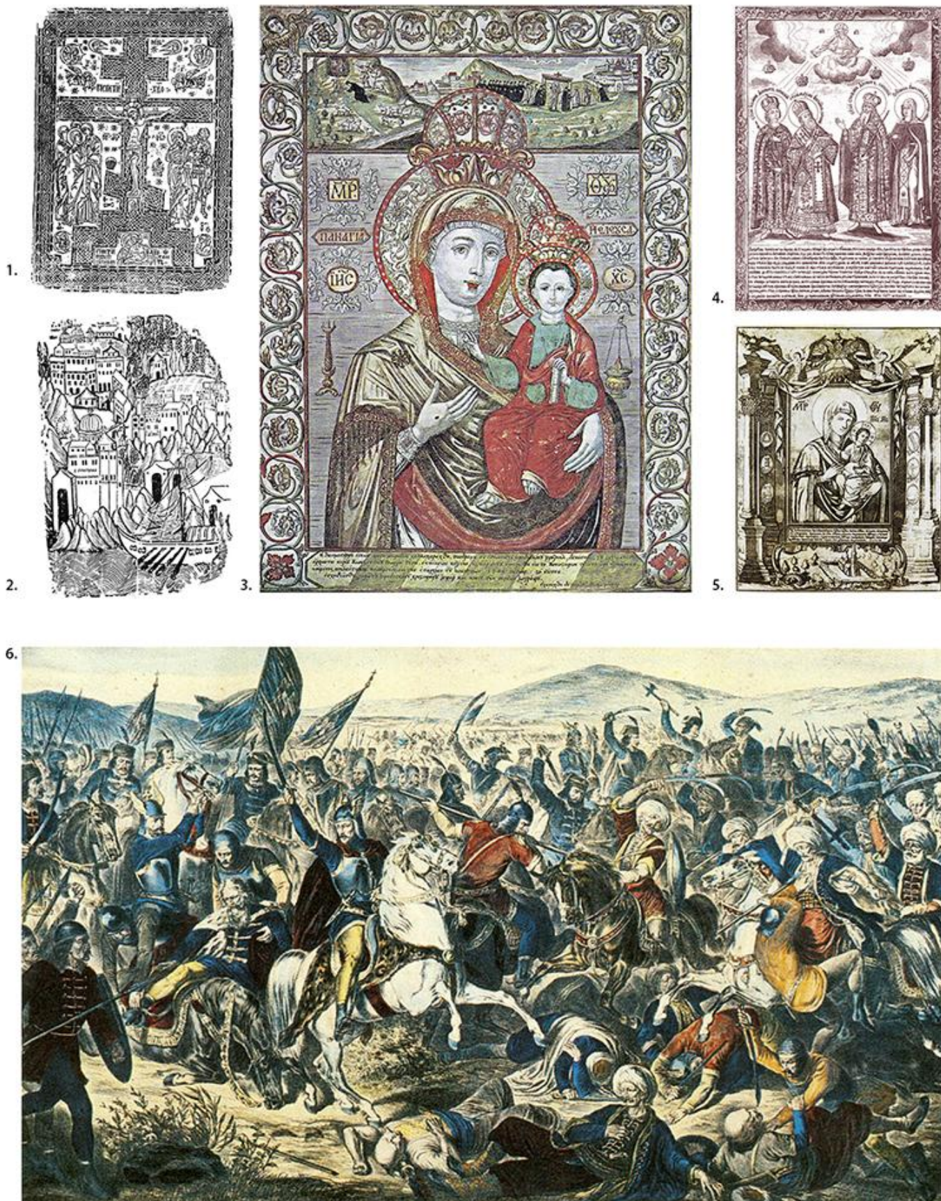
1. Распятие Христово, дрворез, почетак XVI в. • 2. Свешта Гора, дрворез, крај XVII в. • 3. Х. Жефаровић – Т. Месмер, Бојородица Елеуса, копорисани бакрорез, 1749 • 4. Х. Жефаровић, Сремски свештишељи Бранковићи, 1746 • 5. 3. Орфелин, Бојородица Бођанска, бакрорез, 1758 • 6. А. Стефановић, Цару Лазару коња убише, литографија у боји, 1875.

????? ??????????? ??????? ?????????????? ? ??????? ???????????, ??????????? ?? ?????????????? ???????, ????????? ?? ?????????????? ??????????? III ?????????????? ? ????????? ??????????? ??????????? ????????? 1692. ? 1722, ????? ???????????