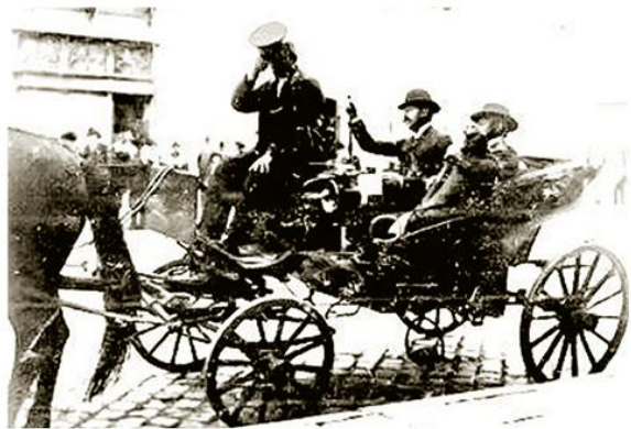
Фијакер у Београду, 1909.

??????? ?????????????? ??????? ??????? ?? ?? ??????? ?????? ?????????????? ?????????? ?????? ?? ?????????? ?????? „??????“ ? ????????? 1881, ? ??????? 1888. ?????????? XX ?. ?????????????? ?????????? ??????? ?? ?????????????? ? ??????? ?????????? ??????????. ?????????? ?????????? ??????? ? ?????????????? ??????????????? ??????? XIX ?. ??????? ?? ?? ?????????? ?????? ???????, ??????????, ??? ? ? ?????????????? ?????????????? ?? ?????????????? ?????????? ?? ????????? ??????. ??? ? ??????? ?? ??????? ? ?????????????? ?????????????? ?? ?????????????? 1885. ? ??????????, ??? ?? ?????????????????????? ?????? ?? ?????? ?? ??????? ?????? ?? ??????????. ??? ? ??????? ?? ??????? 1898. ? ???????????, ? 1903. ? ??????????. ??????? ?? ??? ?????? ?????????? ??? ? ?? ?????????????? ?????????? ? ??????? ????????? 1905. ??? ? ?????????? ?? ??????????? 1882. ? ????????? ? ?????????? ?? ??????????. ??? ? ?????????????? ??????? ?? ????????? ? ?????????? ? ??????? 1900, ? ?????????? 1901, ? ? ?????????? ?????????????? 1911. ???, ??? ? ??????? ? ? ?