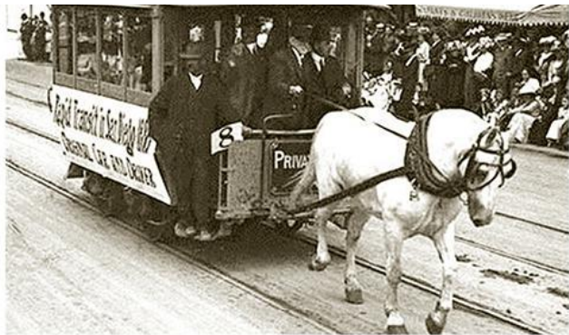
Трамвај с коњском вучом, крај XIX в.