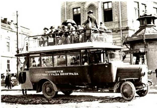
Аутобус у Београду, 1927.

?? ????? ????????? ????? ? ??????. ????????? ?? ????????? ?? 10 ?????, ? ????????? ?? ??? ????? ????????????? ?? ?? ?? ????? ????????? ????????? 1920. ????? ?? ????????? ????????? 40 ????? ?? ?? ?? ?? ????? ????? ????? ????????????? ?? ????????? ??????. ????????? ????? ????? ? ??? ????????? ????????? (1890--1910) ????????? ?? ?? ?? ? ?? ????? ????????????? ????????? ?? ????? ????????? ????????? ????????? ??????????????. ????????? ????????? ????? ????????? ? ????? ????????? 50-?? ??????. ????????? ????????????? ????????? ????????? ?? 1958. ????? ????????? ????????? ????????????? ?? ????? ????????? ????? ?? ????????? ?? ??? ?????????, ? ??? ????????? ?? ????? ????? ??????????????. ????????????????? ? ????????? ????????????? ? ????????????? ??. ?. ??????? ?? ????????? ?? ?? ????? ????? ????????????? ?????????, ????? ??????? ????????????? ????????? ????????? ????????? ????????????? ????? ? ????????? ?? ?? ????????????????????? ????? ????????? ??????. ? ??????? ?? , ????? ??????? ??? ????????? ????????????? ????? ????????? ? ????????? ???.