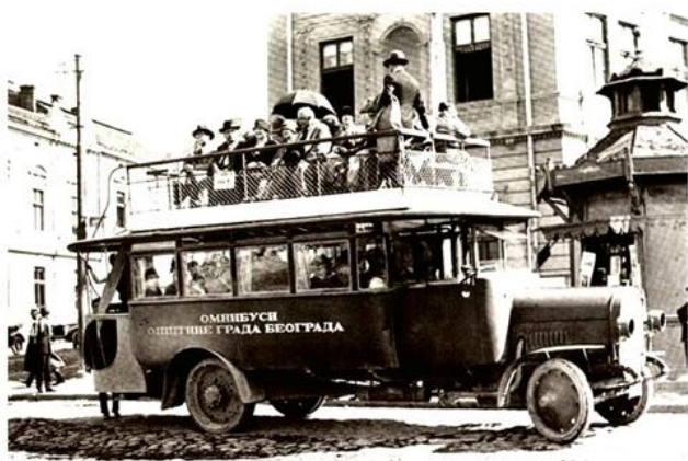
Аутобус у Београду, 1927.

?? ????? ????????? ????? ? ??????. ????????? ?? ????????? ?? 10 ?????, ? ????????? ?? ??? ????? ????????????? ?? ?? ?? ????? ????????? ????????? 1920. ????? ?? ????????? ????????? 40 ????? ?? ?? ?? ?? ????? ????? ????? ????????????? ?? ????????? ??????. ????????? ????? ????? ? ??? ????????? ????????? (1890--1910) ????????? ?? ?? ?? ? ?? ????? ????????????? ????????? ?? ????? ????????? ????????? ????????? ??????????????. ????????? ????????? ????? ????????? ? ????? ????????? 50-?? ??????. ????????? ????????????? ????????? ????????? ?? 1958. ????? ????????? ????????? ????????????? ?? ????? ????????? ????? ?? ????????? ?? ??? ??????, ? ??? ????????? ?? ????? ????? ??????????????. ????????????????? ? ????????? ????????????? ? ????????????? ??. ?. ????? ?? ????????? ?? ?? ????? ????? ????????????? ?????????, ????? ????????? ????????????? ????????? ????????? ????????? ????????????? ????? ? ????????? ?? ?? ????????????????????? ????? ????????? ??????. ? ????? ?? , ????? ????? ?? ????????? ????????????? ????? ????????? ? ????????? ??.