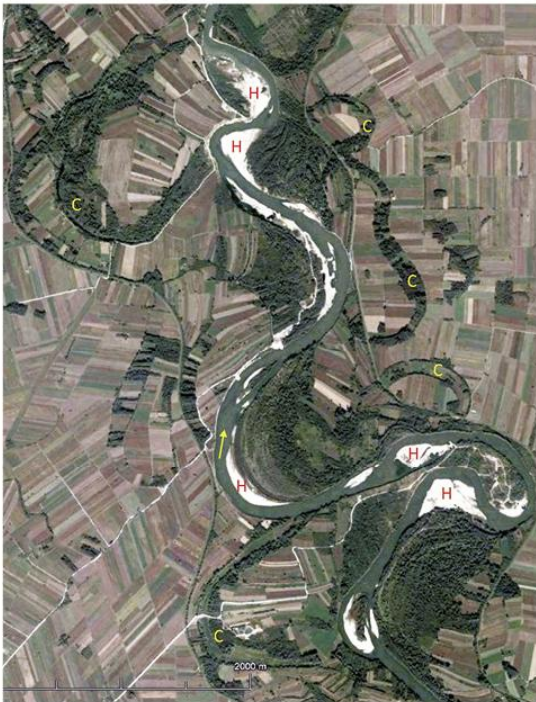
2. Деформација речног корита: рушење обале реке Ресаве (горе) и промена трасе Велике Мораве са (С) напуштеним деловима корита и (Н) депонијама наноса (доле).

???????? ??????? ?????????????????? ??????? ??????? ?? ???????