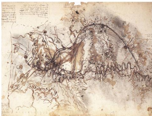
1. Уређење реке Арно са ободним каналом за заштиту од поплава и пловидбу, цртеж Леонарда да Винчија, 1503.

?????????? ?????? ??????????, ?????????????? ??????????, ?????? ? ?? „????????? ???“, ??? ?????? ?????????? ???, ?????????????? ? ?????????? ?????????? ? ?????? ??? ? ??? ?????????????????? ?????????? ???, ??????? ?? ?????? ? ?????? ?????? ??????????. ?? ? ? ?????????????? ??????? ??????????? ?? ??????? ??? ?????????????????? ?????? -- ??????????????????, ?????????, ?????????????????, ?????????????? ? ??????????????. ?????? ??????????? ??? ??: (1) ?????????????? ?????? ?????? ? ?????????? ?????? ??????? ??? ?? ???, ??? ? ?????; (2) ?????? ????????? ?? ??????; (3) ?????????; (4) ?????? ?????? ?????? ? ?????? ?????????????????? ????????? ? ?? ?????? ????????? ?? '?? ????? ? ?????? ?????????; (6) ?????????????, ????????????? ? '????? ? ?????? ?????? ??????????.