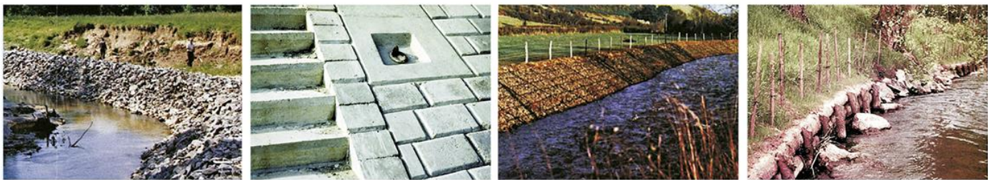
4. Обалоутврде са различитим типовима облога: 1. камени набачај (рурална подручја); 2. бетонски блокови (урбана подручја); 3. габион (рурална и урбана подручја); 4. биљни материјал (мали водотокови).

???????????????? ?? ?????????????? ?????????? ?? ?????? ?????? ?????? ?? ??????????. ?????? ?? ?? ?????? ?????????????? ?????????, ?????????????? ??? ?????????????, ?????????????? ?????? ? ?????????????, ??? ? ?? ?????????????????????? ??????????????. ?????????? ?????????????????? ?????? ?????? ?? ?????????? (??, 3), ?????????, ?????????? ??? ?????????? ????????????????? (??, 4).