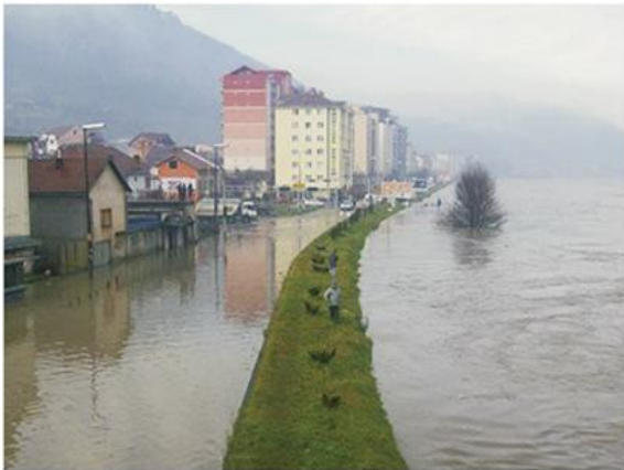
7. Штете од поплава: поплавлјено насеље Витковац у долини Јужне Мораве, 2010. (горе) и изливање Дрине у Зворнику, 2005. (доле).

???????????? ???? ? ???? ????????? ? ? ??????? ????????? ??