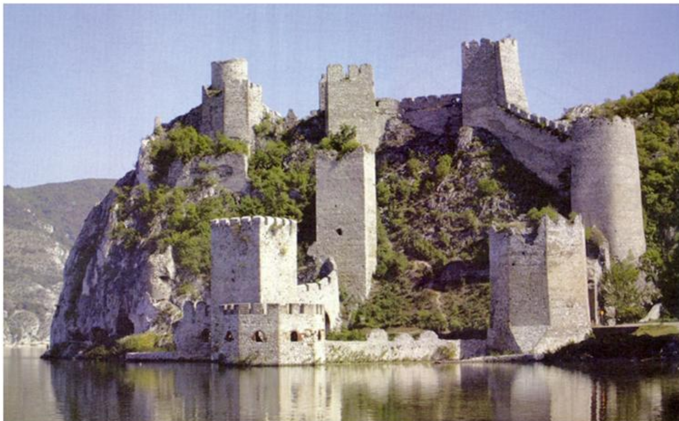
Утврђење Голубачки град

Голубачки град је један од највећих и најлепших средњовековних тврђава у Србији. Оно је изграђено на врху планине Голубачког града, која се налази на обали Дунава. Тврђава је изграђена од камена и дрвета, а њена архитектура је карактеристична за средњовековну Србију. Тврђава је била део велике одбрамбене линије, која је заштитила Србију од османских освајања. Данас је Голубачки град један од најпознатијих туристичких центара у Србији. Он привлачи многе посетиоце из иностранства, који желе да се упознају са историјом овог региона. Голубачки град је један од највећих и најлепших средњовековних тврђава у Србији. Оно је изграђено на врху планине Голубачког града, која се налази на обали Дунава. Тврђава је изграђена од камена и дрвета, а њена архитектура је карактеристична за средњовековну Србију. Тврђава је била део велике одбрамбене линије, која је заштитила Србију од османских освајања. Данас је Голубачки град један од најпознатијих туристичких центара у Србији. Он привлачи многе посетиоце из иностранства, који желе да се упознају са историјом овог региона.