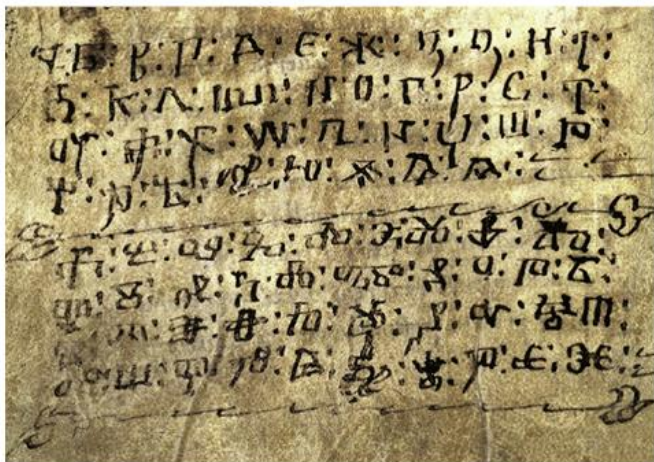
Минхенски абецедар, прва половина XII в.

???? ?? ????? ????????? ?????????? ??????????, ?