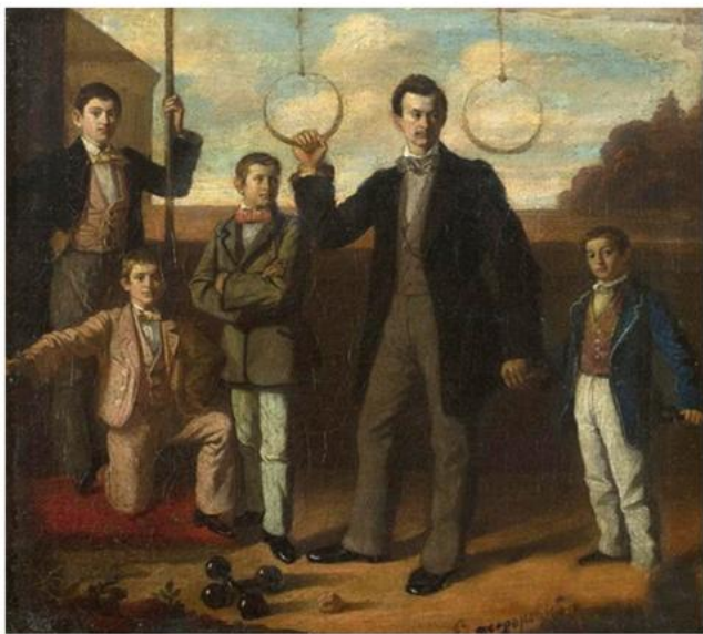
?? ????????????? ? ? ?????? ?????? ?? ??????

?????? ??????????. ?????????? ?? ????????? ? ? . ? ?????????? ?????? (???? ? ? ????????? 1857), ?? ? ? ?????? ? ? ????????? ?????? ????????? ????????? ? ? ? . ? ?????? ??????? 1881. ? ????????? 1882. ? ??? ? ? ????????? ? ? ????????? ????????? ??? ? ? 1891. ??? ? ? ??? ????????? ?????????? ?????????? ??????? ?????????????? ?????? ? ????????? ??????????? ??? ? ??????????? ?????????????? ?????????? ??????? „????“. ???????????????????, ??? ? ? ??????????? ????????? ???????, ?????????? ? ? ? 1892. ? ????????? ??????????