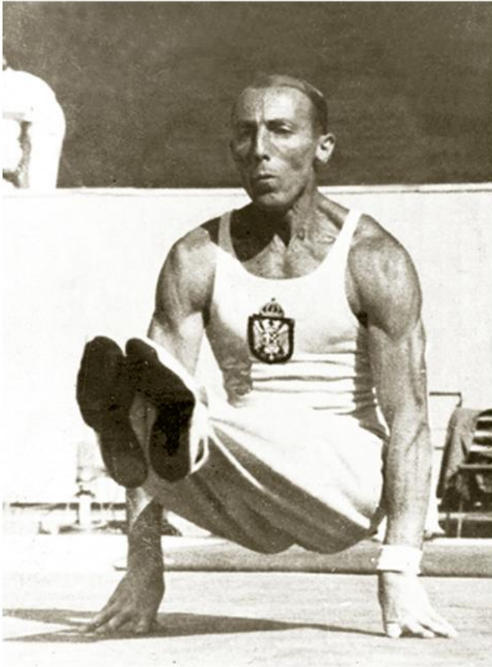
Леон Штукељ на Олимпијским играма у Паризу, 1924

?????????? ?? ??????????? ?????????? ?????????, ??????????? ?., ??????? ?? 1898. ??????? ?????????????? ?????????? 1908. ?????????? ?? ????????? ?????????????? ?????? ? ?????????? ? ?????? ?? ?????????? ?????????? ??. ?? ??????? ??????, ? ?? ??????? ?????????????????? ?????????? 1911. ?????? ?????????? ?????? ??????? ?? ?????? ?????????? ?? ????????? ?????????? ??. ? ??????????, ?????????????, ?????????????, ??????, ?????, ??????????, ??????, ??????? ? ??????. ??? ?? ????? ?????????? ?? ????????? ?????????? ?????????? ? ??????, ? ?????????, ?????? ??????? ? ?????????? ?????? ?? ????????? ?????????? ?????????? ?????? ?????? | ?????????? ?????? ? ?????????? ?????????????? ???, ?? ?????? ?????????? ??????? ? ?????? ????? 28. VI 1919. ?????????? ?? ??????????? ?????????? ?????? ?????????? ???, ????? ?? 1920. ?????????? ??? ? ?????????????????? ?????????? ?????? (?? 1929. ?????? ?????????? ??????????????). ?????? ??? ????? ?????????? ??????? ??, ?? ??? ?????????? ?????????????? ?????????????????? ? ?????????? ? ??????, ??? ?????????? ?????????? ?????????? ?????????? ? ??. ??? ??????, ?? ?????????????????? ?????????? ?????????????????? ?????????? ?????????? ?????????? ?????????? ?????????? 1924, 1928. ? 1936. ??????? ? ??? ??????????), ? ?????? ?????? ??? ?? ? ?????? ? ??????, ??????? ?????????? ? ??? ?????????? ??????????