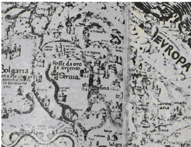
Деталј карте Европе са приказом Србије и текстуал- ном назнаком њених геолошких потенцијала

?????? ?. ?. ? ?????. ?????? ?????? ?. ?. ? ?????? ??? ?????? ??? ?? ?????????: ?????????? ?????? ? ?????????????? ?????????? ?????; ?????????? ?????????????? ? ?????????????? ??????; ?????????? ? ?????????????? ??????????????? ??????????? ?????????? ?????????? ? ?????????????? ?????? ?. ?. ?????? ?? ?? ? ?????? ??????, ?