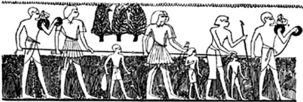
Геодетско успостављање међе конопцем са чворовима у старом Египту

????????A (??? gh': ?????, daivesqai: ?????; gewdaisiva), ????? ?????????? ??? ? ???? ????????? ? ?????????????? ??? ? ???? ?????????? ?????????????? ??? ? ?????????????????? ????????? ???? ? ??? ? ?????. ?????????? ?????????? ?????????? ?? ?????????? ? ?? ?????? ?????????? ????????? ?????????? ?????? ?????? „????? ?????“ ?????? ?? ?????? ?????????? ?????????? ?? ??????, ? ?? ??? ?? 5.000 ?????? ? ?????, ??????????????, ?????? ??? ? ?????????? ??? ??? ?????? ?????????? ?????? ?????????????? ?? ?????? ?????? ?????? ?? ?????? ?????? ? ?????????, ?????? ? ?????????????? ??? ?????, ??? ?????????? ?? ?????????? ?????????? ?????????? ? ?????? ?????? ?????? ?????? ????? ?????????? ?????? ?????????????? ?? ?????? ?????, ?????, ?????? ? ?????, ? ?? ????????? ?????????????? ?????? ?? ?????????? ? ?????????? ?????????? ?????????? ?????????? ?????????? ?????????????? ?????????????? ?????????????? ?????????????? ??????, ?????????, ?????? ? ?????????? ?????????? ? ?' ??????.