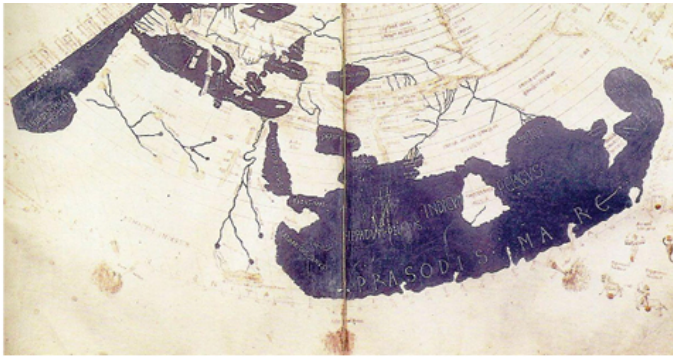
Птоlemeјева карта света

????? ???? ??????? ???????, ?? ?????? ????????