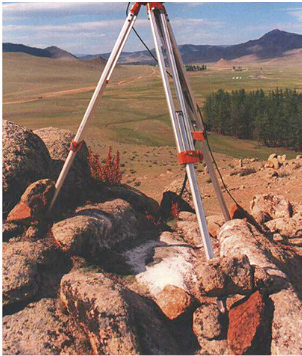
Геодетски инструмент за пријем сателитских сигнала

???? ?????? ? ?????????? ?????????? ?????????????? ?