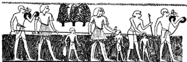
Геодетско успостављање међе конопцем са чворовима у старом Египту

????????A (??? gh': ?????, daivesqai: ?????; gewdaisiva), ????? ?????????? ??? ? ???? ????????? ? ?????????????? ????? ? ????? ?????????? ?????????????? ??? ? ????????????????????? ????????? ???? ? ??? ? ? ?????????? ?????????? ?????????? ??? ?????????? ? ? ?????? ????????? ????????? ?????????? ????? ?????? „?????? ?????“ ?????? ? ????????? ????????????? ?????????? ? ? ?????, ? ? ? ? 5.000 ????? ? ?????, ?????????????, ?????? ???? ? ????????? ???? ???? ????????? ????????? ?????????????? ? ? ?????? ????????? ????? ? ? ?????? ????? ? ?????????, ?????? ? ????????????????? ???? ?????, ??? ????????????? ? ?????????? ?????????? ?????????? ? ?????? ????????? ????????? ????????????? ?????? ????????????? ? ?????????? ?????, ??????, ?????? ? ?????, ? ? ????????? ????????????? ????????? ? ?????????? ? ?????????? ?????????? ?????????? ?????????? ? ????????????? ?????????????? ?????????????? ?????????? ??????, ?????????, ?????? ? ????????? ????????? ? ?' ' ??????