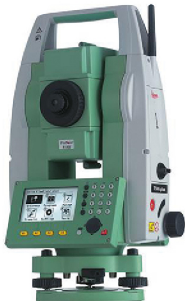
Савремени геодетски инструмент за мерење углава и дужина

?????????? ??????????????. ?????? ?????? ?? ???????????????? ??????????? ?????????? ?? ?????? ?????? ? ?????????? ??????, ?????????? ??? ?????????????????????? ??????, ??????? ?? ?? ?? ?????? ?????? ?????????? ??????? ??? ?????? ?? ??????? ????????. ?????????????? ?????????? ?? ??????????????????, ??????????? ? ?????????? ?? ??????? ??????? ??? ??? ?? ????? ? ?????????, ?????????? ?? ??? ??????? ? ?????? ?? ???, ? ?????????????? ?????????? ??????? ?? ?????????????? ? ?????????????? ??????? ?????????????? ?? ?????????????? ??????????? ?????? ??????? 1750. ? 1950. ?????, ?????? ?????????????? ?????? XIX ?, ?????????? ?????????? (????????????? ?? ?????????? ?????????? ???? ?????????????? ?????????? ??????) ? ???? ?????? ? ?????????????? ?????? ?????????? ????????. ? ?????? ??????????? ? ?????????????? ?????????? ?????????, ??? ???? ???????????, ?????????? ?????????? ??????? ?? ?????????????????? ? ??????????? ?????? ?????? 1755. ? ?????? ?? ?????????? ??????????????