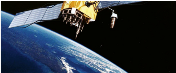
Навигациони сателит система NAVSTAR GPS који се користи у геодезији за позиционирање

????? ???????????? ?????????? ?????????? ???????????????