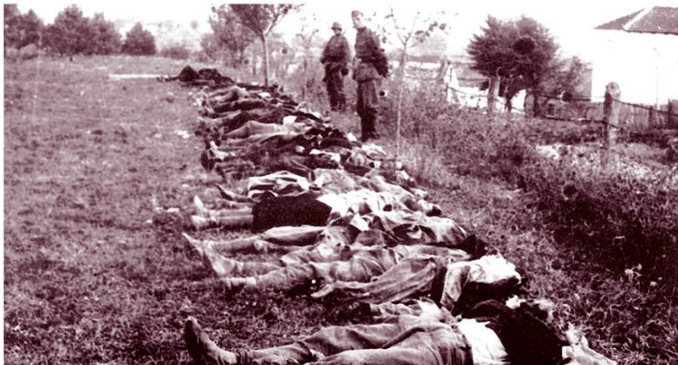
Жртве немачке одмазде, 1941.

???? ?? ??????????? ? ?.. ?????????????? 1950. ? ??????????? ?? ?? ????? ????????? (????????? ??????? ?????????????? ????????? ????????????? ?????, ??, 2/1950). ????? ???, ?????????? ?????? ????? (????????? ?????) ??????????? ?? ??????????? ?????????? ?.. ??? ?????????? ??????? ?????????????? ? ?????????????????? ?????? (??, 141 ? 145), ? ?? ?????????? ?????? ?????? ?????? ?? ?????????? (??, 100).