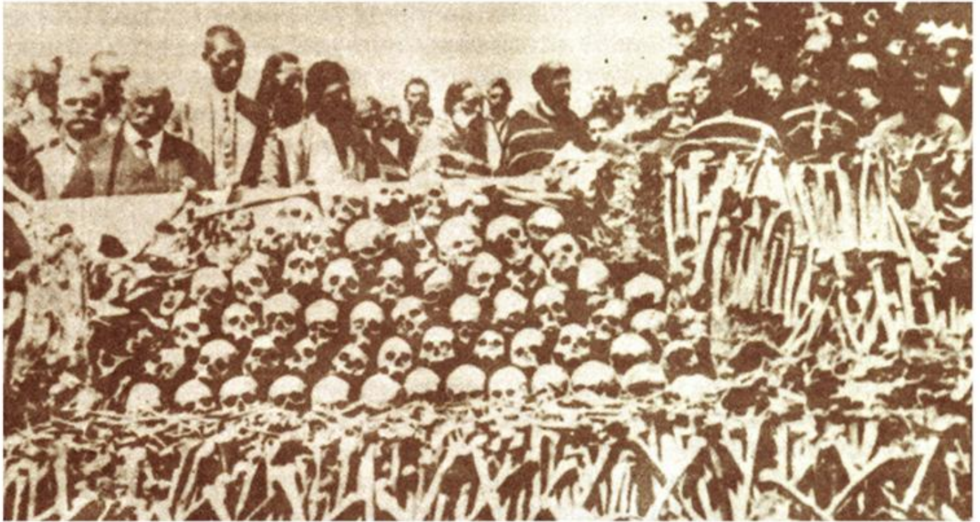
Кости 3.000 ђака, учитеља и свештеника побијених од стране бугарског окупатора у Сурдулици, 1917.