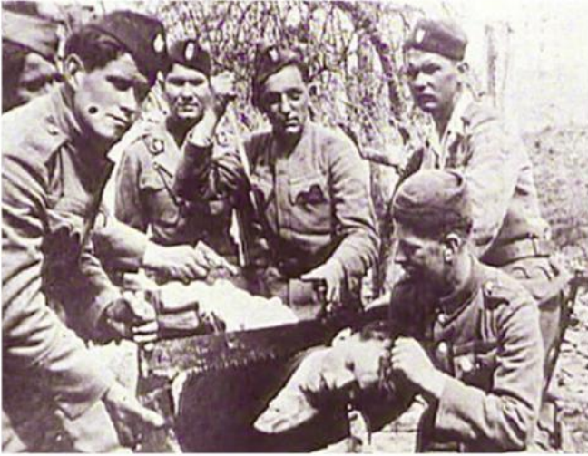
Усташки злочин у Старој Градишки, 1942.

????????? ?????, ?????? ?????????????? ?????? ?????, ??????????? ??????? ?????????, ????????? ?????????? ?????????? ? ?????????? ?????????????? ?????????????? ?????????????? ? ?? ? ?????????? ????????????????? ?????? ? ?????? ?????????????? ?????????? ?????????? ?????????? ?? ?? 30.000 ?????, ? ?????????????? ? ?????????? ?????? 20.000. ?? ?????? ?????????????????? ?????????? ?? ?????? ?????????????? ?????????????????? ? ?????????? ????????? (????, ????, ??????????, ??????????, ???, ?????????????, ??????, ??????, ?????????, ?????????...), ? ??? ? ?????????? ?????? ?????? ?????????????????? ?????????? ?? ?????? ?????? (?? 17. ?? 55. ?????? ??????????) ? ??? ? ?????????? ?????????? ? ?? 80%. ? ?????? ?? ??? ???? ?????????? ?????? ??? ? ??????. ?????? ?????????? ??????????? ??? ???? ???? ?????????????? ? ?????????? ?? 280 ?????????? ?????????? ?????????? ? ? ?????????? 98, ?????????? 42, ?????????? 39. ??? -1918. ?????? ??? 28% ?????????????????? (1.247.000).