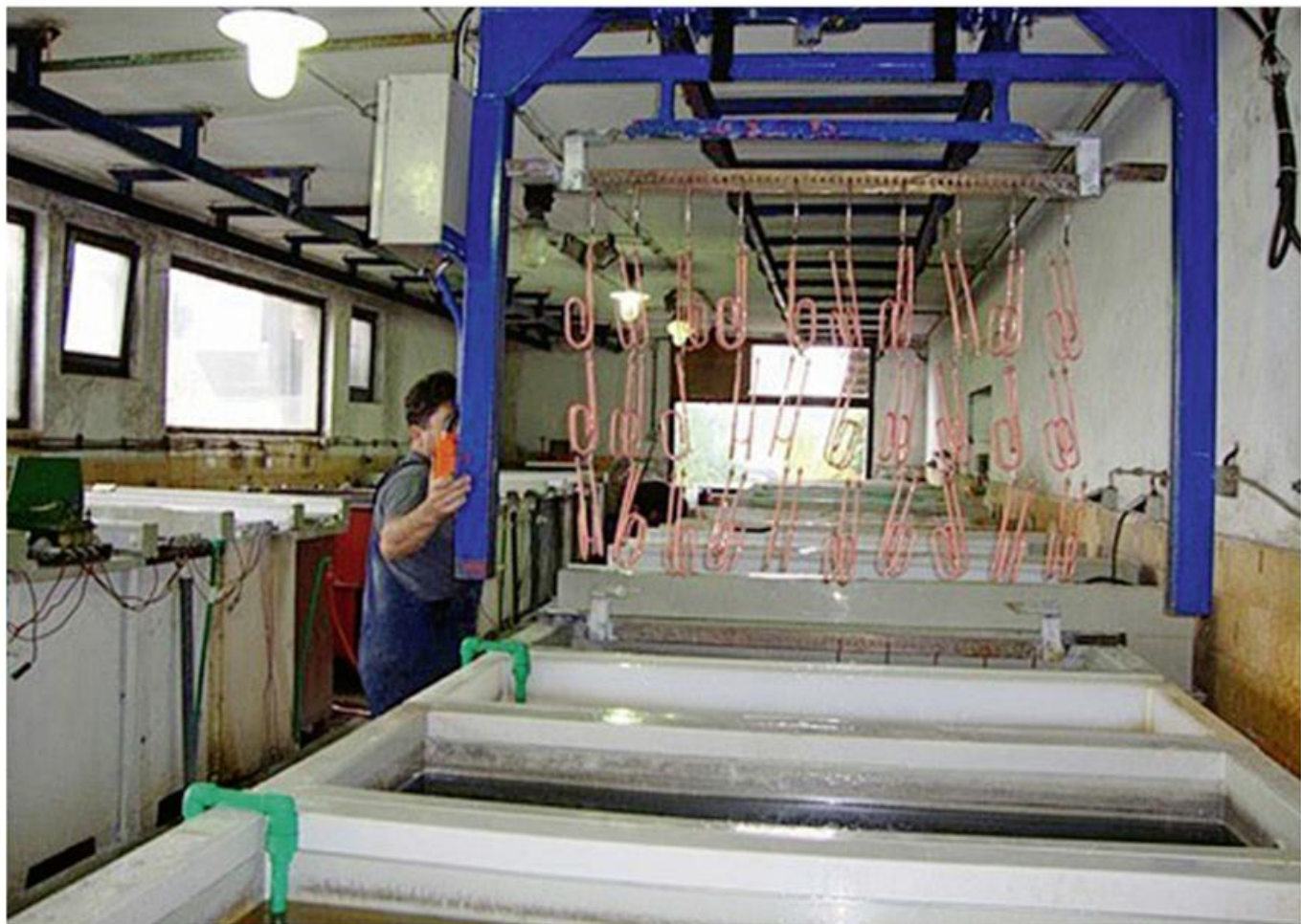
Погон за галванизацију

?????? ? ?????? ?????????????? ?? ?????: „?????”, „?????” ? „?????”, ?????; „????”, ?????; ?????? ? ?????????? ? ?????????? ?????????? „?????”, ??????; ?????? ???-????????????? ?????? ? ?????? ? „????”, ?????; ?????? „????? ??????”, ??????????; ?????????? ?????? „????”, ?????????; „???? ?????????”, ?????? ?????????-????????? ?????, ??????; „????? 1913”, ?????????; „???? ??????”, ?????; „????”, ??? ????? ? ? ?????? ?????????? ?????????? ?????? ?????????? ? ??? ?????? ?????? ? ??? ? ? ?????? ???? ??????????. ????? ?????????? ?????????????????????? ?????????? ? ?????????? ?????????? ?????????? ??? ??? ???? ?????? ?????????????????? ?????? ?????? ?????????? ??? ? ???? ?????????????????, ??? ??? ??: „????????? ?.?.?”, ?????????????; „?????”, ?????????; ?????? ? ???? ? ?????????? ? ?????? ?????? – ?????????; „????????? ?.?.?”, ?????; „?????”, ??? ?????, ????????????????? ? ? ???? ?????????????? ??????????: „????????????????”, ??????; „?????”, ?????? ?????; „?????”, ??????????; „????”, ?????; „????-????”, ?????? ???????.