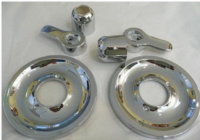
Металне превлаке на пластичним предметима

?????? ???? ?? ???? ?????????? ? ?????????? ???????, ????? ???????????, ?????? ?????????? ?????????? ?????????????? ?????????????? ?????????????? (?????????? ?????? ?????? ?????? ?????? ?????? ?????? ?????, ?????????? ?????????? ?????????? ?????????????? ?? ?????????? ??????) ? ??????? ?????????? ??????????. ?????????? ?????????? ?????????? ?? ?????????? ?????? ?????? ?????????? ?????? ?????? ?????????? ?????????????? ? ?????? ?????????? ? ?????? ??????????