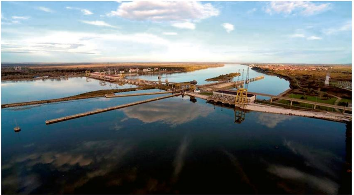
8. ХЕПС Ђердап II – део у главном току Дунава

????? ???? ? ?????????????? ?? ?? ???? 41 ? ??, ? ?????????????? 38,5 ? ??, ?????????????? ??? ?? 7,45 ?, ?????????????? 12,75 ?, ???? 5 ?, ? ?????????????? ?? ???? ???? ???? ???? ???? 2,5 ?. ?????????????????????????? ?????????? ?????????? ?????????? ?? 425 \text{m}^3/\text{s} , ???? ?? ?? ???? 20 ?????????? ?????????????????? ????????? 8.500 \text{m}^3/\text{s} . ?????????????????? ?????? ?? ?????????? ?? 27 MW, ?? ?? ?????????? ?????????????????? ????????? 540 MW, ?? ???? ?? 270 MW ? 10 ?????????? ?????????? ?????. ?????????? ?????????? ?????????? ?????????????????? ?? 2,65 ?????????????? kWh ???? ?? ??????????????????. ?????????? ?????????????????? ?????????? ?? ?? ?????????????? ?? 27 MW ?? 32 MW. ??? ?????????????????? ??? ?????????? ?????????? ?? ?????????????????? ?????????? ?????????????????? ?????????? 7,5 ?, ?? ?????????? ?????????????? (??, 9).