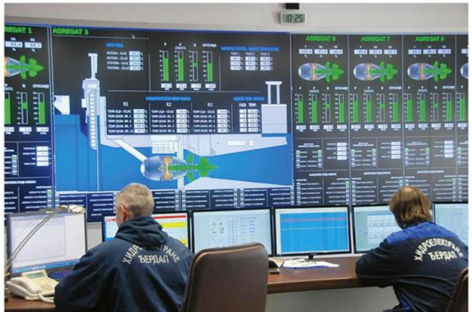
9. Лопатице хоризонталне Капланове турбине и командни пулт у ХЕ Ђердап II

?????????? ?? ?????????????????? ?????????? ? ?????? ? ?????????? 1985--1987, ??? ? 1998. ? 2000. ?????????? ?????? ?? ?????????????????? ?????? ?????????? ?????????? ? ?????????? ?????? ?? ?????????? ?????? ? ?????? ?????????? ?????????? ? ??????????