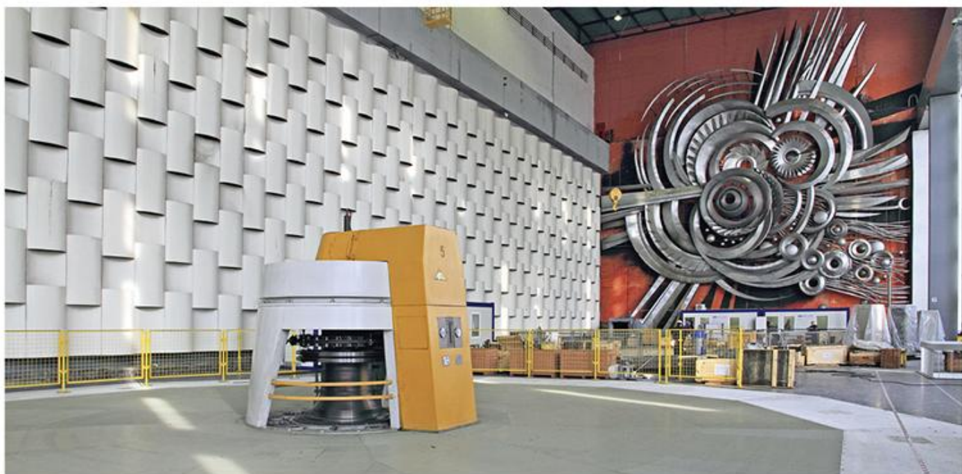
Бергајски вир, скулптура Франа Делалеа

?? „??????“ I ???? ? 1.278 ? ? ??? ???? ? ? ??????? ?????????????????? ?????????? ?? ??????. ?????????? ?? ?? 943. ?? ?????? ?? ???? ? ???? ?????. ?????????? ?? ? ??????????? ??????????. ? ?????? ? ?????????? ??????????? ?????? ?????????? ?????????? ???????, ???? ?????????? ? ??????? ?????? ??????????. ?????????? ?????????? ???? ??????? ??????????. ??????? ?????????? ?????????? ?????????? ?? ?????????? ???? ???? ???? , ??????? ? ? ?????? ?????????? ?????????? ? ?????????? ???????, ?????????????? ?????????????????? ?????????? ?????????????????????? ?????????? ??????. ?????? ?????????? ?????????????? ?? ? ?????????? ???? ? ? ?????? ??????? ?????????? ?? ?????? ?????????????, ?????? ?????????? ?????????????, ?????? ?????????? ?????????????? ?????? ? ? ???? ?????????????? ??????, ? ?????????? ??????????. ?????? ?????? ?????????? ?? ?????????? ???. ??????? ?????????? ?? ??????? ?? ?? ?????? ? ???? ?????????? ?? ?? ?????????????? ?????. ?? ? ? ? ? ??????????, ?????????? ?? ? ?????? ??????????. ?????? ?????? ?????????? ?? ?????? ?? ?????? ?????????????? ? ?????? ?????????? ? ? ? ?????????? ?????????? ?????????? ???????.