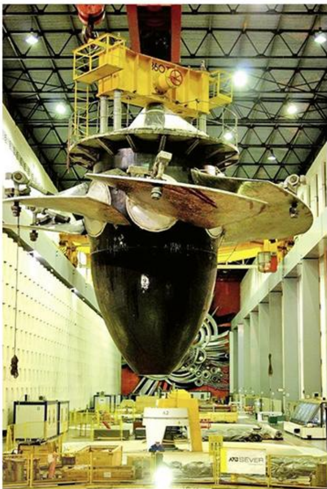
4. Капланова турбина пре спуштања у шахт агрегата

??? ??? ?????? ?????????? ?????????? ?????????? ?????????? ? ??????. ?????????? ?????? ?? ??????????? ?????????????? ?? ??? 1.330 ?????????? ??????????????????. ?????????????? ??????? ?????????? ?? 8.700 \text{t}^3/\text{h} ( 725 \text{ t}^3/\text{h} ?? ?????????) ? ?????????????? ?? ????? ?? ??? ??????????. ?????????? ?? ????? ?????????????????? ?? ?? ????? ????????? ?? ?? ?????????????????? ?????????????? ?????????????? ?????? ?????? ?? ?? ?????????????? ?????????????? ??????????????. ?????????????? ?? ?????? ?????????????????? ?? ?? ?????????? ?????? ?? ?????? ?????????? ?? ?????? 68 ? ???. ?????????? ??, ?? ?? ?????????? ?? 69,5 ? ???. ?????? ?????????????????? ?????? ?? ?? ??? ? ?????????? ?????????????????? ?????? ?? ?????? 63 ? ??, ?????? ?? '????? ? ?????????????????? ?????????? ?? ?????? ??????, ?????????? ?? (????????? ??????) ?? ?????? ?????????????? ?????? ?? 27,2 ?, '????????? ?????? ?? 2.100 MW.