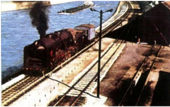
1. Сипски канал, допунска вуча бродова узводно

???? ???? ?? ????????? ??????? ???? ??? ?????????? ??