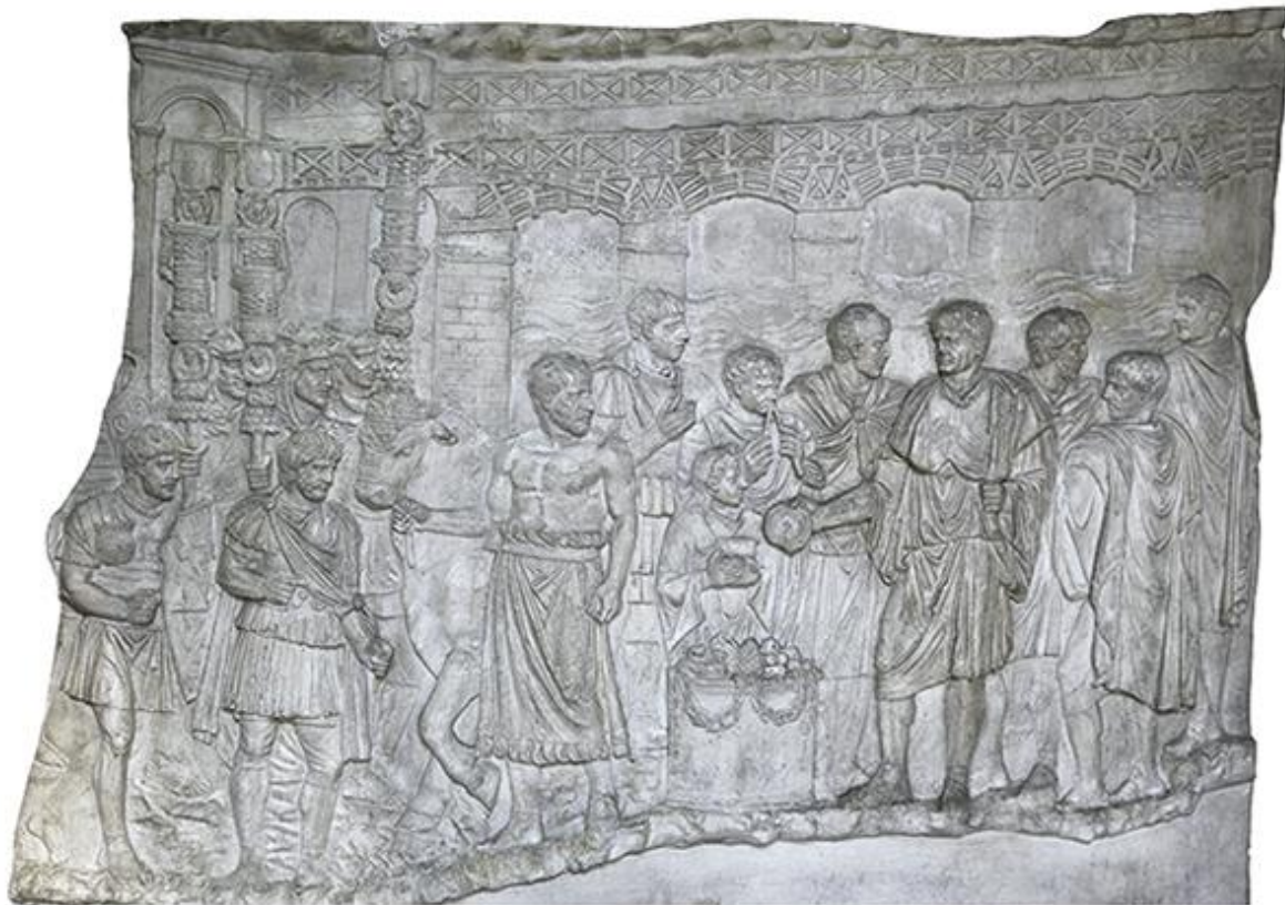
Мермерна плоча са представом Трајановог моста: сцена жртвовања за успешан прелазак преко Дунава

????, ?? ????????? ?? ????????. ?? ????? ????? ?????????????????? ?? 27 ??????? ???????????, ????? ?? ??????????? ? ?????? ?? ?????? ??????. ?????? ??????? ?? ?? ??????????????? ??????????? ??????????????, ????? ????? ???????????, ??????????????? ?? ??????????? ?? ??????. ??? ? ?? ?????????? ?????????? ??????? ?????????????? ? ??????? ??????????? ? I, ?????? ?????????? ??????? ?????????, ????? ?? ?????????????????? ?? I ?? ?????? VI ? ????????? VII ?, ??? ??? ?? Diana -- ?????????, Pontes -- ?????????? ????? ? Egeta -- ????? ?????????.