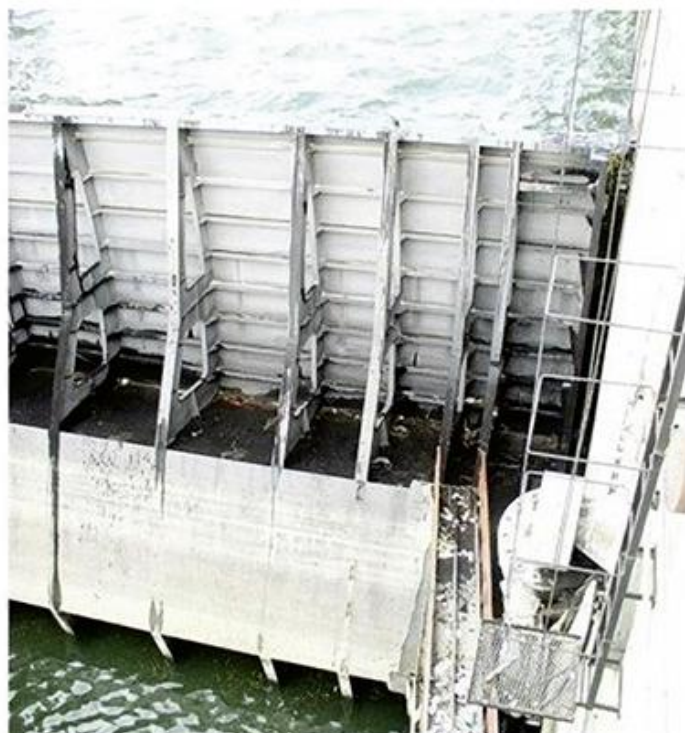
10. Сегментни затварачи на преливним пољима ХЕ Ђердап II