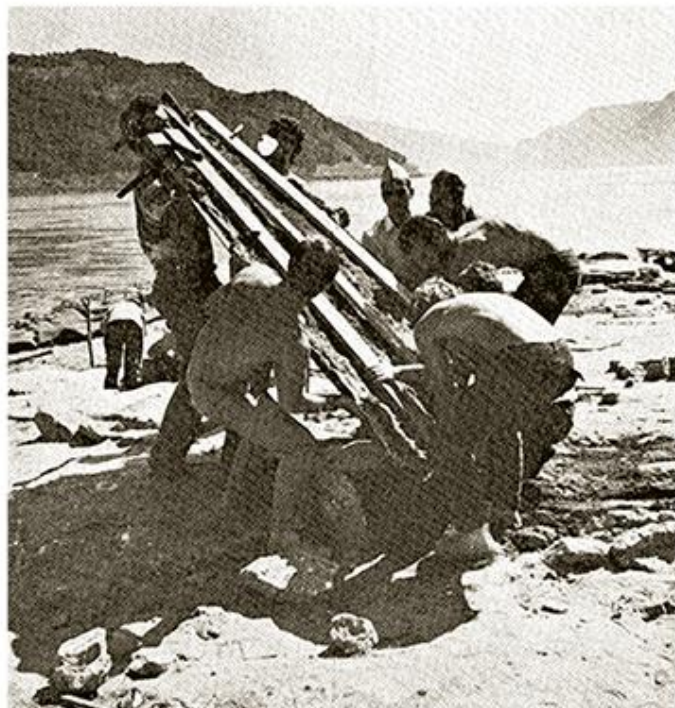
Премештање куће приликом истраживања Лепенског Вира

??? ?????? ????????? ?? ?????? ??????? ????