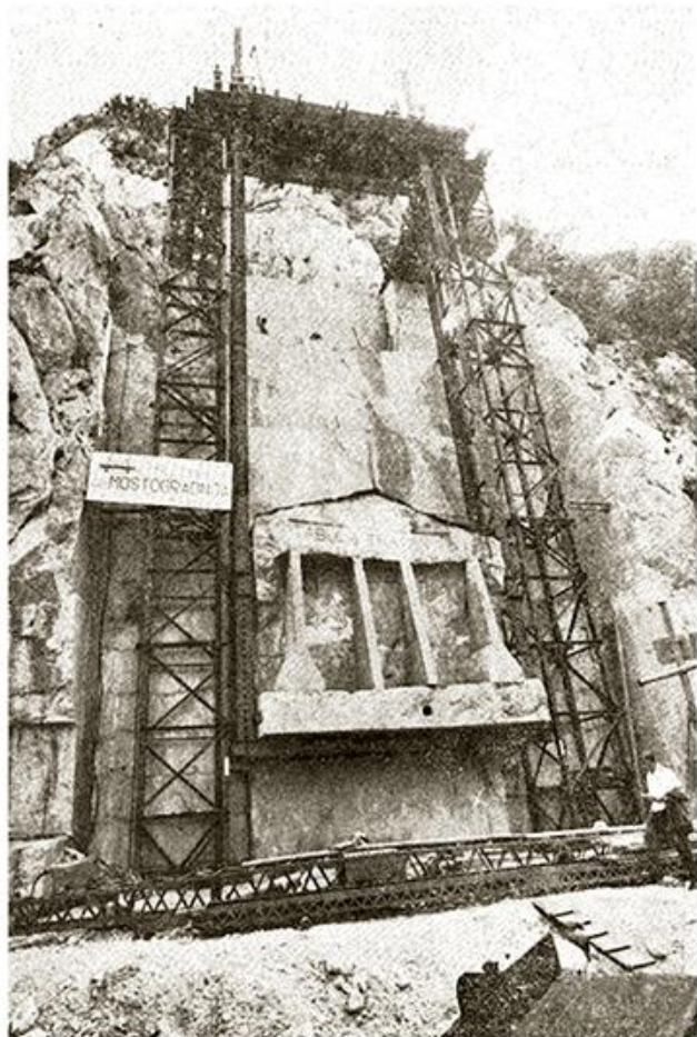
Премештање Трајанове табле

????? ?? ?????????? ?????????? ? ?????????? ???????