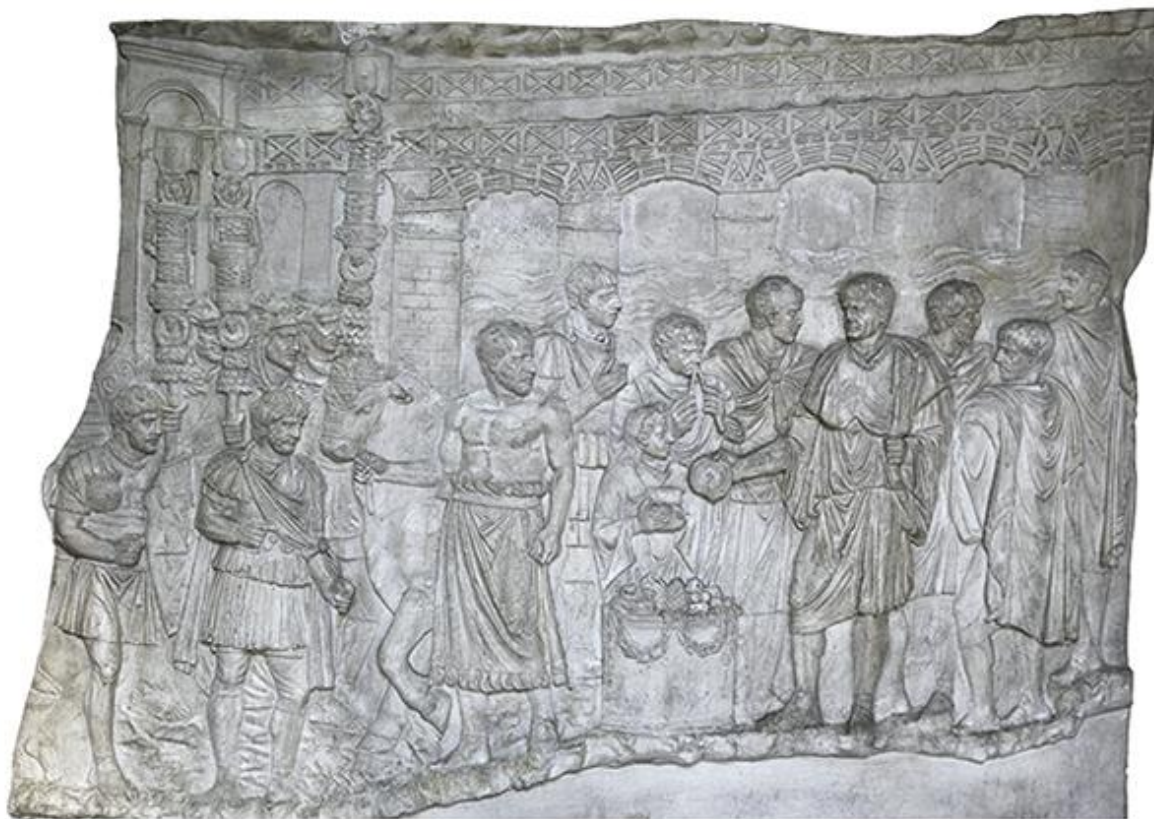
Мермерна плоча са представом Трајановог моста: сцена жртвовања за успешан прелазак преко Дунава

????, ?? ????????? ?? ????????. ?? ????? ????? ?????????????????? ?? 27 ??????? ???????????, ????? ?? ??????????? ? ?????? ?? ?????? ??????. ?????? ??????? ?? ?? ??????????????? ??????????? ??????????????, ????? ????? ???????????, ??????????????? ?? ??????????? ?? ??????. ??? ? ?? ?????????? ?????????? ??????? ?????????????? ? ??????? ??????????? ? I, ?????? ?????????? ??????? ?????????, ????? ?? ?????????????????? ?? I ?? ?????? VI ? ????????? VII ?, ??? ??? ?? Diana -- ?????????, Pontes -- ?????????? ????? ? Egeta -- ????? ?????????.