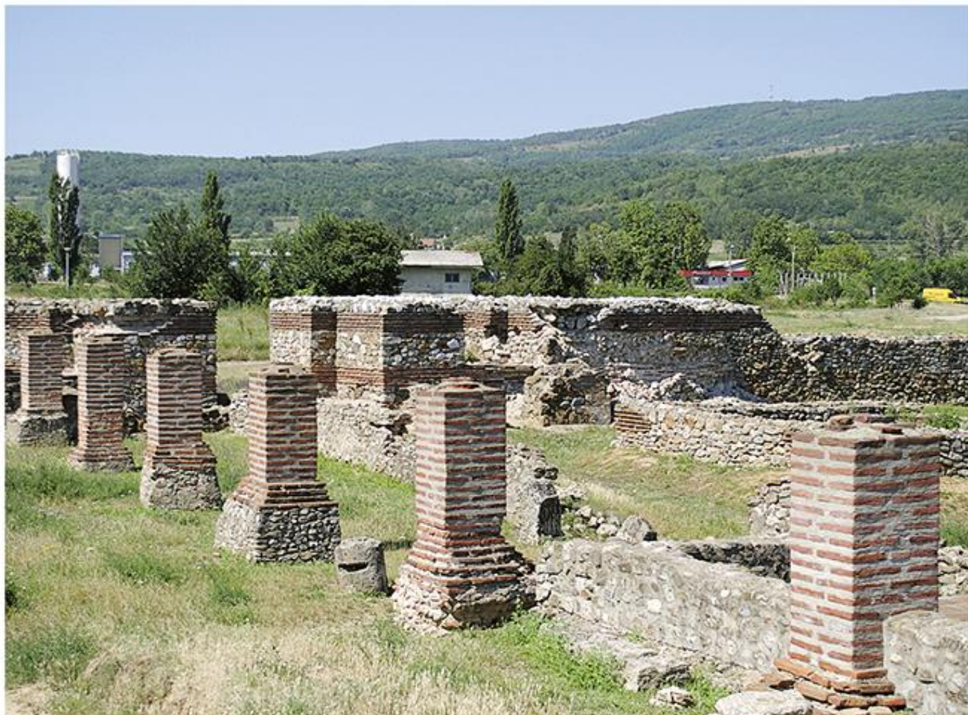
Остаци некадашњег утврђења Дијана-Караташ

???????????????? ?????? ?????????? ?????????? ? ? . I ?? ?????? ?????????, ??? ??? ?? Novae-??????, Taliata -- ????? ???????????, Smorna-????????? ? Transdierna-???????. ??? ??? ?????????? ?????? ????????????????? ???????, ??????? ?????? 120--160 ?, ????????????????? ?????????? ??? ?????????? ?????? ?????????? ??????. ?? ??????? ?? ??????? ??????? ?? ?? ?????? ???????, ????????? ??????? ?????, ? ?? ?????? ????? ?? ??????? ? ?? ??????? ????? ??????????. ?? ?????????? ?? ????? ??? ?????, ????? ?? ?? ??? ?????? ?????????? ?????? ?????? ?????????? ? ?? 20.