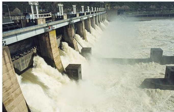
3. Преливни део бране Ђердап I са затвореним табластим уставама (лево) и током пропуштања велике воде (десно)