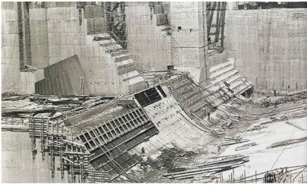
7. Бетонирање преливног дела бране под заштитом загата II фазе

????????????? ???????? ???? ?? ??????? ?? ???????