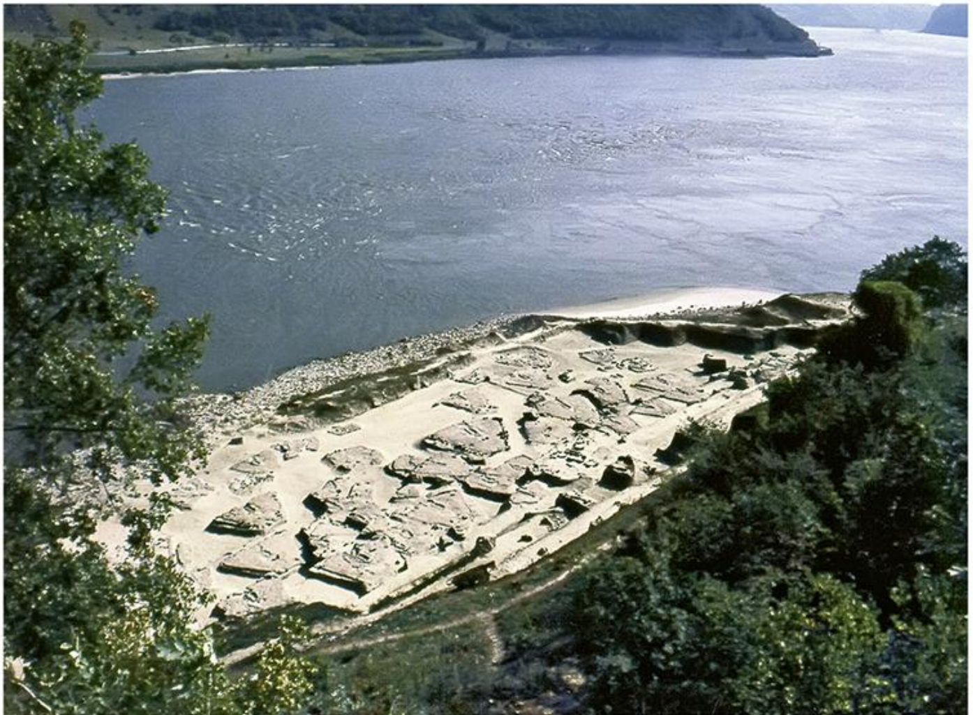
Археолошко налазиште Лепенски Вир

?????? ???????. ????????? ? ?????? ????????? ?????????? ?????????????? ?????????????? ??. I ?????????? ?????????? ?????????? ? ????-????????, ?????????????, ????????? ?????? ? ?????????????????? -- ??????, ????????? ? ??????, ??? ????????? ??? ?????? ????????? ????????? ?????????, limes ?? ??? ?????? ??????. ?????????????? ?? ?????? ?????????? ?????????? ?? ????????? ?????? ????????? ?????????????? ?? ??. I, ?? ?????? ?????? ?????? ? ?? ?????? ?????, ?? ??? ?? ??????????. ?? ??? ?????? ?????????????? ?? 23 ?????? ??????????, ??? ?? ?????????? ? ?????? ?? ?????? ???. ?????????? ?? ?????????????? ?? ?? ?????????? ?????????????? ?????????????? ?????????????? ?????????? ?????????? ?????? 60-?? ?????? XX ?. ??? ??? ? ??????, ??? ?? ?? ?????? ?????? ?????????? ?????? ?????????? ?????????? ??????????. ??????, ?????? ?????????????? ?? ?? ?? ??????????, ?? ?? ?????? ? ?????????? ?????????? ?????? ??????, ?????????, ?????? ??????????????. ? ?????? ?? ?????????? ?? ?? ?????? ??? ?????????? ?????????? ?????????? ?????? ??????, ?????? ?????????? ?????????????? ?????????????????, ??? ? ?????????? ?????? ?? ?????? ??????????.