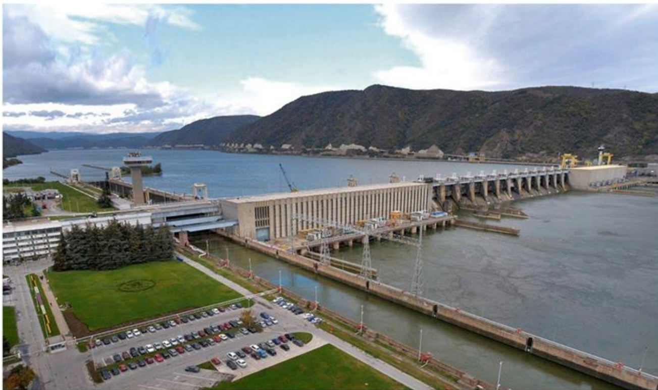
2. ХЕПС Ђердап I – објекти на српској страни, слева надесно: управна зграда, бродска преводница, електрана, преливни део бране