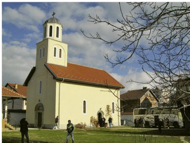
Обновљена манастирска Црква Успења Пресвете Богородице

????? ?????? ?????????????? ??? ?????? ? ?????????????? ?????? ?? 22. X 1912. ?????????????? ?????????????? ?., ???? ? ? ??? ?????? ?? 2.000 ?????????????????, ?? ??? 116 ??????? ? 24 ??????????. ?????? ?????? ????????????????, ??? ? ? ??? 1913. ?????????? ?????? ?????? ??????, ? ?? ?? ?????? 14.500 ?????????????. ?. j? ?????????????????? ?????????? ?????? ? ?????????? ?????? ??? 1913. ??? ? ?????? ?????????????? ??????. ????? I ?????????? ??? ?????????? ?? ?? ?????????????????? ??????, ? ????? 1. XII 1918. ??????? ??, ??? ????????? ?????? ?????????????, ??? ?????????????? ?????????? ???. ??????? ?????????????????? ??????? ????????????? ?? ?????????? 1920. ?????? ?? ??? ? ?????? ??????????, ? ?? 1931. ?????? ??????????. ?????? ?????? ????? ? ??? ? ?????????????????????? ?????????? ??????? ???????