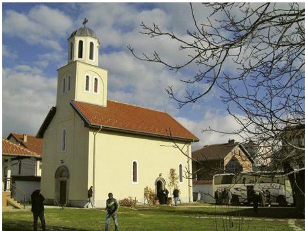
Обновљена манастирска Црква Успења Пресвете Богородице

????? ?????? ??????????? ??? ?????? ? ??????????? ?????? ?? 22. X 1912. ??????????? ??????????? ?., ??? ?? ??? ?????? ?? 2.000 ???????????????, ?? ??? 116 ??????? ? 24 ??????????. ?????? ?????? ??????????????, ??? ?? ? ??? 1913. ?????????? ?????? ?????? ??????, ? ?? ?? ?????? 14.500 ???????????. ?. j? ??????????????? ?????????? ?????? ? ?????????? ?????? ??? 1913. ??? ? ?????? ??????????? ??????. ????? I ?????????? ??? ?????????? ?? ?? ??????????????? ??????, ? ????? 1. XII 1918. ?????? ??, ??? ????????? ?????? ???????????, ??? ?????????? ?????????? ???. ??????? ??????????????? ??????? ??????????? ?? ????????? 1920, ?????? ?? ??? ? ?????? ??????????, ? ?? 1931. ?????? ??????????. ?????? ?????? ????? ? ??? ?????????????????????? ??????? ??????? ???????