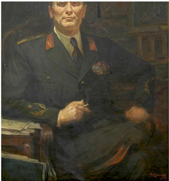
Паја Јовановић, Портрет Јосипа Броза Тита , 1947. (Уметничка збирка САНУ)

????? II ????????? ????? ????? ?? ?????????????????? ?