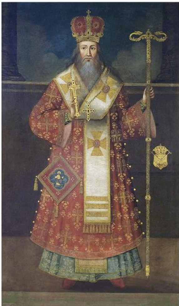
Јов Василијевић, Патријарх Арсеније III Черновић, 1744 (МСПЦ)

?????????????? ??????? ??????? ? ?????? ??? ?????????? ?????? ?? ?? ?????????? ????????? ?????????? ?????????????? ? ?????????????? ?????????, ??????????? ? ??????. ????? ? ?????????? ?????????? ? ??????? ??????????? ? ?????? ?????????????????? ? ??????????????? ?????? ??????????? ?? ? ?????? ?? ?????????? ?????????? ? ?????????????? ??????????????. ?????? ?????? ?????? 1690. ?????? ?????? ?????????? ??? ?????? ?? ? ?????????? ?????????? ?????????????? ?????????, ?? ? ?????????? ?????? ?????????????? ?????? ? ??????? ?????????????? ?????????? ??????????. ??? ?????????? ?????????? ?????????????? ?????????? III ?????????????? ?????? ? ? ? ? ?