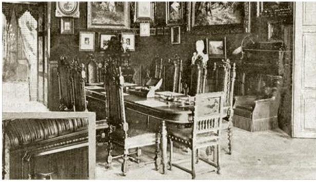
Министарска сала из времена владавине краља Александра Обреновића у Старом конаку

????? ????????? ?????????? ?? ??????, ????????? ??