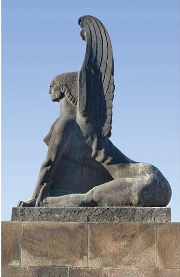
Иван Мештровић, Сфинџа, 1933.

????? ?????? ?????????? ? ?????????? ?????????? ?????? ?? 1904. ??? ?????????, ? ?????? | ?????????? ??? ???? ???? ?? ?????????? ? ??? ?????????? ?????? (?.. ?????? ??????, ??? ???? ?????????? ?????????????? ?????????????, ??? ? ? ? ??? ?????????? ?????????? ?????? ?., ? ??? ?., ??? ? ? ??????????, ? ???? ?????? ?????????? ??????????, ?????????? 1911). ?? ?? ??? ?????? ?? ?????? (?? 1921. ???) ?????????????? ??????????????, ?? ?????????????? ?????????????, ??? ?????? ??????????????, ??? ? 1922. ?????????? ?????????????????? ??? ? ? ?????????????, ? ?????? ?? 1. XII 1918. ?????????????? ?????????????????? ??????????????. ?????? ?????????? ?????????? ?????????????? ?????????? 1922, ?????????????? ?????????? ?????? ? ? ?????? ?., ? 1929. ?????????? ? ? ?????????? ?.. ?? ??????, ?????????? ? ?????????? ?????????? ?????????????? ?????????????? ?????????????? ?????????????? ? ? ??????, ?? ?????????? ? ? ?????? ?., ??? ? ? ? ?????? ?????????????? ??????. ?????? ? ?????? ?????? ?? 1934. ?????????? ? ??? ?.. (??