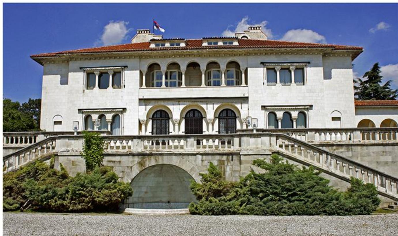
Краљевски двор, 1925.

?????? ?? . ??????? ?????????? ?? ?????????????? ???? ? ?????????? ???? ???? ?????????? ?????? ? ?????????? ?? ?????????? ?????????? ?? ?????????????? ?????????????? ??????. ?????????????? ?? ?????? ?????????? ?????????? ????????? ? ?????????? ??????????, ? ?? ?????? ?? ?????????? ?????? ? ?????????????????? ?????????? ?????????? ????????? ?? ?? . ?????????? ?????????????, ?????????????? ?????????? ?????????????????? . ??????? ??????? ????????????? ?? ?????????????? ???? ?????????????? ?????? ?? ??????? ?? . ?????????, ? ?????????? ?? ?? ?????? ?????????? ?????? ?????????, ??????? ?????????, ??????? ?????????????? ? ?????? ???????.