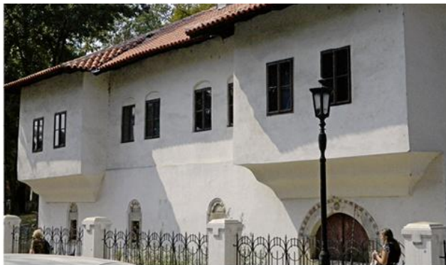
Амицин конак, део двора кнеза Милоша у Крагујевцу

???? ??. ??? ????????? ????????? ? ???????