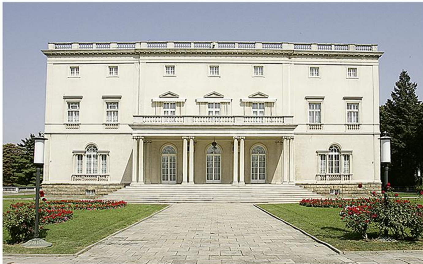
Бели двор на Дединју, 1934.

????????? ?????????? ?? ?????????? ?????????????? ????? ?????????????? ?????????????????? ?????? ?? ??? 1909, ?? ?????? ?????????? ?????? ?????? | ?????????????????? (1903–1921). ??? ??????? ?????????? ?? ?????????? ? ?????????? ?? ?????????? ??????????????. ?????????? ?????????????? ?????? ?? ?????? ?????? ?????? ?? ?????????????????????????????? ?????????????????, ??????? ?????????, ?????????? ??????????, ?????????? ?????????? ? ?????????? ??????? ??????????. ?????????? ?????????????? ?????????? ?????? ? ?????????????? ??????? ?????????????? ?? ?????????????? ?????????????????? ??????. ??? ?? ?????? ?????? ?? ?? ?????????????? ??????, ? ??? ?????????? ?????????????? ?????? ?????? ??????? ?????????????? ?????? ?????? ?????? ?????? ?????????????? ? ?????????????? ??????. ? ?????????????????????? ?????????????????? ?????????????? ?? ?????????? ?????? ? ?????? ?? ?????? ?????? ?????????? ?????? ?????????? ?????????? ??????, ?????????????? ??????, ?????????? ?????????, ?????????????? ?????????????? ?????????? ? ?????????????????? ?????????????????? ??????. ?????? ?? ?? ?????????? ?? ?????????? ? ?????? ?? ??????????, ?????????????????? ??? ?????????? ?????????????? ?? ??. ?????? ?? ?????? ?????????????? ??? ?????????????? ??????????????. ?????????? ?? 1921. ?????????? ?? ?????????? ?????????? ?????????????????? ?????? ?? ??? ?????? ?????????? ? ?????????? ?????????? ? ?????? ?????????? ?? ??????????????.