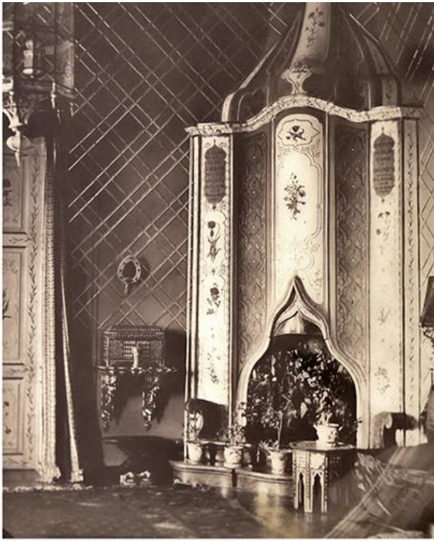
Оџаклија у неорококо стилу у Старом конаку

???? ??????? ?? ????? ?????????????? ?????? ?