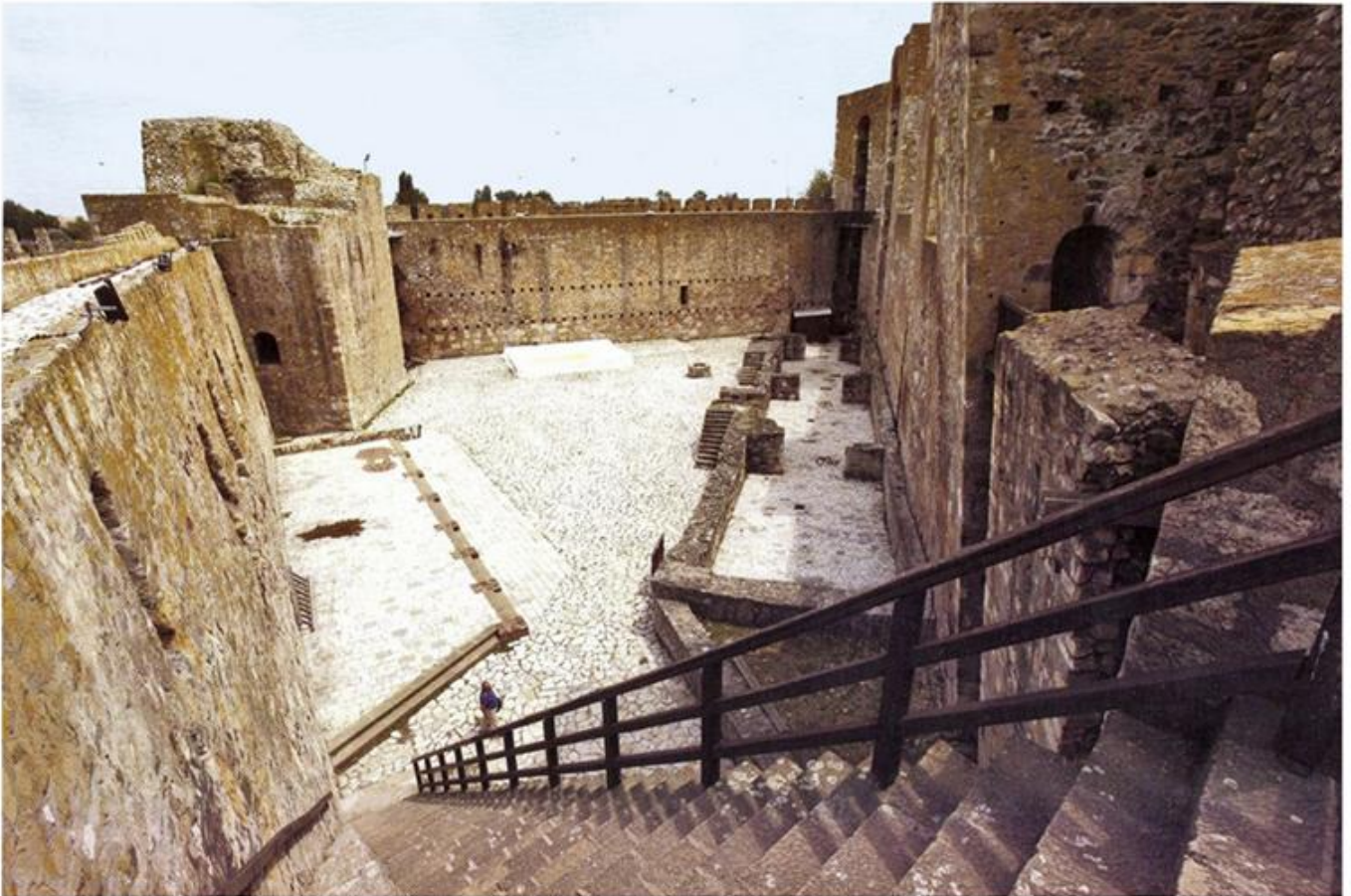
Остаци двора деспота Ђурђа са свечаном двораном

?????? ?? ????????? ??????????? ??????????, ??? ??? ?? ??? ?????? ? ?????????? ??? ?????? ?????????????? ??? ??????? ?? ???????????, ??? ? ??????. ??????? ?. ?? ?????????? ?????????? ? ?????????????? ?? ?????????? ?????????? ? ?????????? ??????????. ??????? ?????????????????? ?? ?????? ??? ?????????? ???????, ??????? ??? ??????????. ??????????? ?? ??????????? ??????? ?????????, ?????????????? ????????? ? ??????? ????, ?????????? ??? ?? ??????????? ??? ??????? ????, ?????????? ??????????. ??????????? ??????? ? ??????????, ?????????????????? ?????????? ? ??????????? ??????? ???????, ??????????????? ?? ? ?????????? ?????????.