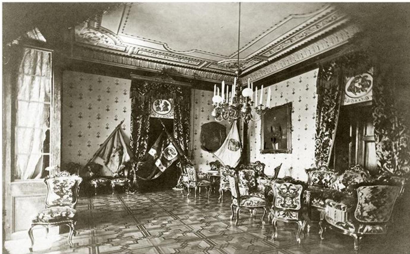
Црвени салон са портретом кнеза Михаила у Старом конаку