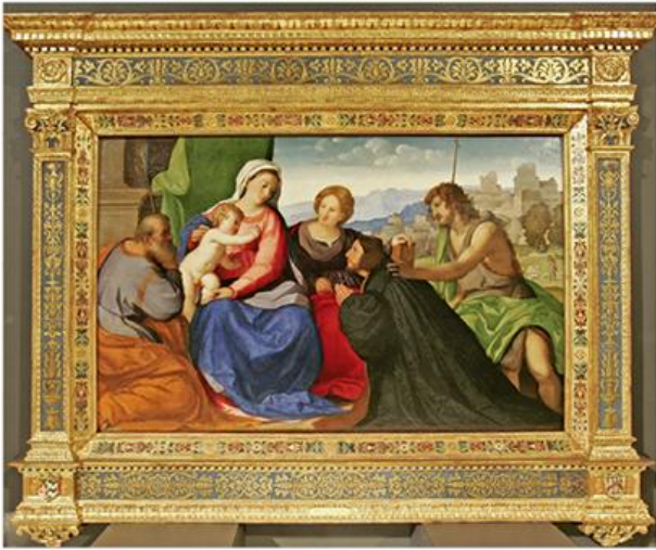
Палма ил Векио, Свеџа йорудица са Св. Јованом, Св. Кайшарином и донаџором, око 1526.

?? ??????? ?? ????? ?????? ????? ?????? ??????? ?????? ?? ?????? ?????????? ?????????????? -- ?? ?????????????????? ? ???????????, ?? ?????????????? ? ????????. ?????? ?????????????? ?????????????? ?????????????? ?????? ?????????? ??????? ?????? ? ?????? ??????? ?????? ??????, ??????????, ?????? ? ??????????????. ?????? ?? ?????????????? ?????? ?????? ?? ?????? ?????? ?????????????? ? ?????? ?????????? -- ??? ?? ?????? ? ?????? ?????? ? ?????????? ?????? ?? ?? ??????????. ?? ?????????????? ?????????? ?????????????? ?????????????? ??? || ?????????? ?????? ?????????????????? ?? ?????? ??????????????, ??? ?????????? ??????? ?????? ?? ?????????????? ?????? ?????????????? ?????????? ?? ??????, ? ?????? ??????, ?????? ?? ?????????????, ?????????????? ?????????????? ? ?????????? ??? ?????????????????? ?????? ?????????????? ?????? ?????????? ?????????????? ?????? || ?????????????? ?????? ?????? ? ? ??. ? ?????????? ?????????????? ?????????????? ?????????? ?????????? ?! ?????? ?????? ?????? ? ?????????????????? ?????????????? ?????????? ?! ?????????? ? ?????????? ?????? ??????????.