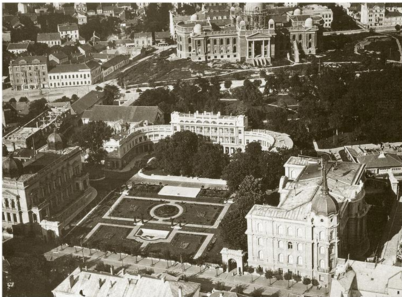
Дворски комплекс с новоизграђеном зградом Дворске страже, 1920.

?????? ?????? ?? ?????????-????????????? ???????? ? ?????????? ??????? ? ??????? ????????? ????????? ??????.