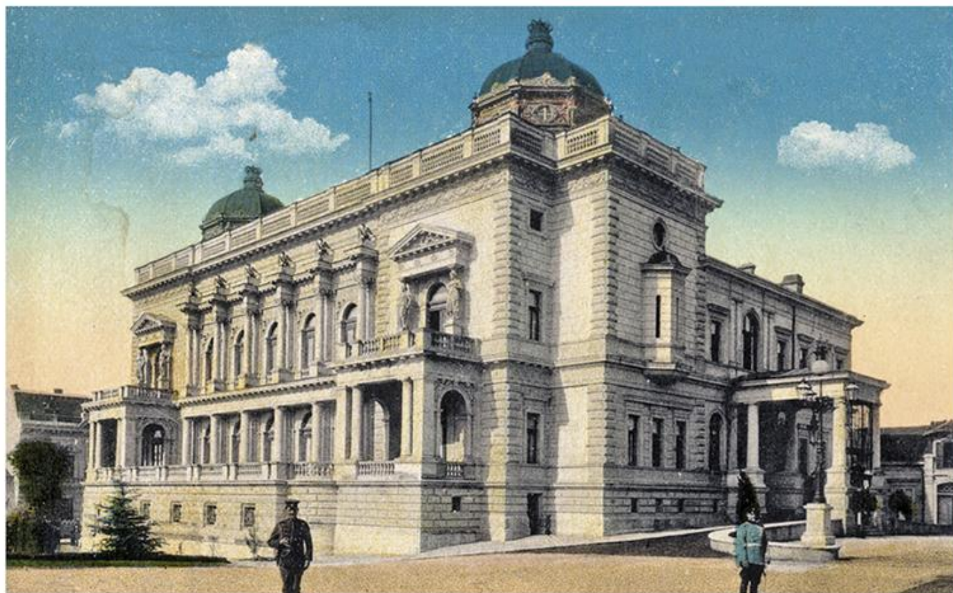
Краљевски двор на Теразијама, 1881–1884.

???????? ?????????? ?????????? ?? ? ?? ?????????????? ?????????? ?????????? ?????????? ?? ?. ????? ?? ?? ????? ????? ????? ?? ????? ?????? ?????????????? ? ????? 1874. ?????????? ?? ????? ??? ?????????? ?????? ????? ?? ?????????? ??????. ?????????????????? ??????? ?????????? ?????? ?? ????? ?????? ?????????????????? ?????????? ??? ????? ?????? ??????, ??? ?? ?????? ?????????? ?????????????? ?? ??????. ????? ?? ?????????????? ?? ?? ?????????????? ?????????? ?????????? ?? ?????????????????? ??????????????????.