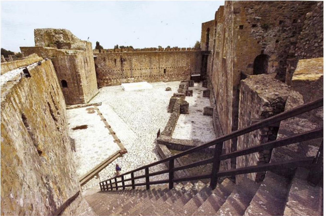
Остаци двора деспота Ђурђа са свечаном двораном

৷৷৷৷৷ ৷৷ ৷৷৷৷৷৷৷ ৷৷৷৷৷৷৷৷৷ ৷৷৷৷৷৷৷৷৷, ৷৷ ৷৷ ৷৷ ৷৷ ৷৷৷৷৷ ৷ ৷৷৷৷৷৷৷৷ ৷৷ ৷৷৷৷৷৷ ৷৷৷৷৷৷৷৷৷৷৷৷ ৷৷ ৷৷৷৷৷৷৷ ৷৷ ৷৷৷৷৷৷৷৷৷৷, ৷৷ ৷ ৷৷৷৷৷. ৷৷৷৷৷৷৷ ৷. ৷৷ ৷৷৷৷৷৷৷৷৷ ৷৷৷৷৷৷৷ ৷ ৷৷৷৷৷৷৷৷৷৷ ৷৷ ৷৷৷৷৷৷৷ ৷৷৷৷৷৷৷ ৷ ৷৷৷৷৷ ৷৷৷৷৷৷৷৷৷৷৷৷৷৷৷ ৷৷৷৷৷৷৷৷৷. ৷৷৷৷৷৷ ৷৷৷৷৷৷৷৷৷৷৷৷৷ ৷৷ ৷৷৷৷৷ ৷৷৷৷ ৷৷৷৷৷৷৷৷৷ ৷৷৷৷৷৷, ৷৷৷৷৷৷ ৷৷৷ ৷৷৷৷৷৷৷. ৷৷৷৷৷৷৷৷ ৷৷ ৷৷৷৷৷৷৷৷৷ ৷৷৷৷৷৷ ৷৷৷৷৷৷৷ ৷৷৷৷৷৷৷৷৷, ৷৷৷৷৷৷৷৷৷৷ ৷৷৷৷৷৷৷ ৷৷৷৷৷৷৷ ৷ ৷৷৷৷৷৷ ৷৷৷৷, ৷৷৷৷৷৷৷ ৷৷৷৷ ৷৷৷৷৷৷৷৷৷ ৷৷৷ ৷৷৷৷৷৷ ৷৷৷৷৷৷ ৷৷৷৷৷৷৷ ৷৷৷৷৷৷৷. ৷৷৷৷৷৷৷৷ ৷৷৷৷৷৷ ৷ ৷৷৷৷৷৷৷৷৷, ৷৷৷৷৷৷৷৷৷৷৷ ৷৷৷৷৷৷৷৷ ৷ ৷৷৷৷৷৷৷৷৷ ৷৷৷৷৷ ৷৷৷৷৷৷৷৷, ৷৷৷৷৷৷৷৷৷৷৷৷ ৷৷ ৷ ৷৷৷৷৷৷৷ ৷৷৷৷৷৷৷.