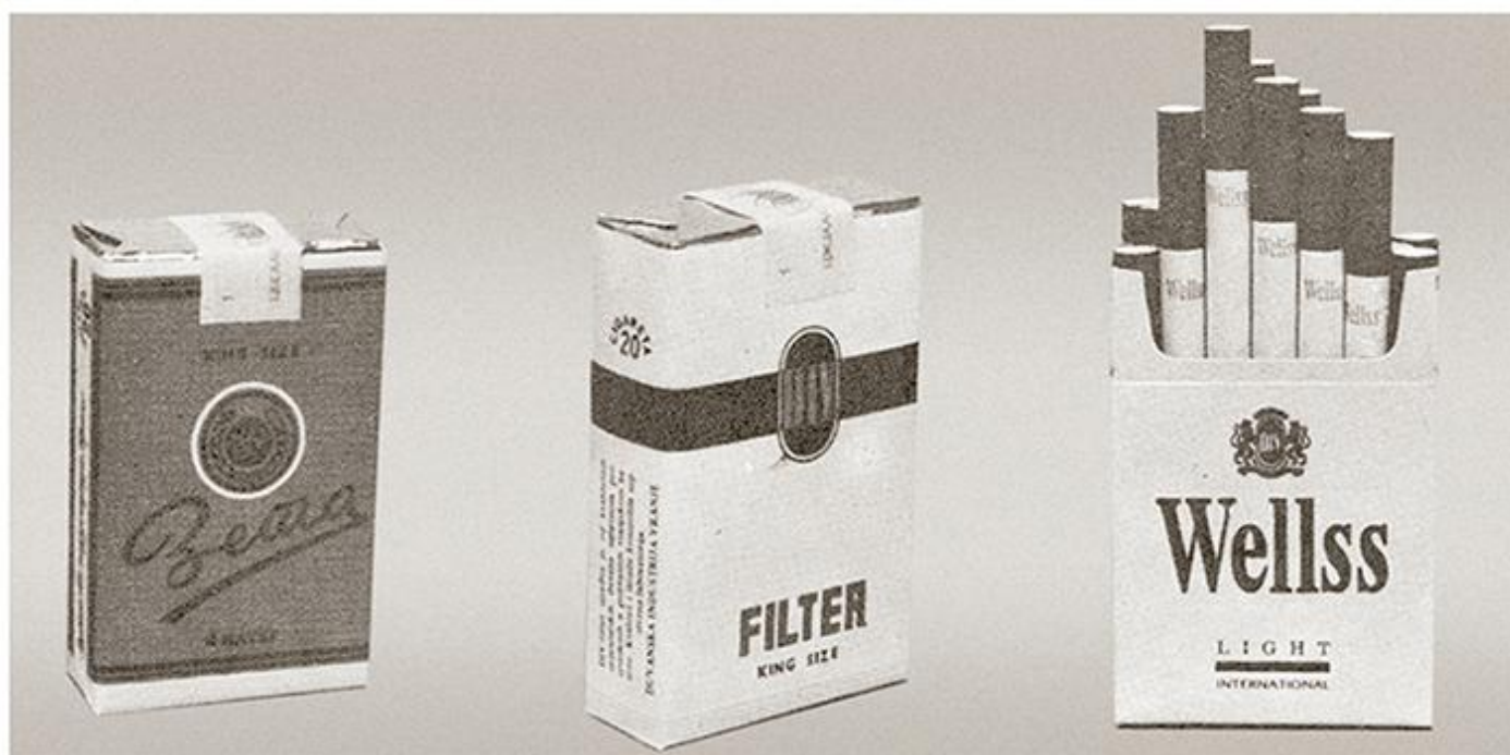
Производи Дуванске индустрије Врање

?????? ?????????? ?? ? ??????. ??? ?????????? ? ?????????? ?????????? ?? ?????????? ??? ?????? ????????? ??????. ?????? 1963. ?????? ?? ?????????? ?????? ?? ?????????? ??????, ??? ?? ?????????????? ??????, ????????????, ?????? ? ?????? ?? ?????????? ?????????? ?? ?????????? ? ??????????