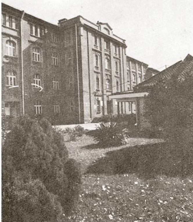
Дуванска индустрија Врање

????? ???? , ?? ????????????? ????????? ????????????? ?????????????