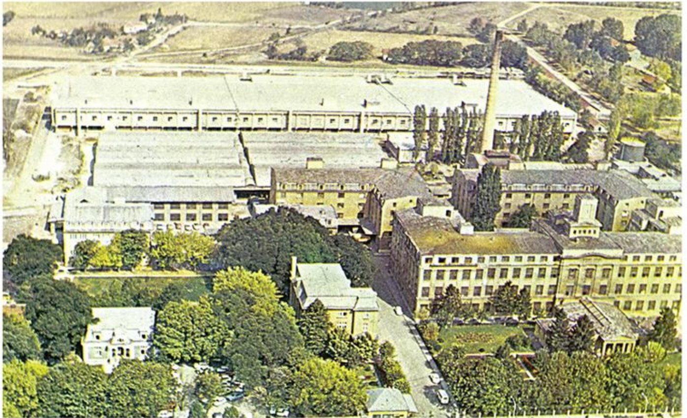
Дуванска индустрија Ниш