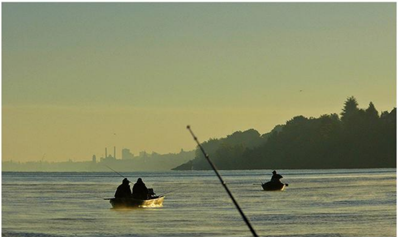
Дунав код Смедерева (ТО града Смедерева)

?? ?????? ?????????? ?? 1948. ?????????? ?????? ?????????? ?? ?????????? ?????????????? ?????????? ?????? ?? ?????? ?????? ?????? ?? ?????? ?? ?????????? ?????????? ?????????? ?.. -- ?????? ?????????? ??????, ?????? ?????? ?????????????? ??????, ?????? ?????????????? ??????????, ?????? ??????????????, ????????? ? ??.. ?????? ??? ?????? ? ????? ?? ?????? ?????????????? ?????????????????? ?.. ? ????? ?????????? ?????????? ?????? ?? ?????? ?????????????? ?????????????????? ?????????, ????????? ?????????? ????? ??????????