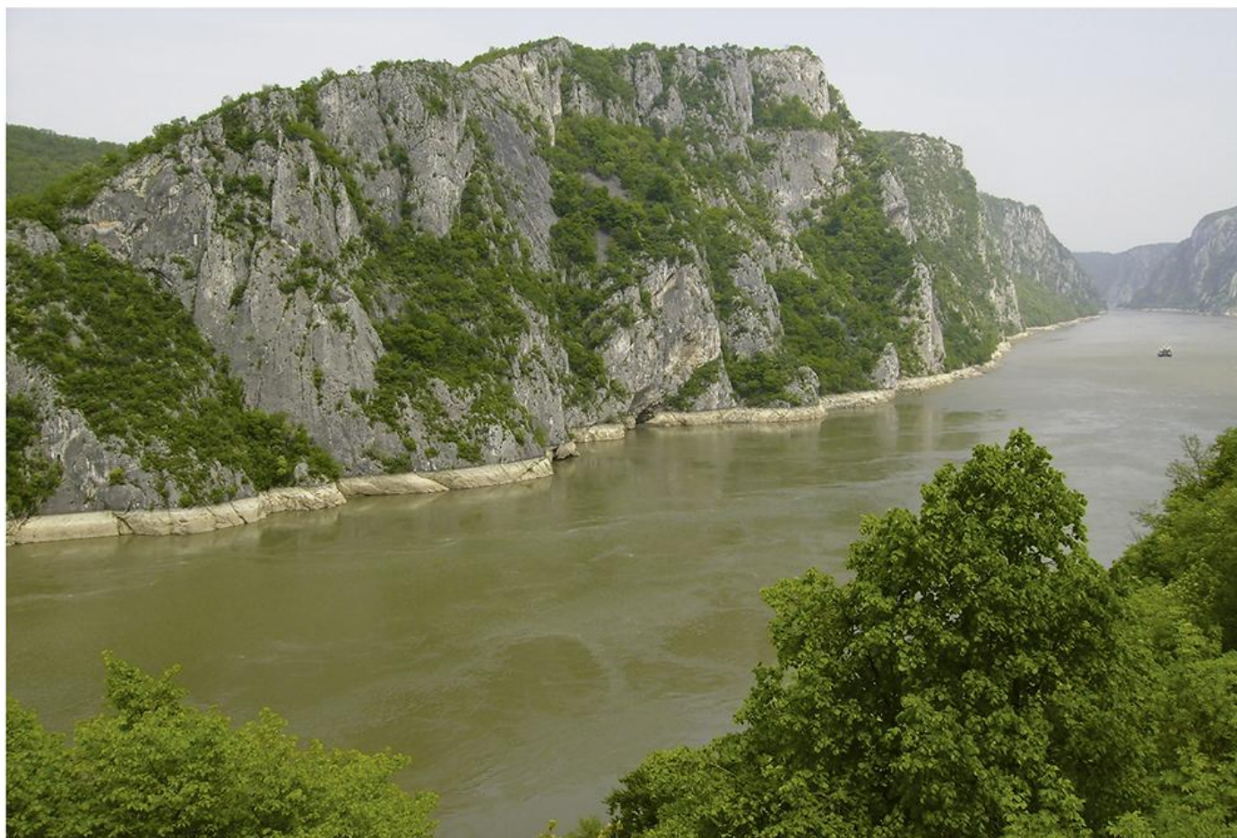
Дунав код Голупца