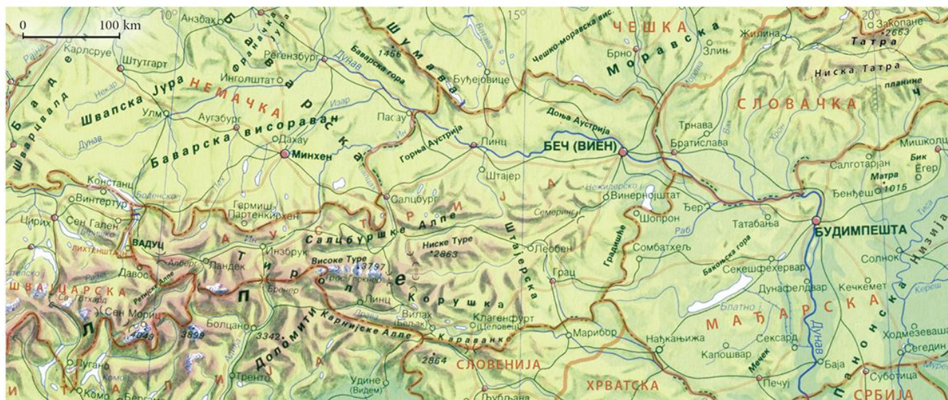
Горњи ток Дунава

678 ? (47,6 ?) ? (42,7 ?). ? 816.947 ? 2 ? 7,98% 1.690 ? ? 820 ? 2.850 ? 2.860 ? 34 ? 120 ? (253 ?), (283 ?), (510 ?), (116 ?), (256 ?), (707 ?), (945 ?), (509 ?), (184 ?) ? (368 ?), ? (160 ?), (350 ?), (459 ?), (966 ?), (706 ?), (699 ?) ? (926 ?).