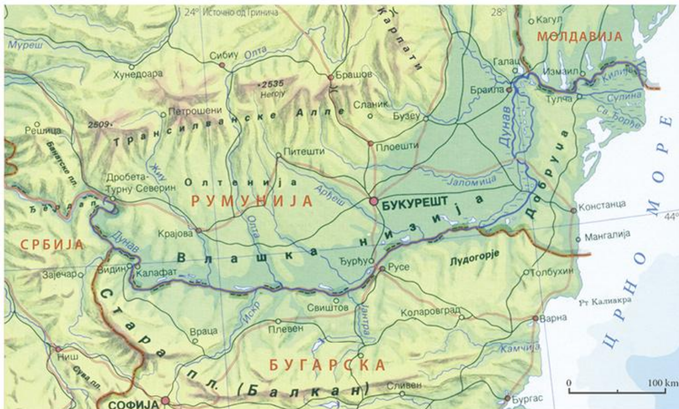
Доњи ток Дунава