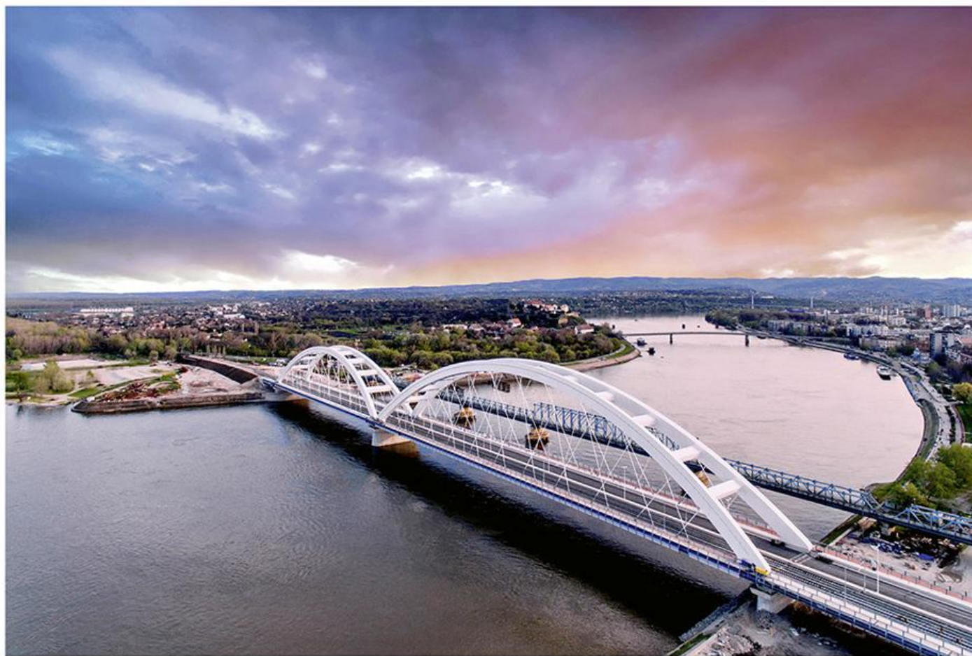
Дунав код Новог Сада

????????? ??????????????; ?????????????? ?????????????