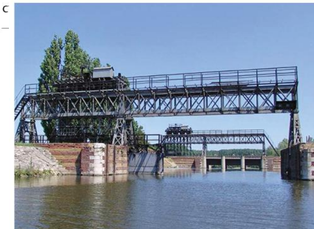
8. Ајфелова преводница код Бечеја, споменик културе од изузетног значаја, 1899.

?????????? ?? ????????? ????????? ??????? ??? ?????????