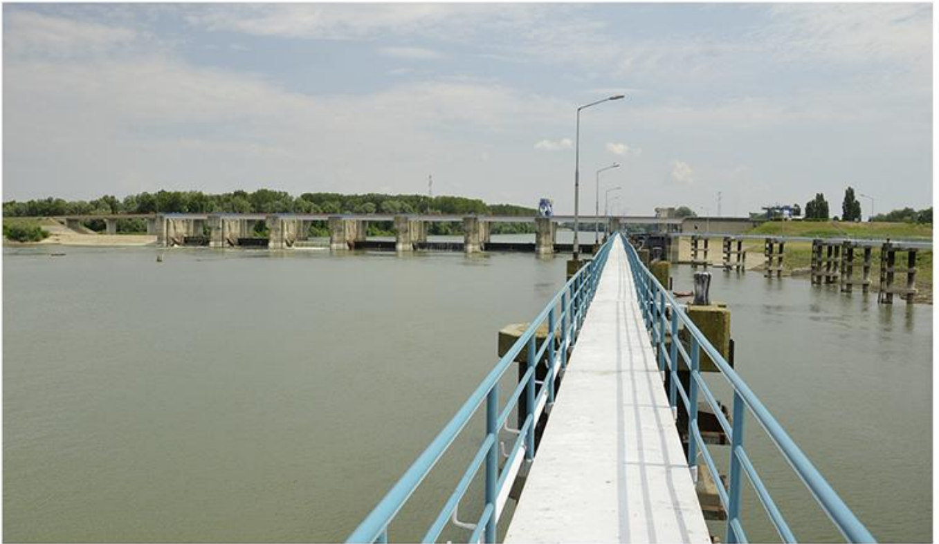
3. Брана на Тиси код Новог Бечеја, поглед с низводне стране