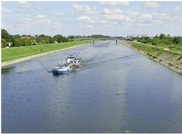
7. Канал Савино Село – Нови Сад, за пловидбу