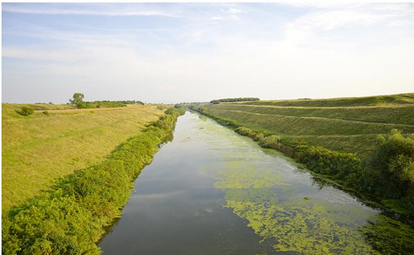
2. Магистрални канал ДТД Банатска Паланка – Нови Бечеј, деоница у зони Потпорањске вододелнице

?? ?????? ???? ? ?????? ?? ?????????? ?????????, ??? ?? ?????????????? ???? ???? ?? ?????????? ?????? ????. ?? ??? ?????? ?? ?????????? ?????????????? ??????? ??????? ???????.