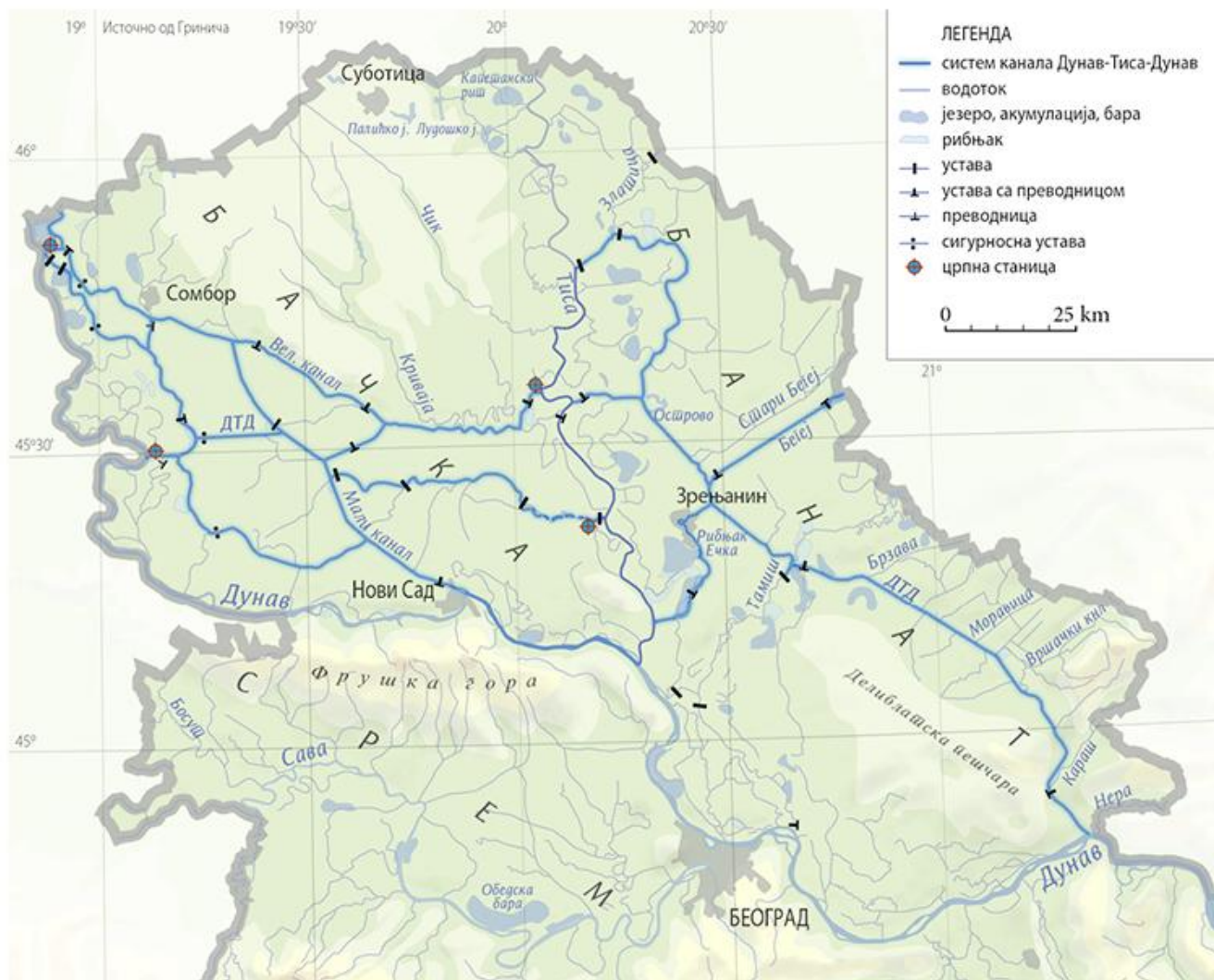
1. Каналска мрежа Хидросистема Дунав–Тиса–Дунав