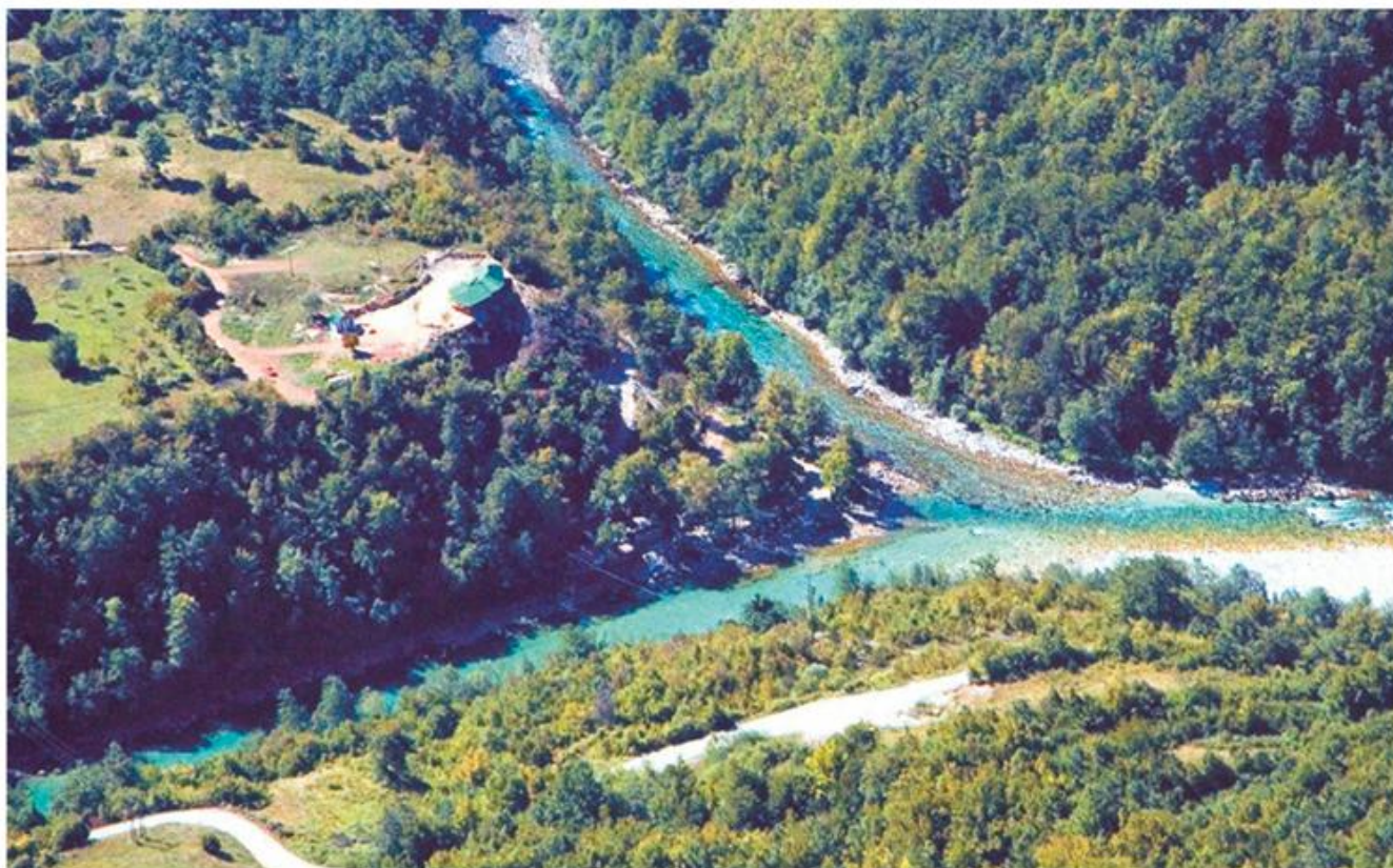
Састав Пиве и Таре код Шћепан Поља

????????? ??? ?? ??? ? ? ?????? (Drinus). ?????? ?????? ??????????-????????? ??????? 9. ??????, ??????? ??? ?????? ?. ??? ? ? ?????? ??????? ??????. ?????? ?????????????????? ?????????????? ?????????? ?????????? ?????????? ?? ??? 15. ??????, ??? ? ? ?????? ?????????????? ?????????? ??????????, ?????????? ? ??????. ??? ? ? ?????? ?????????? ??????? ?? ?? ??? ?. ?????????????? ??????? ?????? ?????????????? ?????????? ? ??????, ?????????? ?????? ??????. ??????, ?????????????? ?????????????? ?? ?????????? ?? ?? ??????? ?????? ??? ?????????????? ??????? 10--20 ?? ??????? ?? ??? ?. ????, ?????? ?? ?????????? ?????????? ?????????????? ??????? ?? ??? ?????? ?? ???, ??? ?? ?????? ??? ? ?????????????? ?????????????? ?? ??? ???, ?????? ?????? ? ???????, ?? ??????, ? ?????????, ?????? ? ???????, ?? ?????? ?a?? ?. ?? ??? ? ? ?????????? ??? ???? ???? ?????????????? ?????? ?????????????? ?????? ??????, ??? ? ? ??????? ?????????? ?????????? ?? ?????????? ??????????????. ?????? ?????? ?????? ? ??????, ?????????????????? ?????????????? ?? ?????? ?????????? ?????? ?????????? ??????? ?? ? ?????????????? (Domavia). ?????? ?????? ?? ?????? ?????? ?? ?????????????? ? III ?, ? ?????? ?????????????? ?????????????? ?? ?? ??? ?????? ?. ? ?????????? ??????????, ?? ??? ?????????, ? ?????????? ?????????????? ?????????? ?????? ?? ?????? ?????? ?????, ?????????? ?? ??????,