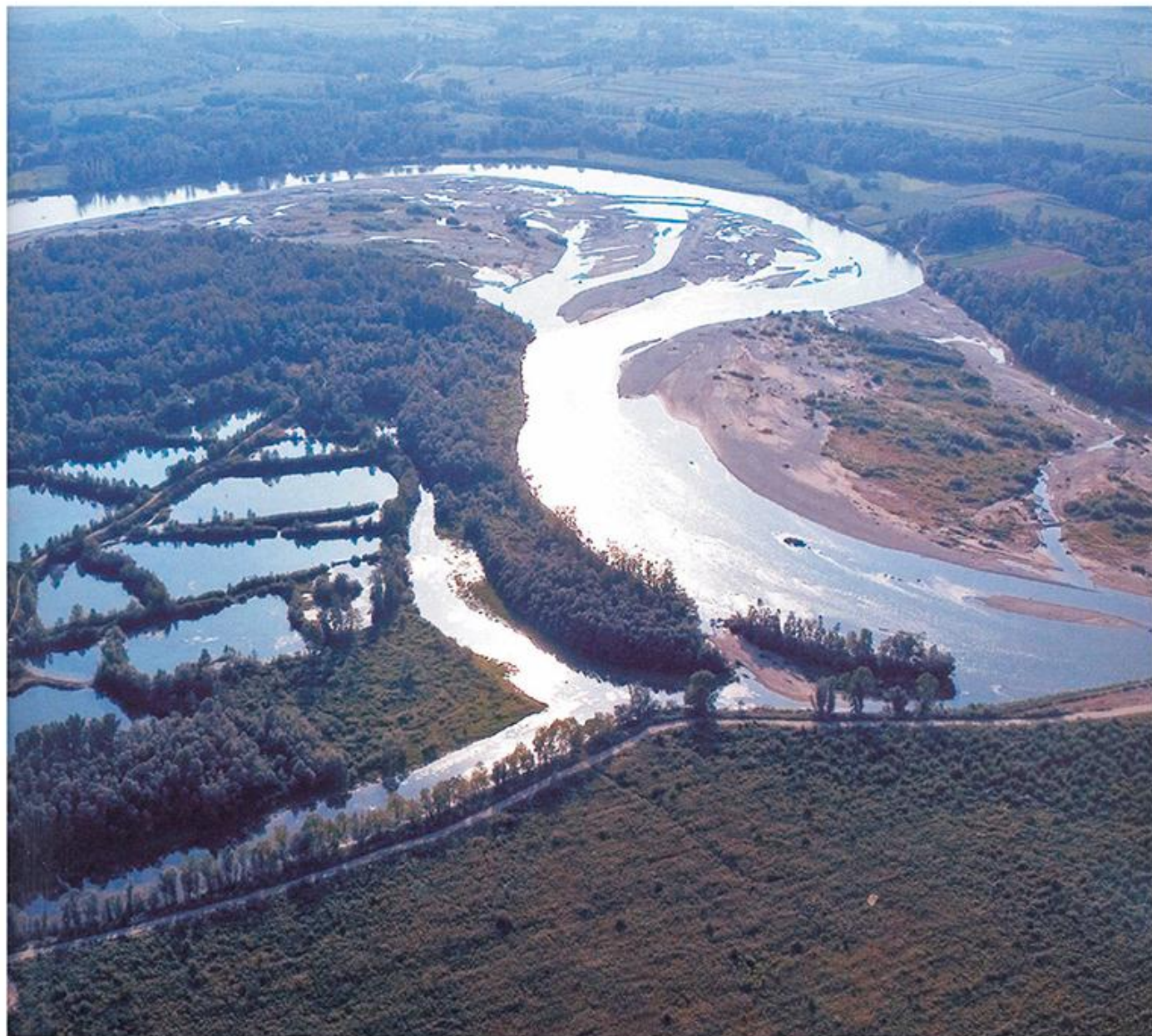
Дрина у доњем току

?????: ??; ??? II--IV; ?? I; ??; ???; ?. ?????, ??????? ???? ?????????, ?? 1922; ?. ?????????????, „???? ? ?????????”, ?????, II, ?? 2007.