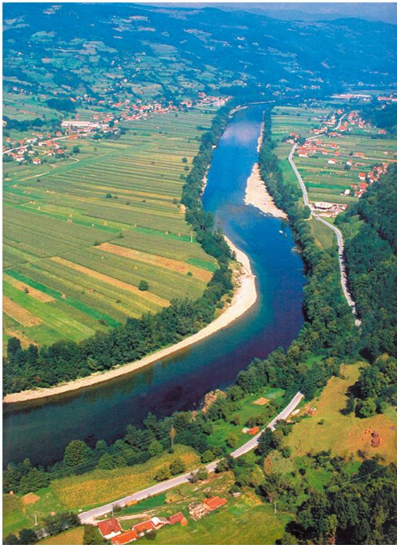
Дрина код Бајине Баште