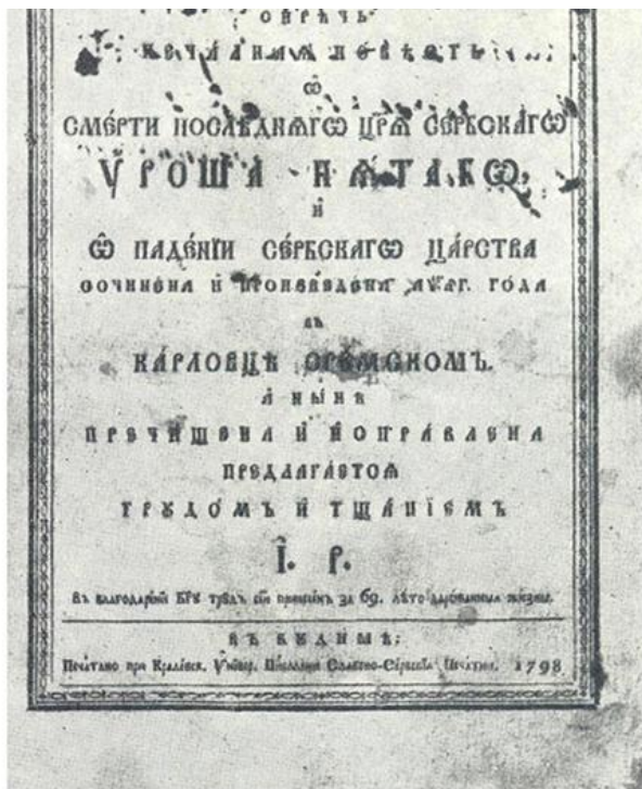
Јован Рајић, Трагедија , Будим 1798.

???? ? . ?????????? ?? ??????? ??????? ? . ??? ???????