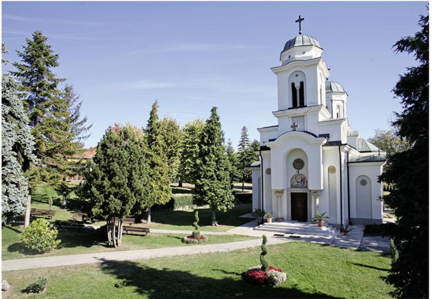
Благовештенска црква манастира Дивостин

???? ? . ????? ?? 1718. ??? ???? ? ????? ??????. ?? ????? ??????-???????? ?????? ????? ?? 1739. ??????????. ????????? 1826. ?????? ????? ?? ?????? ??? ???? ,??? ????????????? ?????, ??? ?? ? ?? ?????? ???? ? ??????????, ?? ??????. ?????? 1861. ?????? ?? ?????????? ?????????????? ?????? ? ?????????? ?? ?????????? ?????????? ? ??????????. ?? ?? ???? ??????, ?????????? ?? ??? 500 ?????????? ??????, ??? ?? ???? ?????? ?????????? ?????????? ?????? ?? 1861. ?????? ?????? ?? ?????? ?????????????? ??????. ??? ?? ?? ?????? ?????????????? 1872. ?????????? ??? ?????? ?? .??? ?????????????? ? ?????? ??????, ?????????? ?? ? ?????????? ? .??? ?????? ?????????? ??????. ?????? ?? 1872. ??? ?? ? ?????? ?????????????, ? ?????? ?? ???? ???? ? ?????? ?? ?????????? ??????. ?????? ?? ?? ??????, ?????? ? ?????????, ? ?????????? ??????. ?? ?????? II ?????????? ???? ?????? ? ? .?? ?????? ?? ?? ???? ?? ?? с?????? 1969. ? ?? ?????? ?????? ?? ?????????? ?????? ? ???? ?????????????? ??????????????. ?????????????? ?????? ????????? ? „????????????“ ?????? ?? ?????? ?? 1901. ?????????? ?????? ?????? ? ?????? ?? ?????? ?????????? ??????????, ? ?????? ?????????? ? ?????????? ?????? ?? ? ?????????? ?????????? ?????? ??????????.