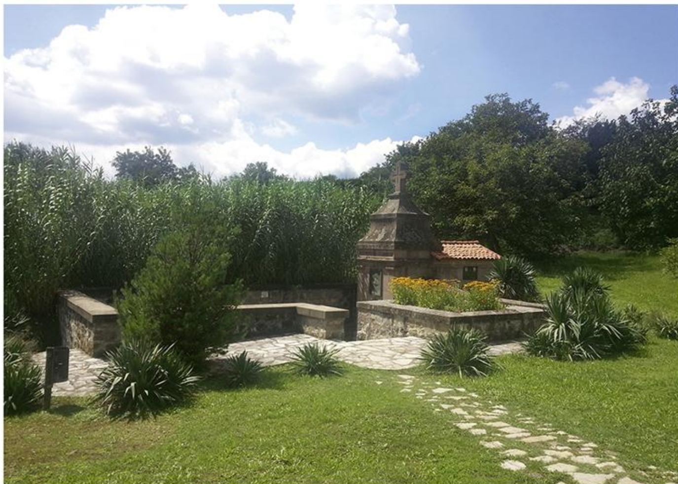
Манастир Дивостин, извор Светиња, 1901.