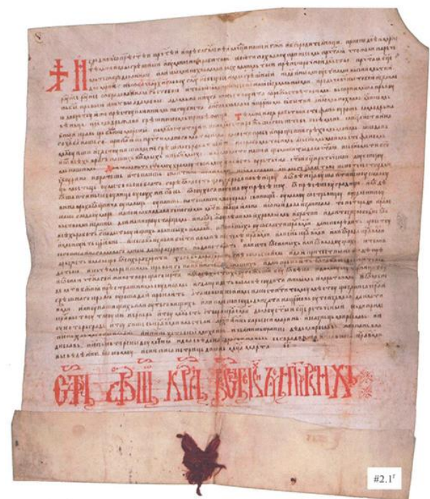
Повеља краља Милутина опатији Свете Марије Ратачке, 1306

?????????????? ??? ? ? ????????? ?? ??????? ??????????????. ??????? ?????? ??????????. ????????? ? ??????????????? ?? ?????? ? ?????? ?? ?? ?? ? ??????, ?????????? ? ?????????????????????????? ?? ?? XIV ?, ?? ?? ??????. ??????????????? ?? ????????? ? '? ???? ???? ???? ???? ???? ???? ????.