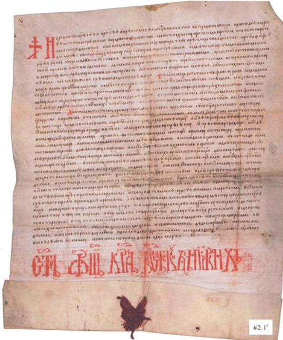
Повеља краља Милутина опатији Свете Марије Ратачке, 1306

????????????? ?????? ?? ?????????? ?? ??????? ??????????????. ??????? ?????? ??????????. ?????????? ? ?????????????? ?? ??????? ? ??????? ?? ?? ?? ? ?????????, ?????????? ? ?????????????????????????? ?? ?? XIV ?, ?? ?? ??????. ??????????????? ?? ?????????? ? '?? ?????? ?????? ?????????? ??????? ?????????????.