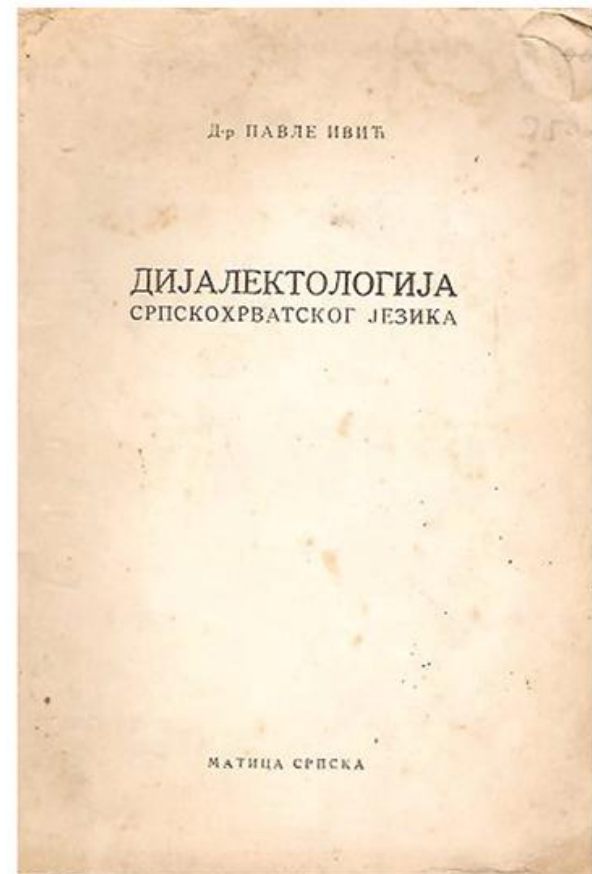
Павле Ивић, Дијалектологија српскохрватског језика , Нови Сад 1956.

?????????? ??????? ????????????? ?????????? ?? ? XX ?. ????? ????????????? ? ??? ?????? ? ?????? ?? ?? ??????? „???????? ??????“ ??????? ??????? ?. ? ??? ?? ????????? ????????????? ??????? ?????????????? ?. -- ????????????? ?????? ? ?????? ?????????? XX ?. ? ?????? ?????? ? ????????? ??????? ?????????? ????????????? ????????????????? ?????????????????? ?. ??????? ? ????????????????? ?????????? ? ?????? ??????? ????????????????? 2015. ?????????? ?????????? ?????????? ?????????? ?????????? ?????????? (????????????????? ?????????? ?????????? ?????????? ??????????