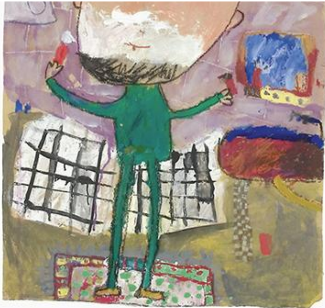
Таша се брије, комбинована техника, темпера, аутор Д. Алић (6) 1998 (МПУ)

????????? ????? ?? 1960. ? ????????????? ?????