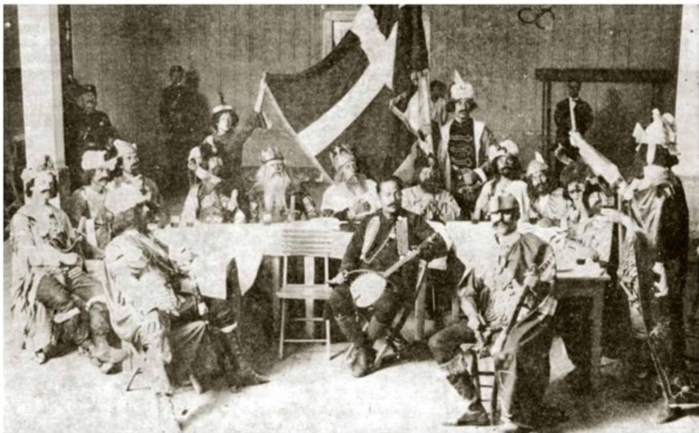
Слава Привредно-културне матице за сјеверну Далмацију, Видовдан, 1929.

????? ?????? ?????????????? ?????????????????? ? ?????????????? ?????, ?????? ?????????????? ?? 18. V 1941, ?.. ?? ?????????????? ?????????? ?????????? ? ????. ?????????? ?? ?????????????????? ?????????????? ?????? ?? ?????? ?????????, ?????????? ?? ?????? ??????–?????? ?? ?????????????? ?????????????? ? ?????????, ??? ? ?????????? ?????????????? ?? ?????? ?????????? ? ?????????? ??????, ??????????, ?????????????? ? ?????????????? ?