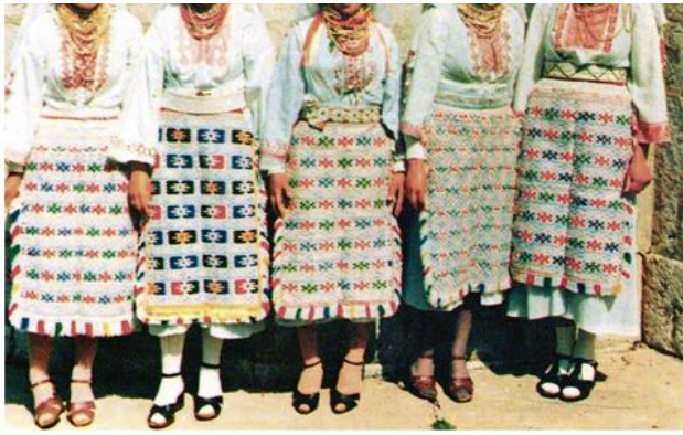
Девојке из Отишића у врличкој народној ношњи

?? ????? ?? ????? ??. ?? ? ?????? ?????????