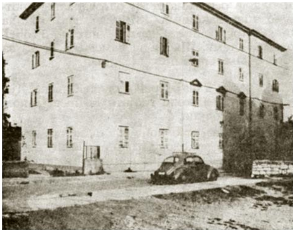
Зграда некадашње Православне богословије у Задру

?????? ?????????? ?????? ?? ?? ????????? ??????