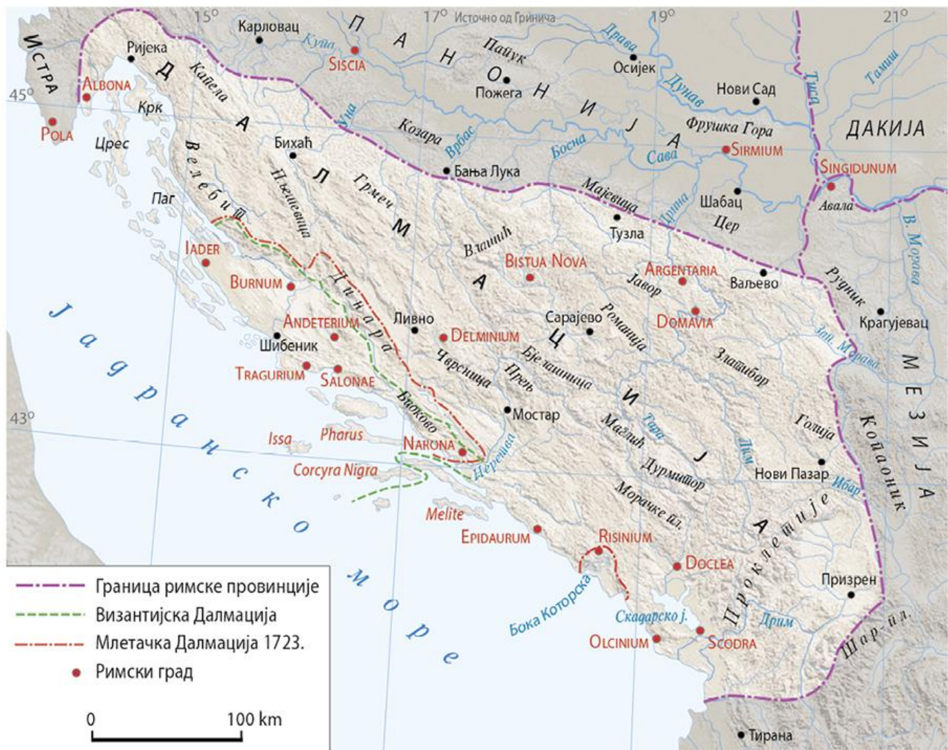
Област Далмације кроз историју

?????. ??? ?????? ?????????? ?????????? ?? ?? ?????????? ?????? ?? ?????, ? ???- ?????? ?? ?????? ??? ?????? ?????????, ?????? ? ??????????, ???? ???? ? ?????? ??????. ?????? ?????? ?? ?????? ?????? ?? ?????? ?? ?????? ?? ?????? ?? ?????-????? ?? ?????, ?????? ?? ?????? ?? ?????? ? ?????? ?? ?????? ?????? ?? ?????? ?? ?????? ?? ?????? ? ?????????? ? ?????????? ??????????. ?????? ?????????? ??????, ? ?????????? ?????? ?????? ? 1.900 ?, ?????? ?? ?????? ?? ?????????? ??????????.