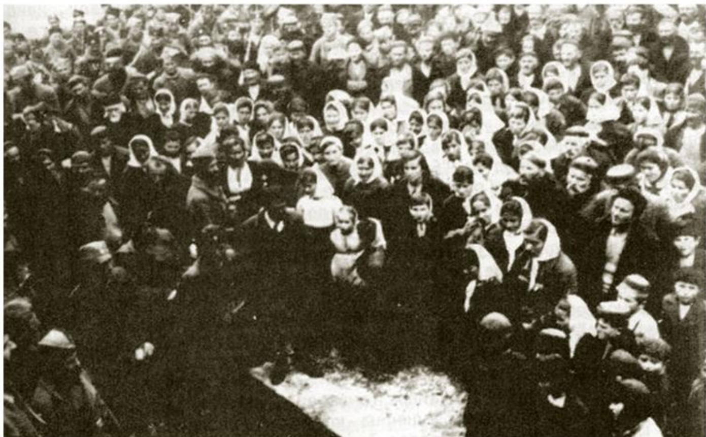
Прослава Видовдана у Далматинском Косову, 1943.