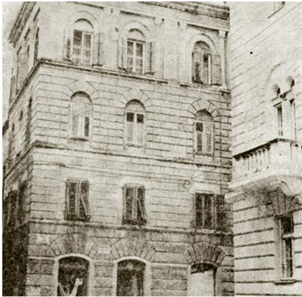
Зграда некадашње Српске женске школе у Задру

?? ?????? ?????????? ?????????? ?? ?????????? ??????????