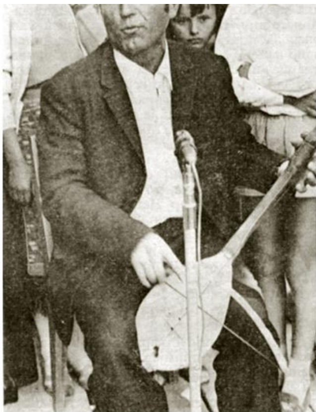
Народни гуслар код цркве Лазарице у Далматинском Косову

?? ???? ?.. ???? ?? ?????????? ???????? ?????????????