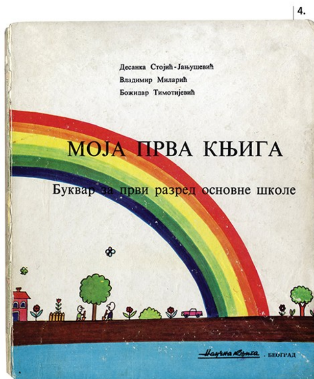
1. Први српски буквар инокса Саве, Венеција 1597. • 2. Буквар и читанка Ђ. Натосевића 1875. • 3. Буквар С. Чутурило 1886. • 4. Моја прва књига 1973 (ПМ, Бг)

???? ?? ????? ? . ????????? ???? „?????”, ?? . ????????? ???? ????????? ????????? ???? ?????, ????? ?? ????????? ????? ????????? ?? ????????? ????????? . ????????? ?? ?? ????????? ????? ? „????????”, ?? .