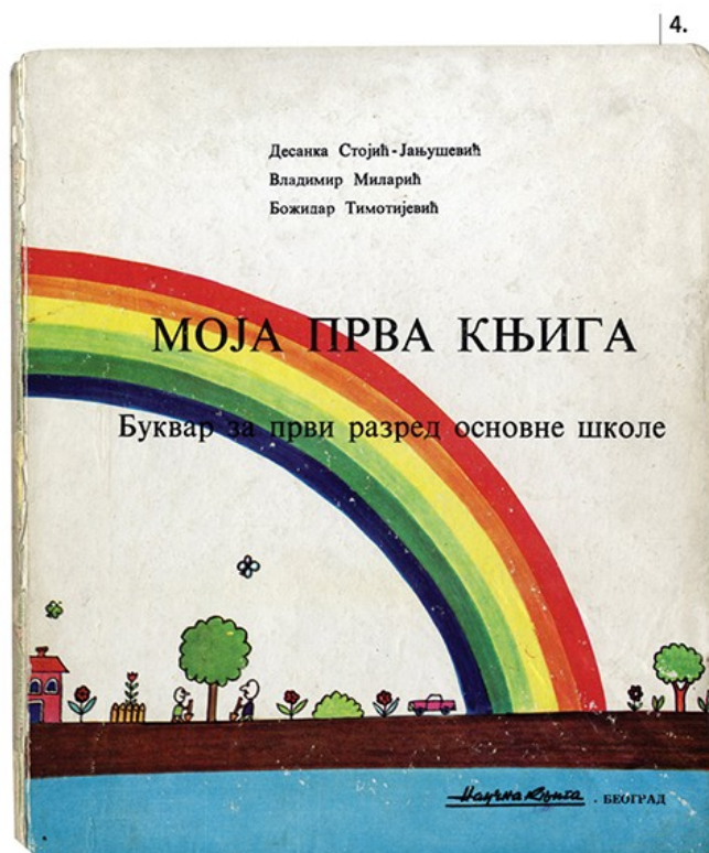
1. Први српски буквар инокса Саве, Венеција 1597. • 2. Буквар и читанка Ђ. Натосевића 1875. • 3. Буквар С. Чутурила 1886. • 4. Моја прва књига 1973 (ПМ, Бг)

???? ?? ????? ? . ????????? ???? „?????”, ?? . ????????????? ???? ????????????? ????????? ???? ????????????? ????? ??????, ???? ?? ????????????? ????? ????????????? ?? ????????? ???? ??????????. ????????? ?? ?? ????????? ????????? ?????? ? „?????????”, ?? .